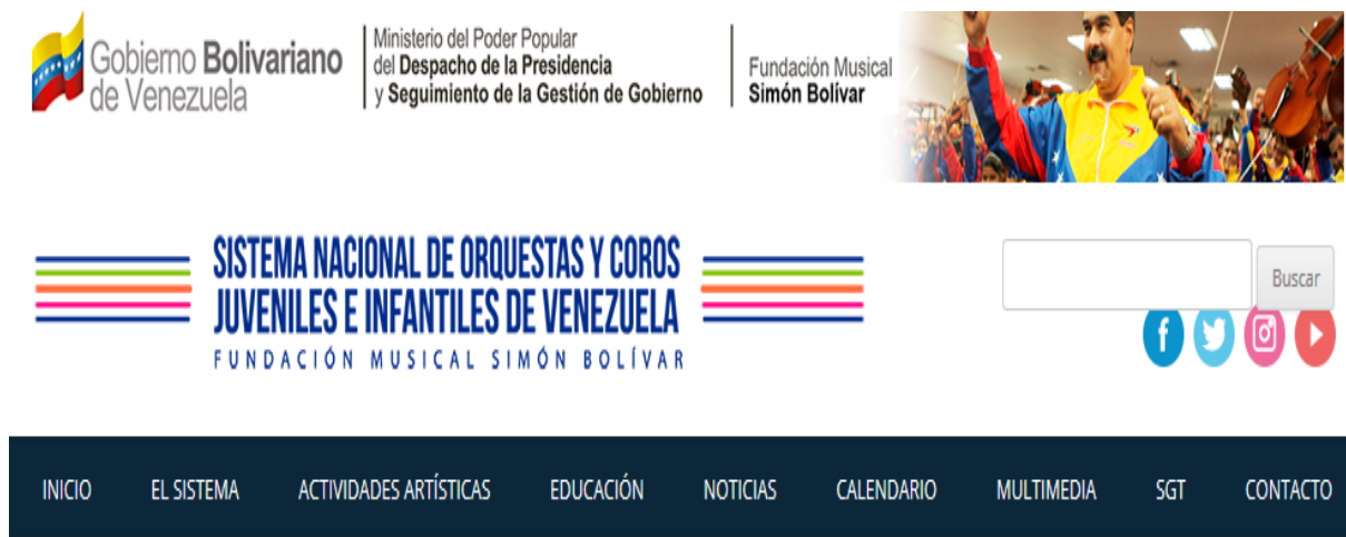
Page d'accueil du site officiel du Sistema.

Le site web du Sistema 231 , en page d'accueil, dans la partie supérieure droite, présente Maduro. Pourquoi faire ? En tout cas, si c'est une reconnaissance du gouvernement pour son soutien, il faudrait mettre tous les présidents qui ont apporté leur aide, en commençant par Carlos Andrés Pérez. Aussi, dans la partie supérieure droite, il y a des mots en gras : « Bolivariano... Despacho de la Presidencia y Seguimiento de la Gestión de Gobierno... Simón Bolívar ». Est-ce ainsi que le gouvernement bolivarien s'approprie le programme ?