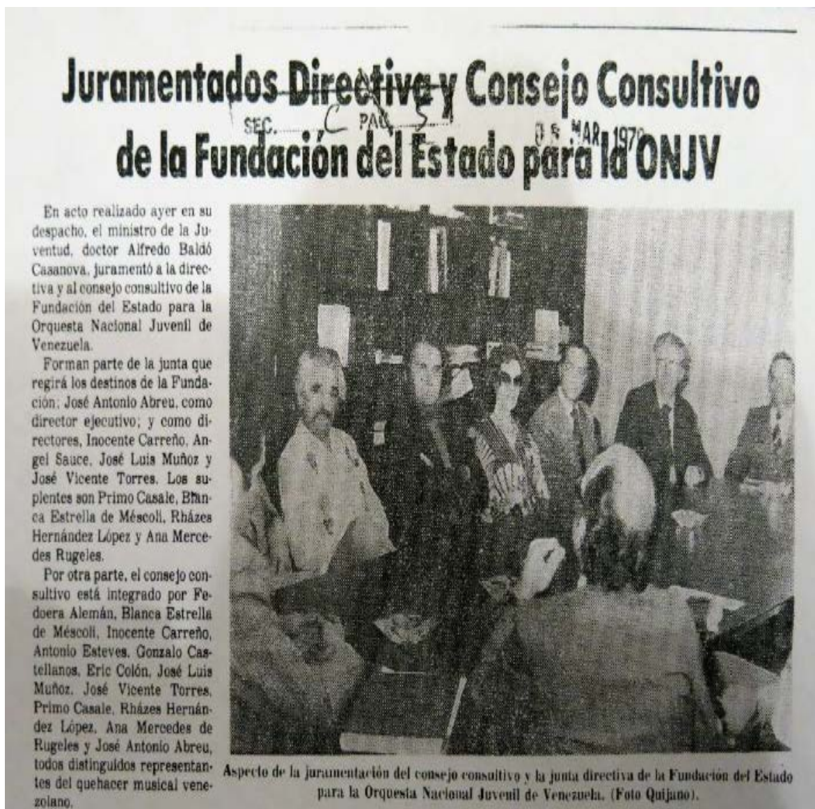
Annexe 4. Article du journal El Nacional, Juramentados Directiva y Consejo Consultativo de la fundacion del Estado para la ONJV, 5 mars 1979.