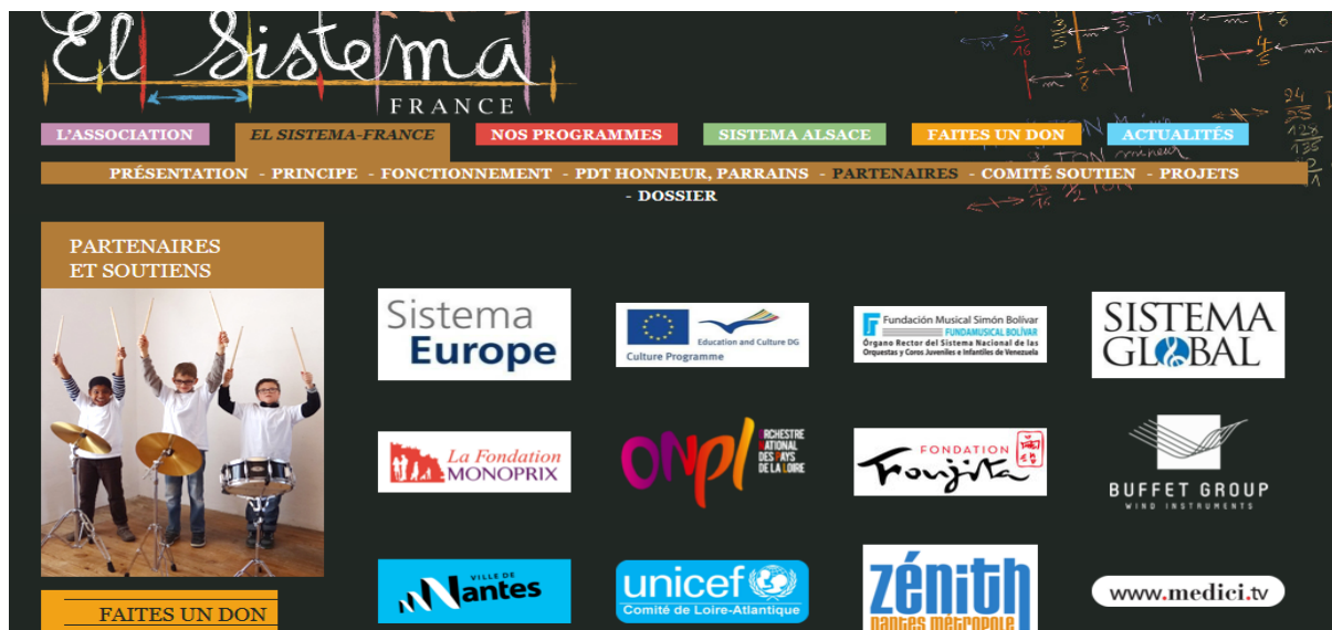
Page d'accueil du site officiel El Sistema France.

Sur la liste de partenaires et soutiens se trouve El Sistema vénézuélien, cependant on ne trouve pas le type de partenariat ou de soutien qu'il apporte. Parmi les objectifs de l'association française, nous avons trouvé : « Entretenir et consolider les liens avec la fondation musicale El Sistema au Venezuela ainsi que les fédérations européennes et mondiales appliquant le programme 274 . » Il existe un lien de coopération évident avec l'association française comme avec l'association argentine. El Sistema ne soutient pas tous les modèles pilotes, comme par exemple Child's play India foundation qui ne reçoit aucun soutien de sa part.