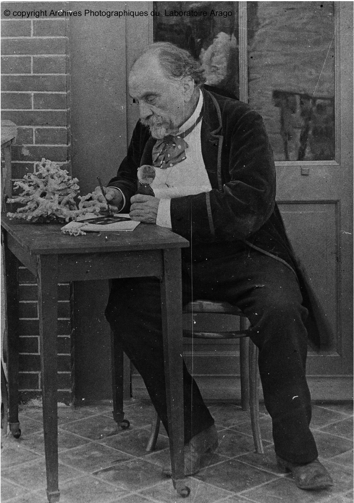
Lacaze-Duthiers dessinant une branche de corail