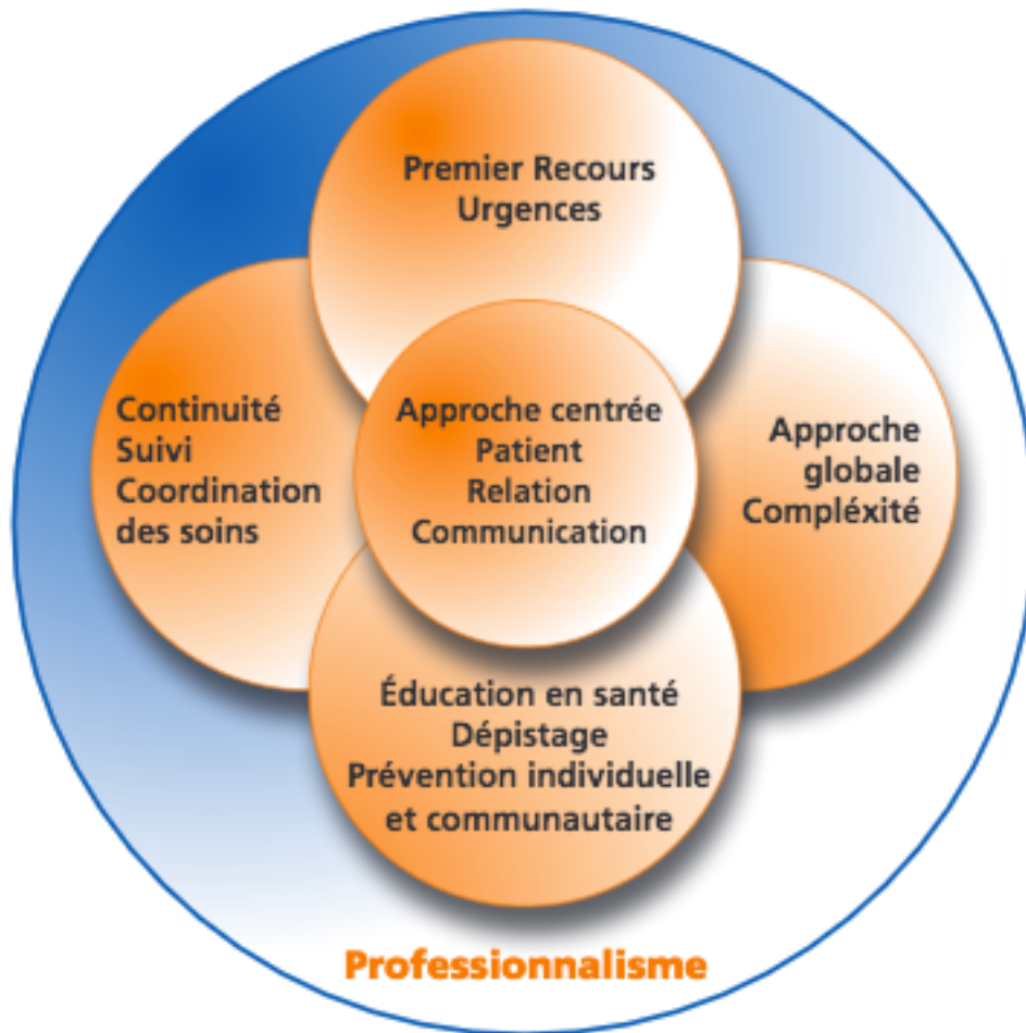
Figure 3 : La "marguerite" des compétences du médecin généraliste

Source : Compagnon L, Bali P, Huez J-F, Stalnikiewicz B, Ghasorossian C, Zerbib Y, et al. Définitions et descriptions des compétences en médecine générale. Exercer. 2013;24(108):148–55