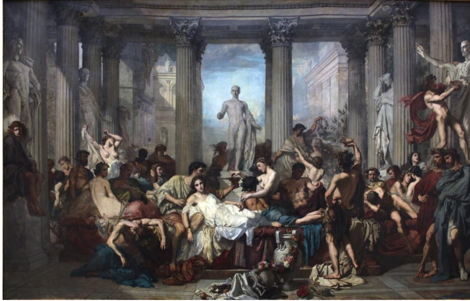
Les Romains de la décadence , Thomas Couture, Paris, Musée d'Orsay, huile sur toile, 472x722, 1847