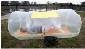
Sleeping Bag Dress, Ana Rewakowicz, 2000

créé à partir d'une structure alvéolaire servant à la fois de sac de couchage et de tente. Il épouse et soutient le corps tout en l'isolant de son environnement extérieur permettant ainsi de dormir n'importe où. Au début des années 2000, Ana Rewakowicz invente le prototype SleepingBagDress 96 . Il prend la forme d'une robe kimono polyvalente qui, lorsqu'elle est gonflée, se transforme en un contenant cylindrique pouvant