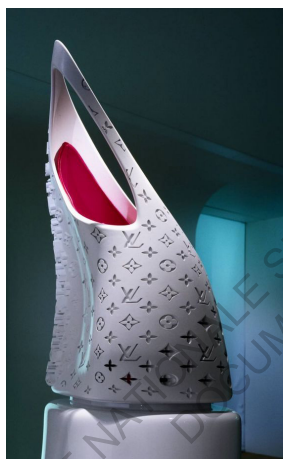
The Icon Bag , Zaha Hadid pour Louis Vuitton, 2006

par exemple la chaussure Superstar en partenariat avec Adidas ou encore le Icon Bag en association avec Louis Vuitton. Elle n'est pas la seule architecte à s'être essayée au design de mode. Elena Manfredini, une architecte italienne, a élaboré des séries de robes particulières pour leurs motifs découpés au laser cut. Nombreux sont les créateurs qui témoignent d'un intérêt pour les deux spécialités : nous venons d'évoquer quelques architectes devenus un temps des créateurs de mode, mais il faut aussi noter qu'à l'inverse, Paco Rabane, Pierre Balmain