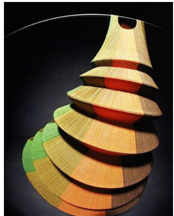
Pleats Please , Issey Miyake, 1988-1993

Le travail du vêtement selon une approche non anthropomorphique et la question du pli nous renvoient aux œuvres plissées du créateur japonais Issey Miyake. Entre 1988 et 1993, le designer fait naître la collection Pleats Please , un ensemble de vêtements-housses très amples et dont la plastique s'apparente à des formes géométriques particulièrement originales. Les créations de cette série sont faites en polyester et leur spécificité réside dans leurs proportions. En effet, une fois assemblés, les vêtements sont deux fois et demi à trois fois plus grands que leur taille finale. Ils sont ensuite passés un par un à la main dans une presse chaude afin de leur donner cet aspect plissé unique et permanent ainsi que des formes inédites et sculpturales. Par un tel procédé, Issey Miyake crée des enveloppes plissées géométriques qui recouvrent le corps sans pratiquement le toucher. Elles permettent à celui ou celle qui les porte de se mouvoir en toute liberté et avec une grande légèreté car le polyester ainsi transformé réagit de façon très expressive aux mouvements du corps.