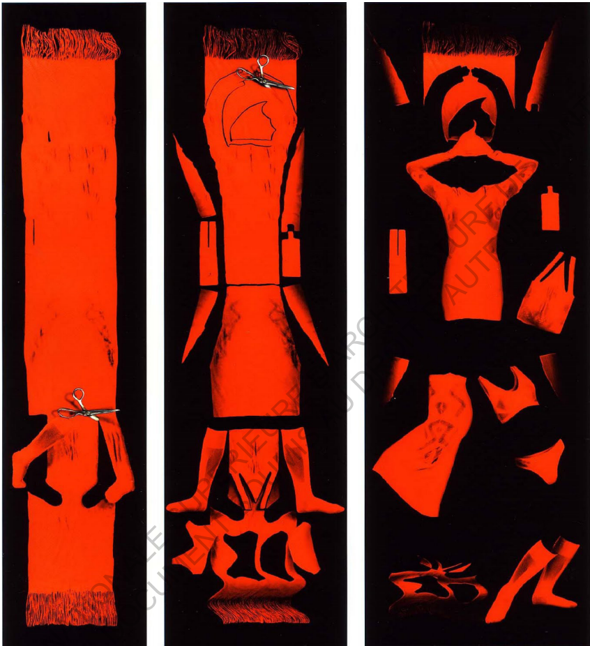
A-POC, Issey Miyake, 1999

Cinq ans après Pleats Please, Issey Miyake présente la collection A-POC pour A piece of Cloth , dans laquelle il développe le concept d'une pièce unique de tissu pour composer un vêtement. Ainsi le jour du défilé de présentation de la collection Printemps/été 1999, les 23 mannequins qui ont foulé le podium étaient reliées par un seul et même morceau d'étoffe. Cette mise en