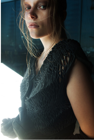
Hymenium Jacket , Julia Koerner, 2015

être utilisés que comme éléments de gaine. Les robes de la collection Biopiracy des designers Julia Koerner et Iris