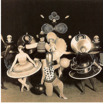
Le Ballet triadique costumes du Ballet triadique dans la revue Wieder Metropol , Berlin, 1926

rencontre entre l'homme danseur et l'espace de la scène. Le corps et l'espace sont soumis chacun à leurs propres