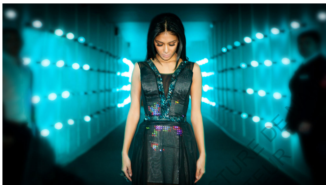
Twitter Dress, CuteCircuit, 2012

cette innovation, conçue en collaboration avec la marque Levi's. Le projet Jacquard est celui d'une veste dont le textile utilise les innovations propres à la domotique pour se connecter à nos objets du quotidien. Baptisée Levi's Commuter Trucker 129 , sa commercialisation avait été annoncée pour l'automne 2017, avec un prix d'entrée de 350 dollars. Il s'agit d'un produit niche destiné à une clientèle férue de nouvelles technologies. Elle est compatible avec les systèmes d'exploitation Android et iOS auxquels elle se connecte en Bluetooth et est capable de naviguer sur internet, de mettre une musique en route sur un lecteur, de prendre ou refuser des appels et d'envoyer des messages, le tout par simple commande vocale via le kit main libre. Enfin, terminons sur les produits de l'entreprise Spinali Design qui a élaboré des jeans et des maillots de bain connectés. Les jeans embarquent une fonction de géo-localisation et provoquent des vibrations sur le côté droit ou gauche pour indiquer la