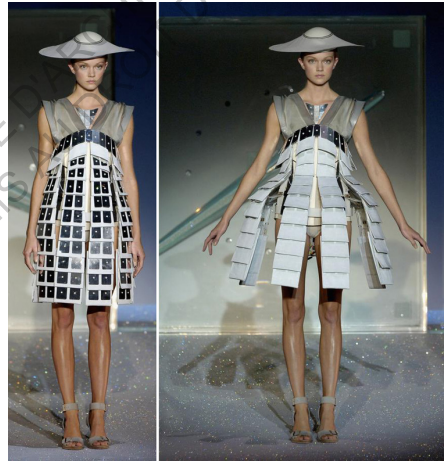
Before Minus Now, Hussein Chalayan, 2000

Le créateur de mode Hussein Chalayan est probablement le plus innovant en la matière. Considéré comme un designer « intellectuel » 131 , il s'affirme comme un véritable concepteur expérimental. Ses créations sont au carrefour entre le design, l'architecture, les nouvelles technologies, mais aussi la politique, la religion, la critique sociale et bien sûr la mode. Bon nombre de ses collections, après avoir été dévoilées sur le podium des défilés, sont ensuite exposées dans des musées, des biennales et autres événements d'arts contemporains.