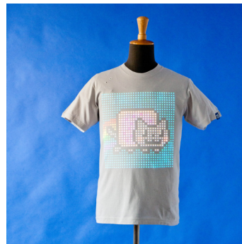
T-Shirt OS , CuteCircuit, 2012

Il existe notamment des t-shirt tel que le T-Shirt OS conçu par la société CuteCircuit, qui possède un écran intégré. Ainsi, une fois recoupé avec le système d'un téléphone portable, il est possible d'afficher des messages en temps réel sur son t-shirt. Une autre invention conçue par la même société britannique, est celle de la Twitter Dress . L'entreprise spécialisée dans la « wearable technologie » a mis au point cette robe nouvelle génération au moyen d'un réseau de LED couplées à la Wifi. Elle permet, selon la même logique que les T-Shirt OS , d'afficher les tweets reçus. Le projet Jacquard est également un exemple de tissu intelligent capable de se connecter à d'autres objets mais possède des fonctions tout autres. En 2015 lors de sa conférence annuelle, Google a ainsi fait connaître