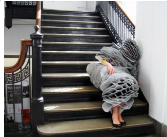
SleepSuit , Forrest Jessee, 2013

Le produit est constitué de tissu technique, dans une matière empruntée à l'armée russe, et qui rend les deux parties imperméables tout en protégeant le corps du feu et du vent. En 2013, inspiré par les travaux du chercheur américain Buckminster Fuller sur le sommeil polyphasique, Forrest Jessee a créé le Sleep Suit 95 . Il s'agit d'un dispositif