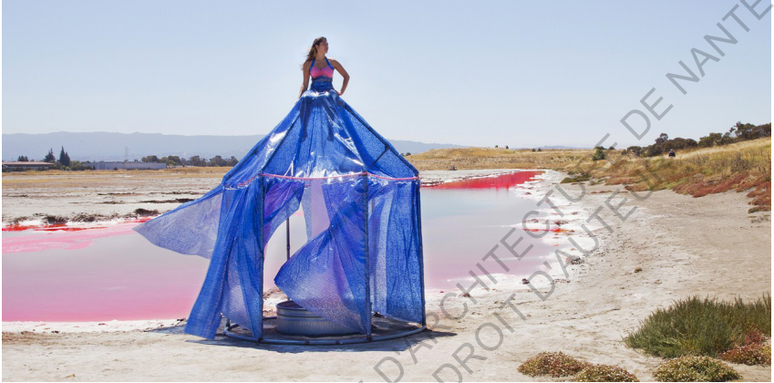
Dress Tents , Robin Lasser et Adrienne Pao, 2009

tout ce dont elles ont besoin sur leur dos. 101