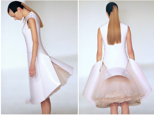
Airplane Dress , Hussein Chalayan, 2000

qui aura nécessité pas moins de 15 600 ampoules LED incrustées dans les tissus. L'année suivante les vêtements de la collection Reading embarquent à la fois des cristaux Swarovski et des faisceaux laser mobiles. Contrairement aux couturiers très médiatisés, Hussein Chalayan ne se plie pas toujours à l'obligation de produire deux collections par an pour qu'elles soient présentées à chaque nouvelle saison. Désintéressé face à la mode en règle générale, sa préoccupation est avant tout celle de l'évolution du corps humain et de son enveloppe. Il explore ces notions à travers certains concepts récurrents dans son travail tels que le déplacement, l'identité, l'isolement et l'oppression. Nous citons précédemment la collection Afterwords et ses housses de fauteuils convertissables en robes, mais elle est loin d'être la seule à traiter des thèmes évoqués. Pour la saison printemps-été 2000, Hussein Chalayan a présenté sa collection Before Minus Now qui comptait notamment la Airplane Dress . Composée de fibre de verre, la robe se métamorphosait sur le podium : sa « coque » rigide et ajustée s'ouvrait, contrôlée à distance, pour déployer une nouvelle robe tout en volume et aux lignes beaucoup plus douces. Et avec un mécanisme de contrôle similaire,