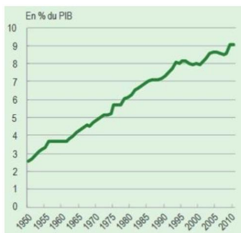
Figure 1 : Part de la CSBM dans le PIB

Champ : France métropolitaine, base 2005