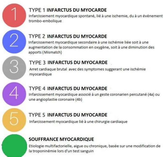
Figure 1, traduite d'après Chapman et al. (1)

Une concentration de troponine supérieure à la normale, mais stable sera plutôt en faveur d'une souffrance myocardique chronique