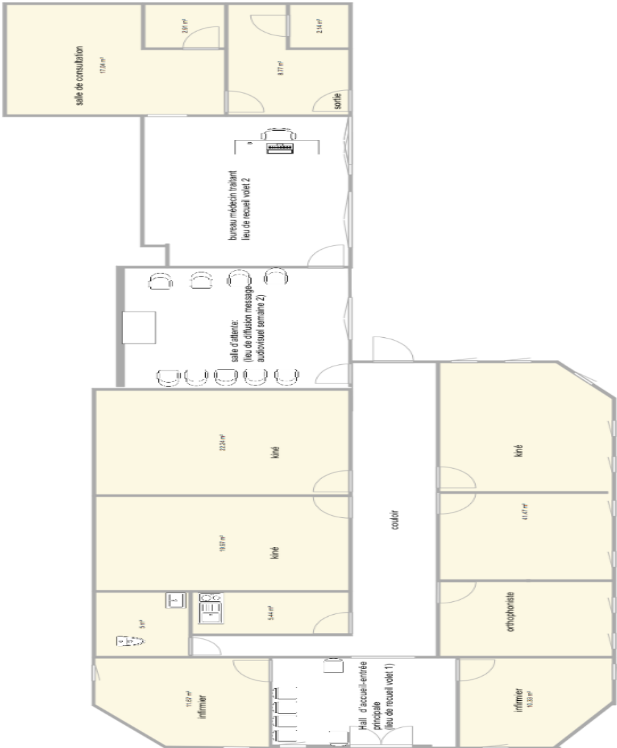
Annexe 1 : Plan du cabinet médical