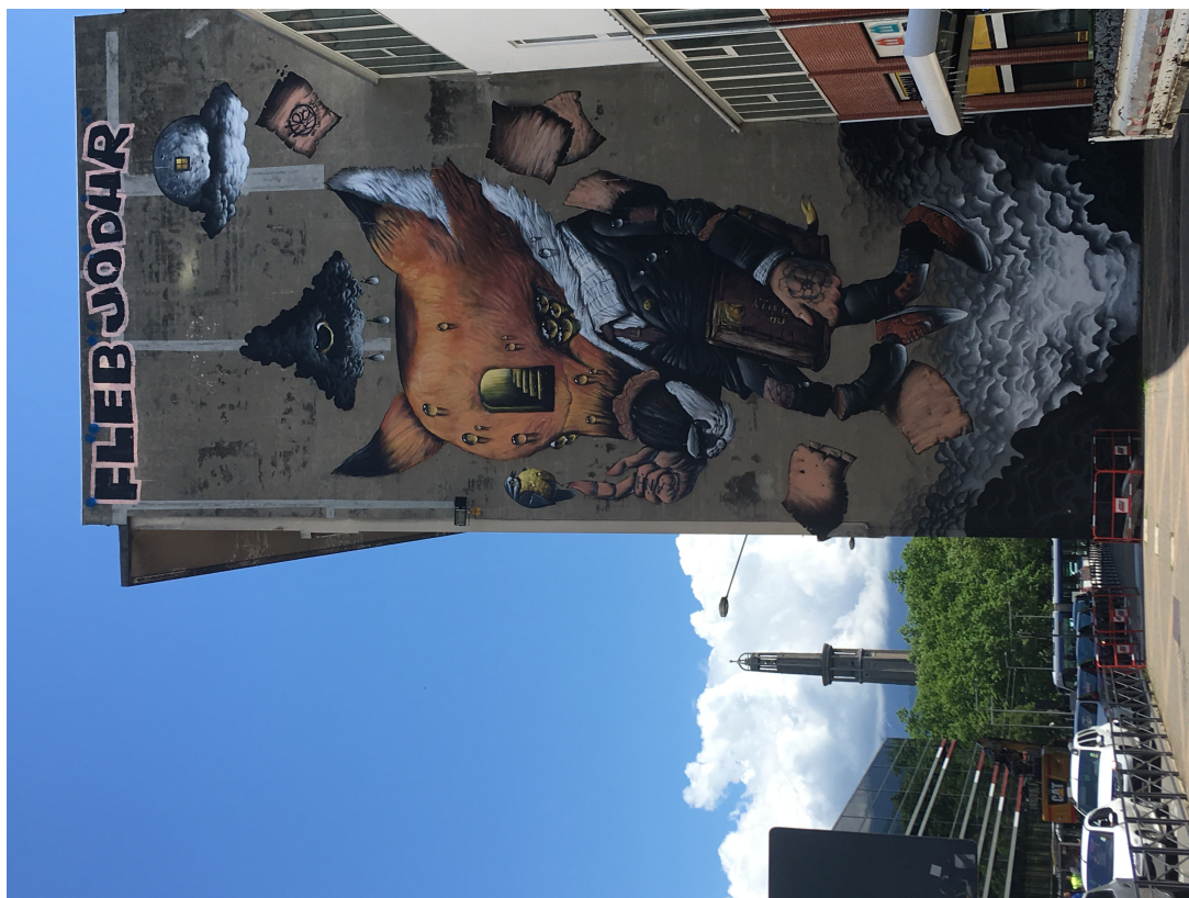
Annexe 4 : Quartier du Panier, Marseille