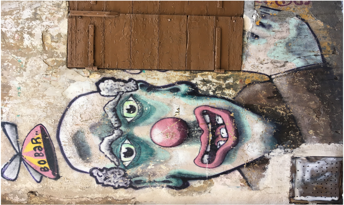
Annexe 5 : Quartier du Panier, Marseille