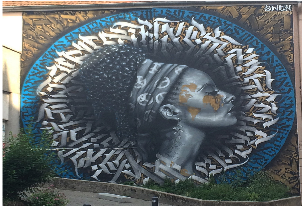
Illustration 1: Snek and Calligrafy, L'Arme de paix, rue de Doudart de Lagrée