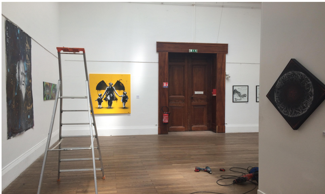
Illustration 2: Ancien musée de peinture, exposition Street art fest Juin 2017

genres, les styles et les cultures, ce festival vacille entre l'éphémère et la conservation de certaines performances artistiques. Dès lors, nous voyons que les organisateurs parviennent à trouver un équilibre entre liberté d'expression, performances et démocratisation de la culture.