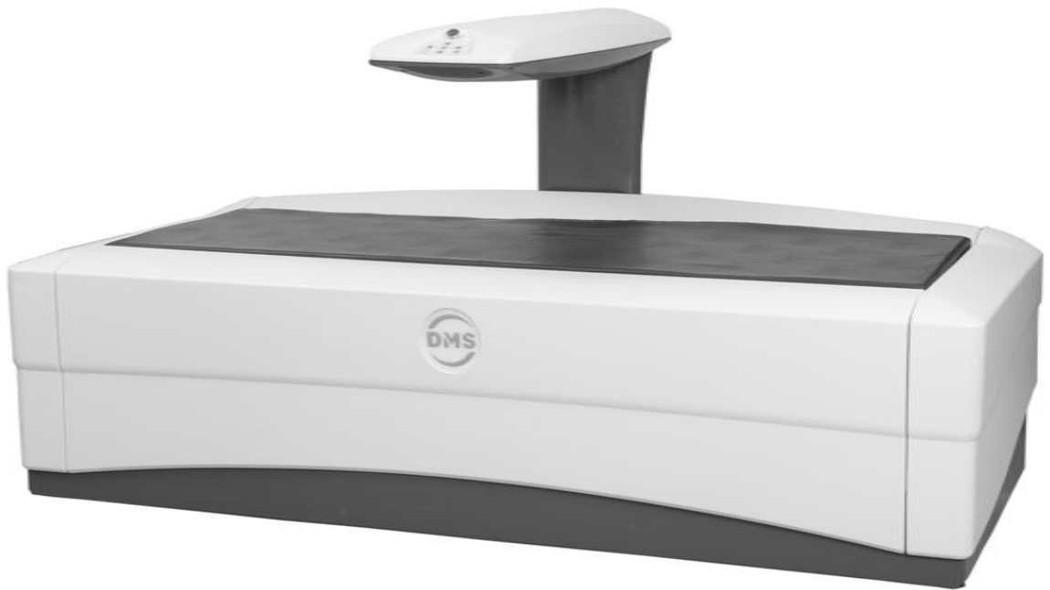
Figure 1 : Ostéodensitomètre STRATOS®, DMS (28)