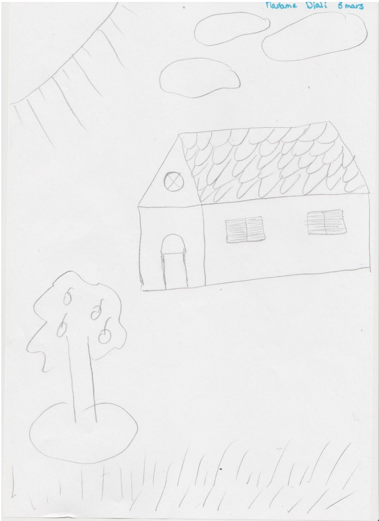
Annexe II : Dessin Madame Djali