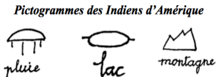
Illustration 1. Pictogrammes des Indiens d'Amérique

Le système pictographique est un premier pas vers l'écriture. Il témoigne du désir de garder une trace de la communication. Les pictogrammes, sortes de dessins figuratifs ou symboliques, représentent directement des objets ou des scènes de façon plus ou moins stylisée et reproduisent le contenu d'un message sans se référer à sa forme linguistique. Ils permettent d'assurer une communication au sein d'un groupe. Cependant la limite de ce système réside dans le fait qu'il est difficile d'interpréter correctement le message lorsqu'on est étranger au groupe qui utilise le système pictographique.