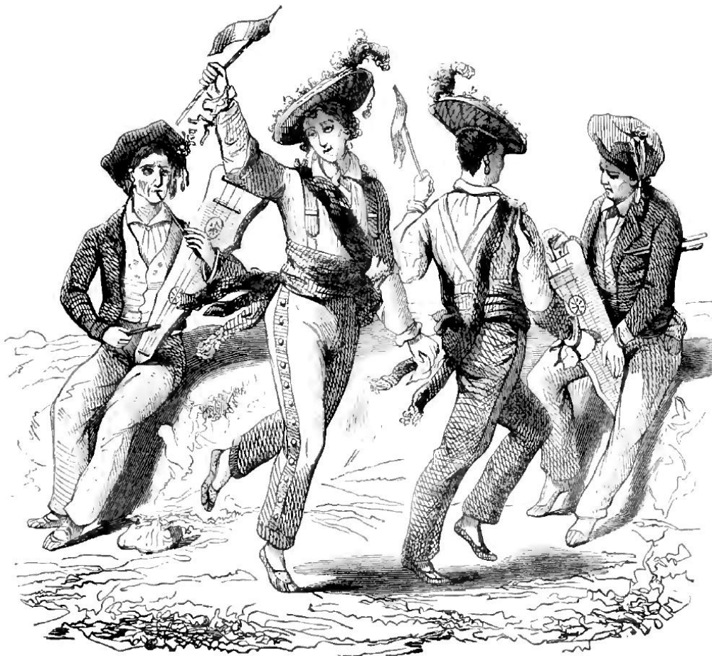
Musiciens basques accordant et exécutant la sounzouna. – Danseurs basques en costume de grand gala.

Gravures de l' Illustration du 25 octobre 1845.