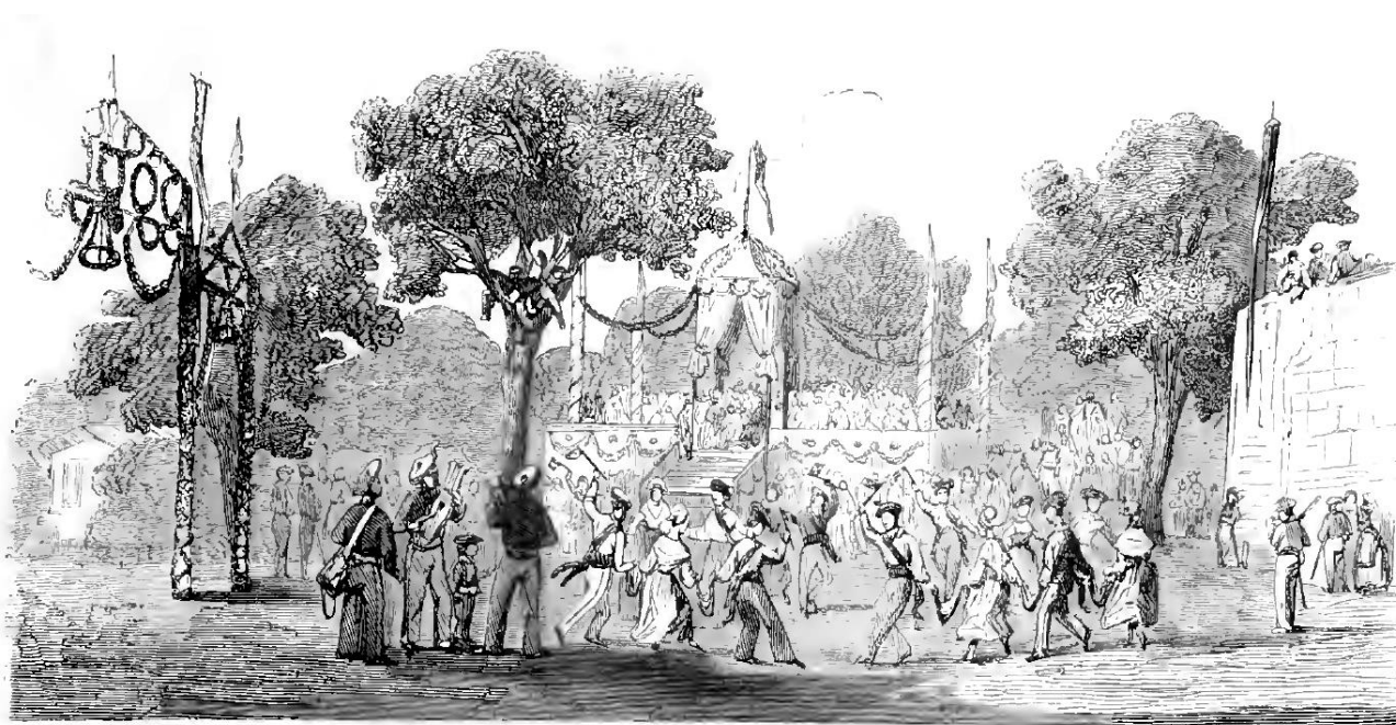
Danses basques sur l'emplacement du jeu de paume, à Cambo.