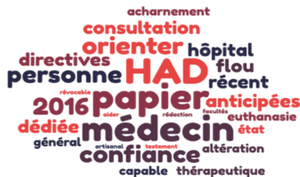
Figure 3. Représentations des directives anticipées

La figure 3 a pour objectif de mettre en lumière les connaissances des professionnels interrogés sur les DA prévues par la LL. L'état des connaissances semble fragile. La principale notion rapportée concerne le caractère « papier » des DA. Les MG semblent se placer au cœur de la démarche qu'ils pensent devoir effectuer lors d'une consultation dédiée. Ils associent régulièrement les DA à une structure HAD. La place accordée à la personne de confiance est importante.