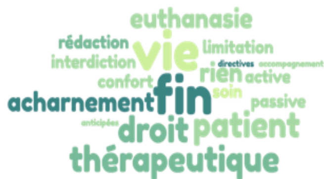
Figure 2. Représentations de la Loi Léonetti

La figure 2 présente les idées émises spontanément par les MG quand interrogés sur la loi Léonetti. Leurs connaissances concernent principalement le refus de l'acharnement thérapeutique et l'interdiction de l'euthanasie active. Si la loi est bien associée aux droits du patient en fin de vie, on remarque que le lien entre LL et DA est rarement fait.