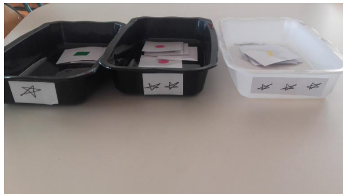
Boîtes avec niveau de difficulté croissante visible grâce au nombre d'étoiles

J'ai mis en place dans ma classe des brevets afin de favoriser la différenciation pédagogique. Certains brevets sont à difficulté croissante. Je pense ici au puzzle de la couverture d'un album étudié en classe. J'ai proposé aux élèves de réaliser le puzzle. Ils avaient alors trois niveaux de difficulté : 4 – 6 ou 12 pièces. Sur les boîtes de puzzle je n'avais pas dans un premier temps mentionné la difficulté : 1-2 ou 3 en référence au nombre d'étoiles sur le brevet. Les élèves ne savaient donc pas quel puzzle correspondait à quelle case sur le brevet proposé.