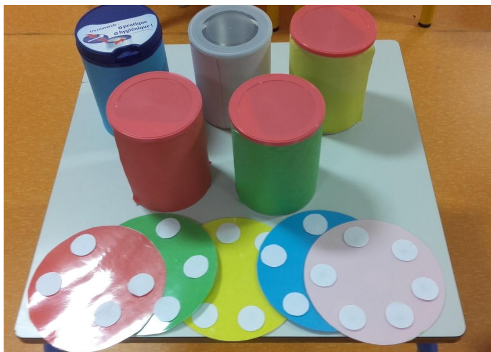
Boîtes et disques de couleurs permettant de visualiser l'atelier et le domaine correspondant. Les couleurs correspondent aux couleurs des domaines présents dans le cahier de réussite

Dans le cahier de réussites de chaque élève, les cinq domaines de l'école maternelle sont présents : « Mobiliser le langage dans toutes ses dimensions », « Agir, s'exprimer, comprendre à travers les activités physiques », « Agir, s'exprimer, comprendre à travers les activités artistiques », « Construire les premiers outils pour structurer sa pensée » et « Explorer le monde ». A ces cinq domaines nous avons rajouté une compétence « Devenir élève, autonomie ». Cette compétence est travaillée tout au long de la vie de l'élève. Nous la retrouvons dans les compétences du socle commun de connaissances, de compétences et de culture. En revanche, elle est tout de même travaillée dès l'école maternelle à travers notamment les activités ritualisées et correspond à deux domaines du socle : « Méthodes et outils pour apprendre » ainsi que « la formation de la personne et du citoyen ».