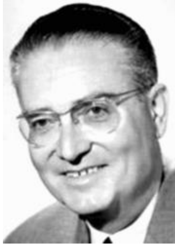
Figure 11 : André Castelot .

André Castelot, de son vrai nom André Storms, est un journaliste, homme de radio et de télévision et écrivain d'histoire. Il est un vulgarisateur d'histoire familier des Français.