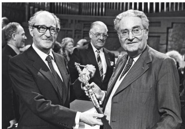
Figure 10 : Alain Decaux et André Castelot, 1979.

Né à Lille en 1925, Alain Decaux était un journaliste, homme de l’audiovisuel, dramaturge et écrivain d’histoire. Membre de l’Académie française, il a occupé le devant de la scène médiatique durant un demi-siècle avec ses émissions de vulgarisation historique, devenant ainsi le symbole de l’histoire médiatisée.