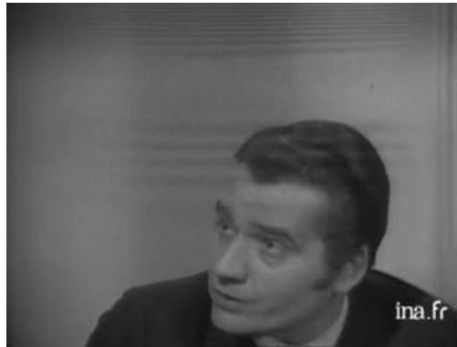
Figure 12 : Jean-François Chiappe . Source : http://boutique.ina.fr/images_v2/320x240/CPF86606187.jpeg

Né en 1931, Jean-François Chiappe était un écrivain spécialisé en histoire et un producteur de radio et de télévision.