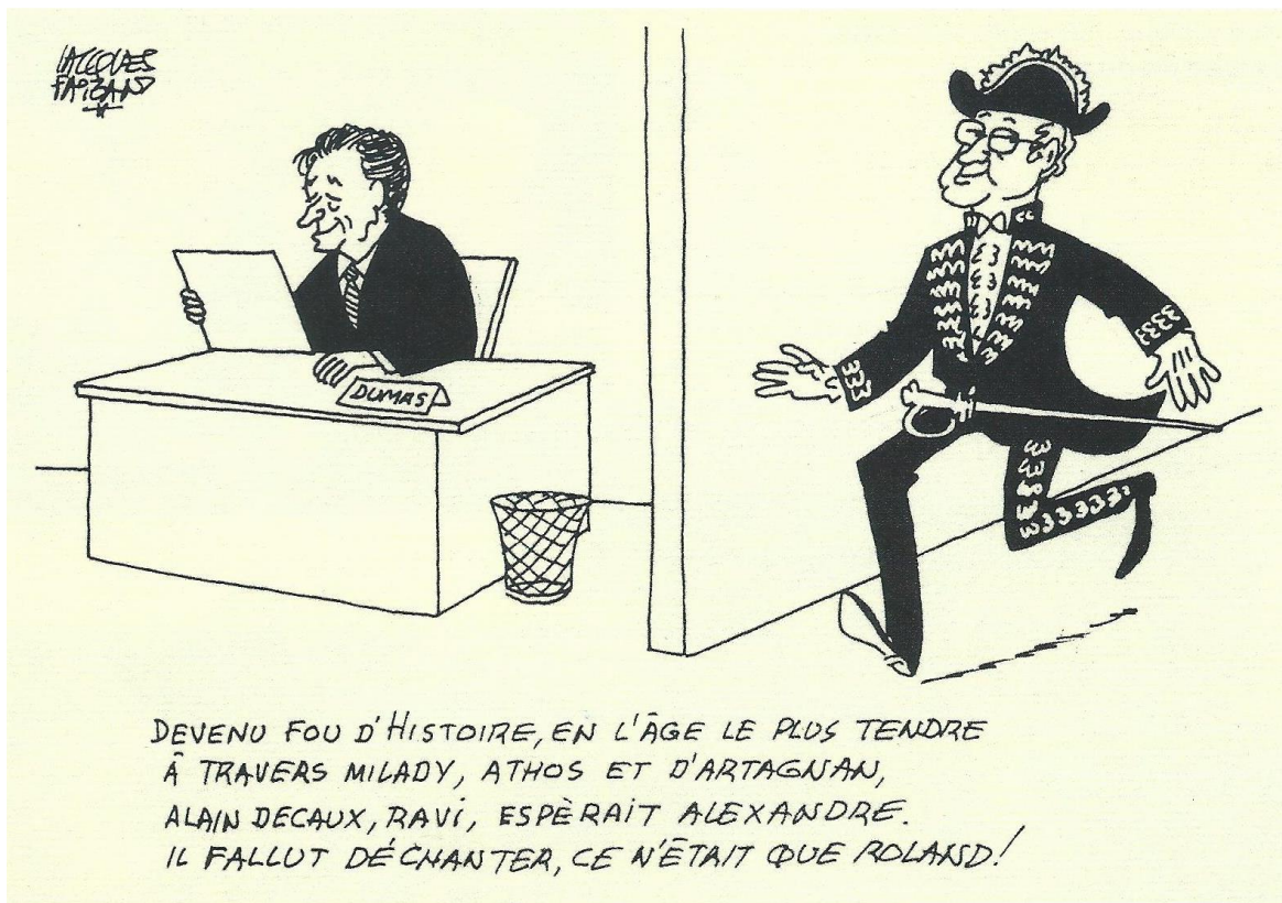
Figure 5 : Dessin de Jacques Faizant paru dans Le Figaro , 30 juin 1988. Source : DECAUX, Alain, Tous les personnages sont vrais. Mémoires , Paris, Perrin, 2005, 549p.