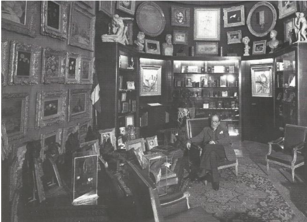
Figure 2 : « Sacha Guitry dans son hôtel particulier, rempli de trésors ». Crédit photo : DR. Source : DECAUX, Alain, Tous les personnages sont vrais. Mémoires , Paris, Perrin, 2005, 549p.

Franck Ferrand, animateur de l'émission Au cœur de l'histoire sur Europe I, déclara au micro de Wendy Bouchard dans Europe 1 matin 54 , le lundi 27 mars 2016 à l'occasion de la disparition d'Alain Decaux : « Alain Decaux était d'une certaine manière l'héritier, non seulement de Sacha Guitry, mais de tous ces grands personnages qui savaient porter haut l'esprit français et parisien »