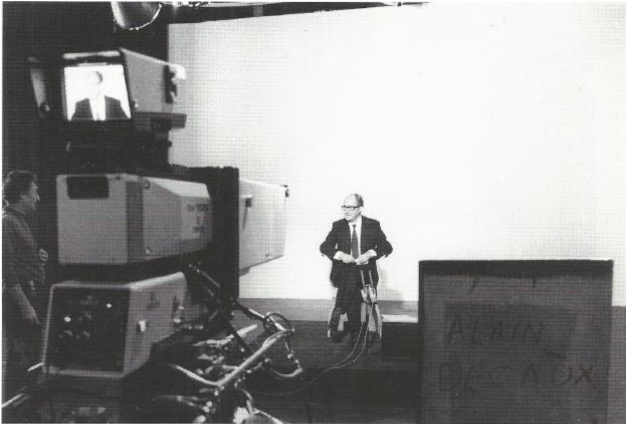
Figure 3 : Tournage en direct de l'émission « Alain Decaux raconte ». « Seul devant un monstre nommé caméra, deux cents fois je vais raconter. » Crédit photo : Lucien Chiasselotti. Source : DECAUX, Alain, Tous les personnages sont vrais. Mémoires , Paris, Perrin, 2005, 549p.