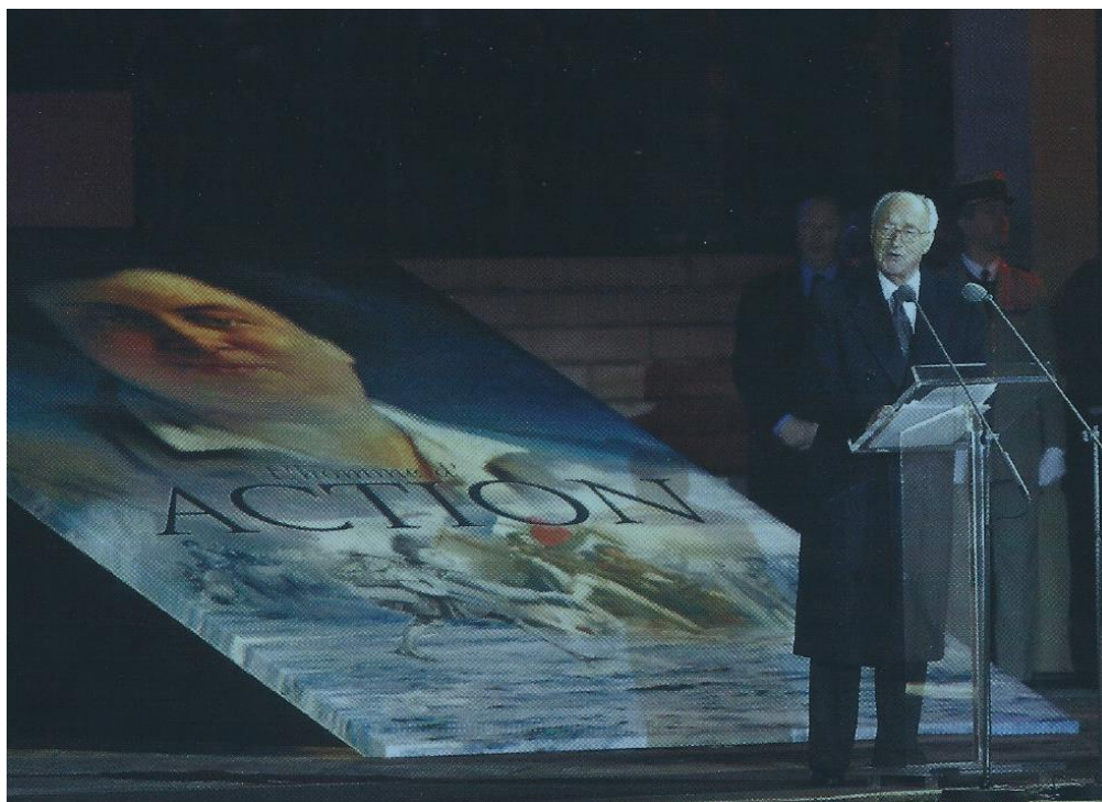
Figure 1 : Alain Decaux accueillant la dépouille d'Alexandre Dumas au Panthéon, 30 novembre 2002. « Enfin te voilà, Alexandre ! » déclara Alain Decaux. Source : DECAUX, Alain, Tous les personnages sont vrais. Mémoires, Paris, Perrin, 2005, 549p.

Les quatre amis étaient aussi de profonds admirateurs de Théodore Gosselin dit G. Lenôtre (1855-1935), maître de la « petite histoire » qui faisait revivre sous sa plume, avec un luxe de détails évocateurs, aussi bien les grands personnages de la Révolution que les inconnus qui peuplaient le Paris d'autrefois. Grâce à son style narratif et ses anecdotes, il intéressa à l'histoire un large public, à qui il donnait l'impression de revivre les événements. Parmi ses nombreux ouvrages l'on peut citer : Paris révolutionnaire (1803), La guillotine et les exécuteurs des arrêts criminels pendant la Révolution (1897), Le drame de Varennes (1905), Le roi Louis XVII et l'énigme du Temple (1920). Pour écrire sa célèbre série Vieilles maisons, vieux papiers, chroniques du temps (1900-1929), il n'hésitait pas à visiter et à fouiller les lieux pour en retrouver l'ambiance. Les producteurs de La Tribune s'inspirèrent de son talent de conteur et de son étonnant sens du détail, comme par exemple vérifier le temps qu'il faisait le jour où Marie-Antoinette fut guillotinée. « C'est