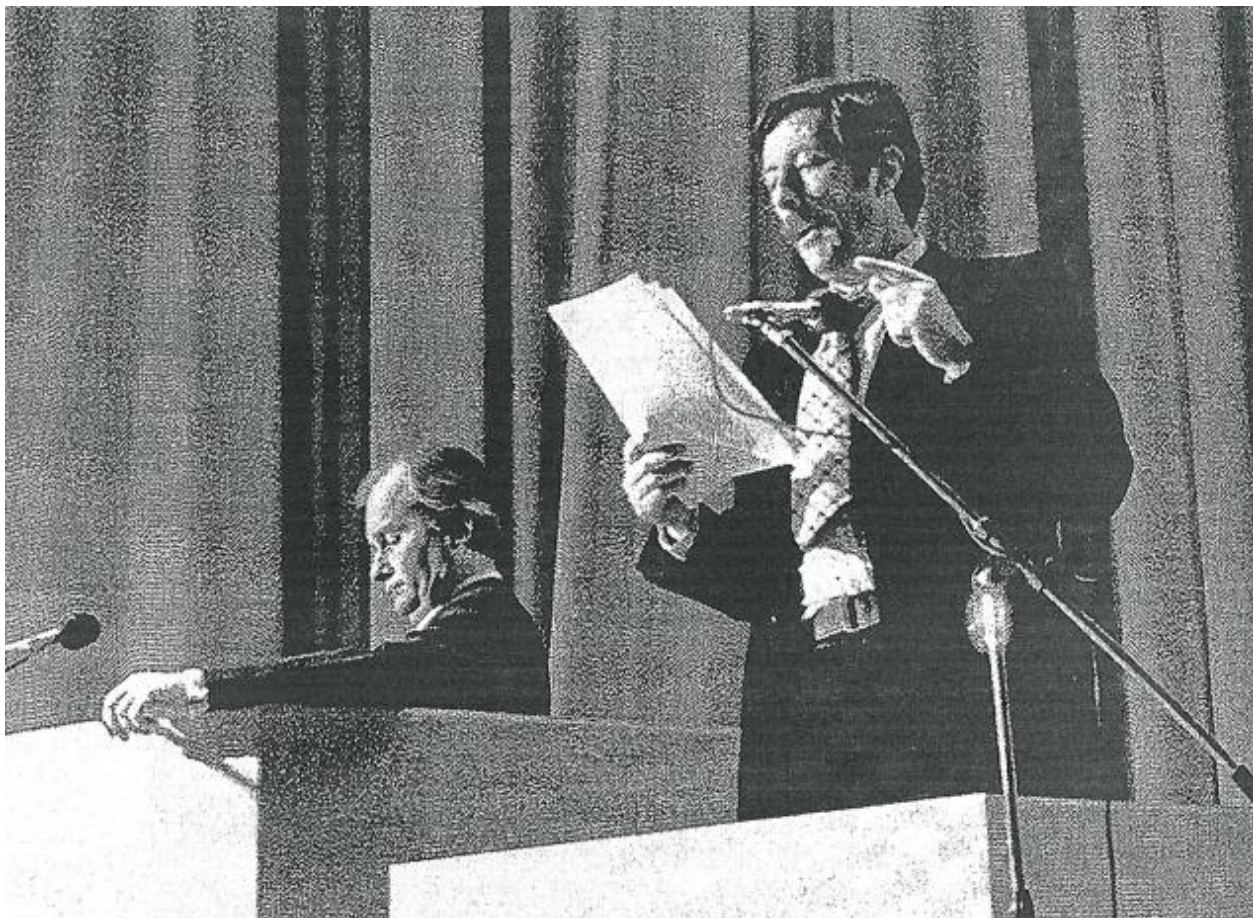
Figure 6 : Michel Bouquet et Jean Rochefort au cours de l'enregistrement public du « Procès de Napoléon III » au Palais des Congrès, 1974.