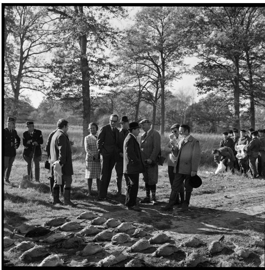
Photographie 5 : Jacques Chirac et Pierre Juillet lors d'une chasse à Rambouillet le 4 novembre 1971.