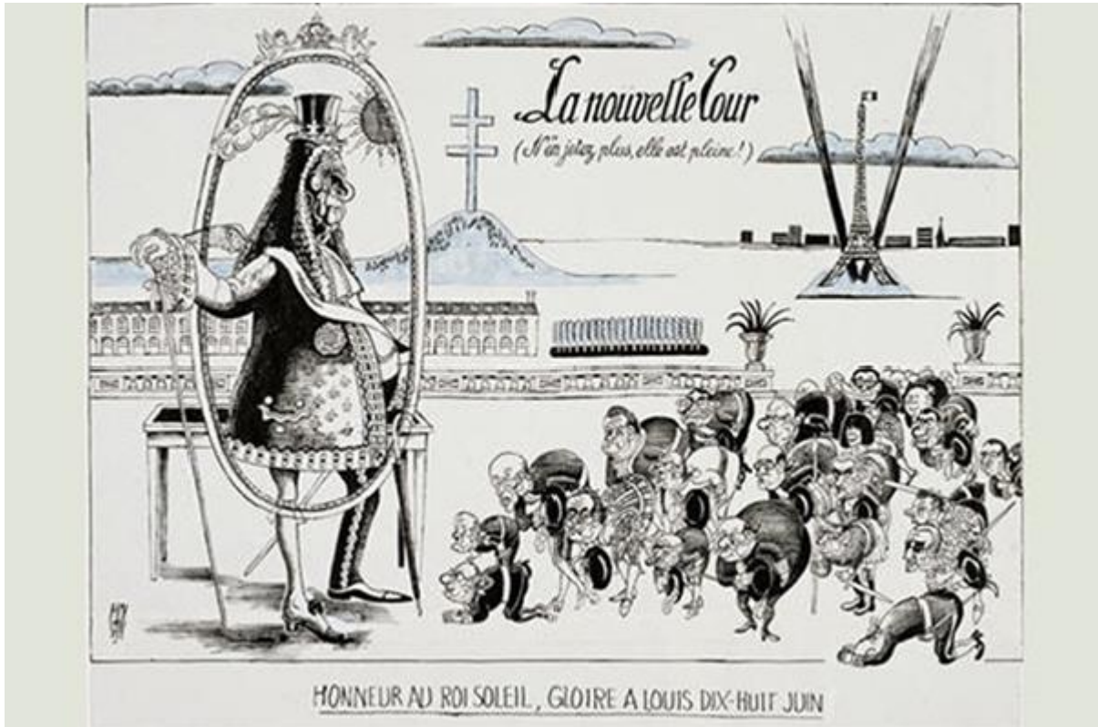
Illustration n°1.b : de Gaulle en Louis XIV