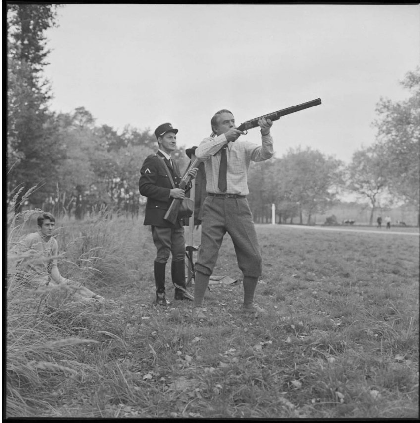
Photographie 8 : Chasse officielle à Rambouillet. Sargent Shriver, ambassadeur des États-Unis en France en train de tirer, le 18 octobre 1969.