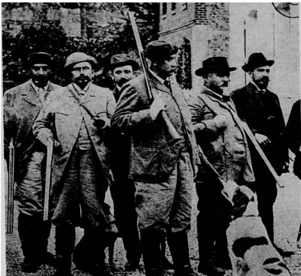
Photographie 1 : Le Président Félix Faure (au centre) avec, à sa droite, Gabriel Hanotaux.