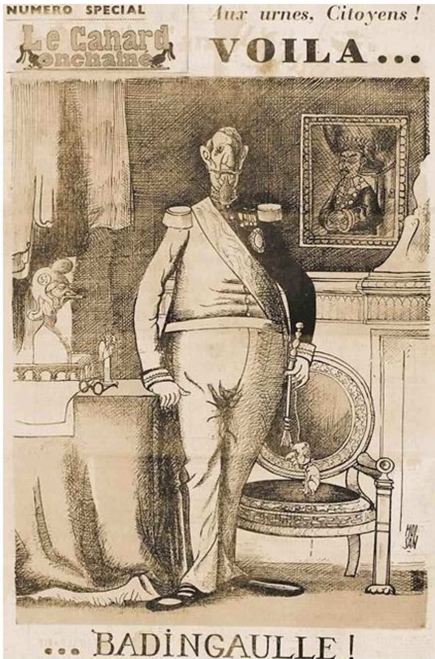
Illustration n°2 : de Gaulle caricaturé en Napoléon III.