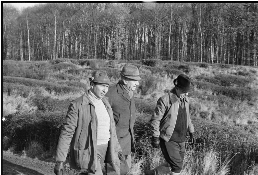
Photographie 7b : Serge Dassault (à gauche) marchant lors d'une chasse à Marly-le-Roi, le 15 décembre 1973.