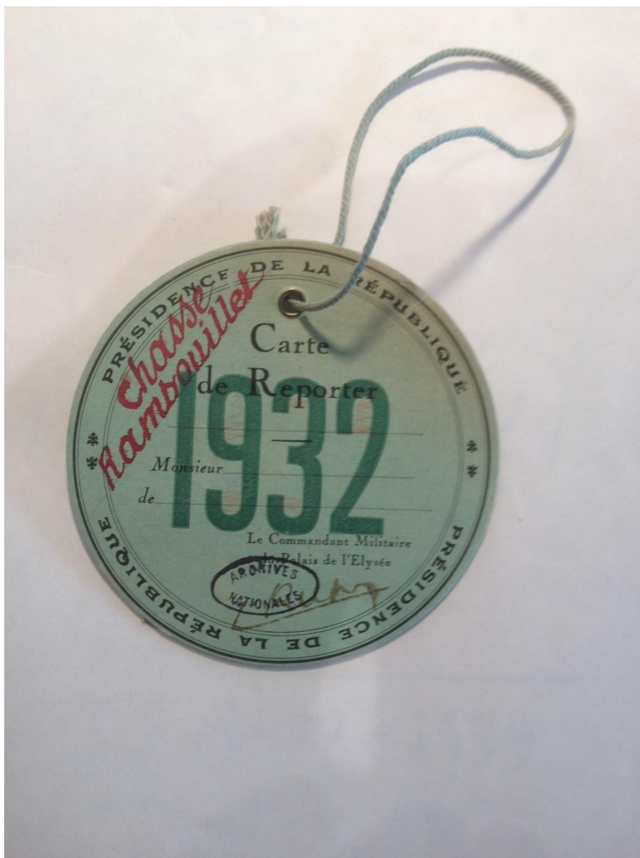
Illustration n°4 : accréditation presse pour une chasse lors de la saison 1932