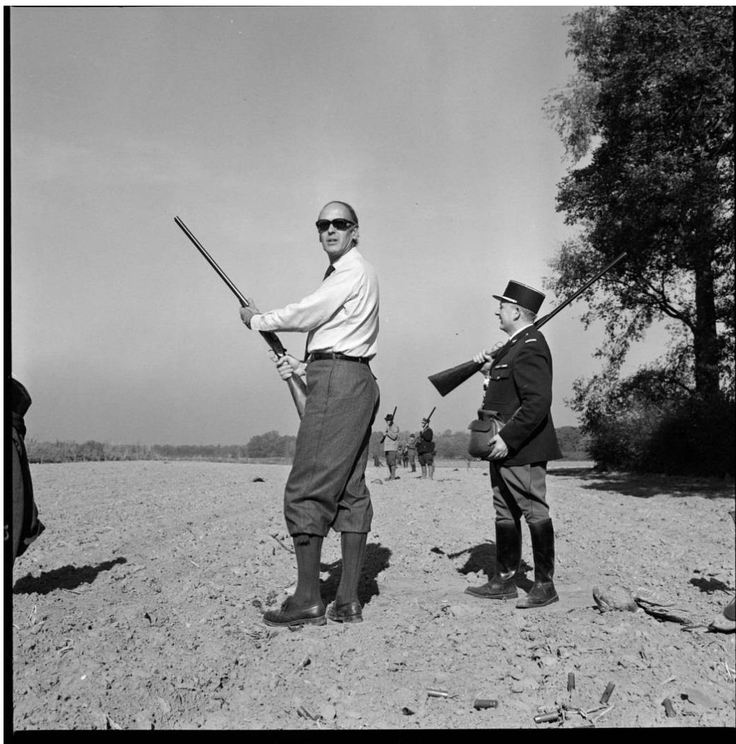
Photographie 4 : Valéry Giscard d'Estaing chassant à Marly-le-Roi le 23 octobre 1971.