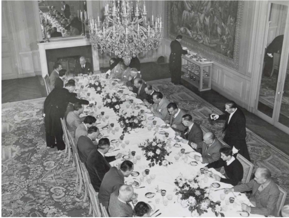
Photographie 3 : Déjeuner après la chasse du 5 octobre 1952 à Marly-le-Roi.