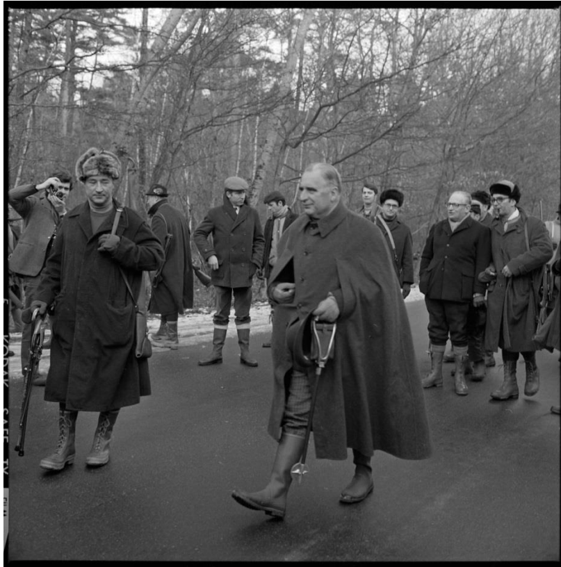
Photographie 7a : Georges Pompidou marchant lors d'une chasse officielle à Chambord le 9 janvier 1971.