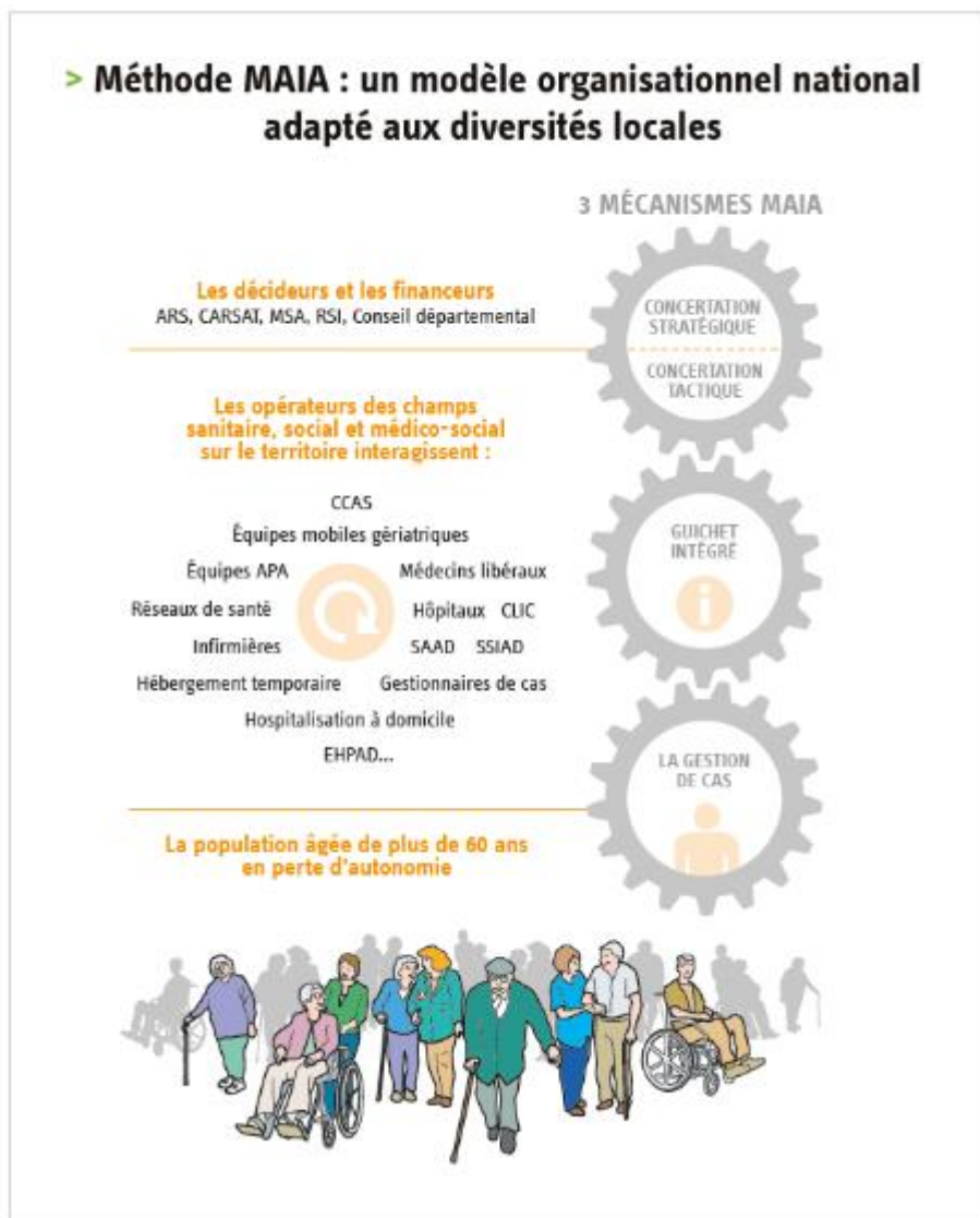
Figure 3 : Méthode MAIA.

permet d'apporter une réponse décloisonnée, harmonisée, complète et adaptée aux besoins de la personne âgée (accueil, information, orientation et mise en place de soins, d'aides ou de prestations), quelle que soit la structure à laquelle elle s'adresse. » (34)