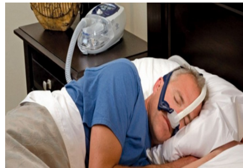
Photographies n°1 et 2 : la ventilation en pression positive continue et son appareillage.