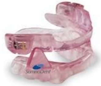
Schéma n° 2 : illustration du mécanisme de l'orthèse d'avancée mandibulaire et une photographie.