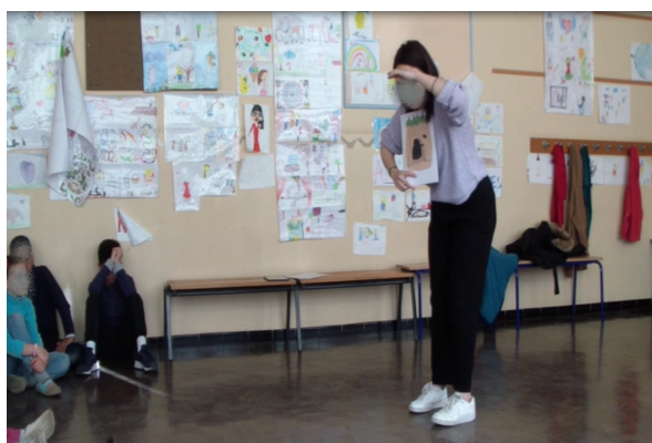
Capture 6 : Big dark cave