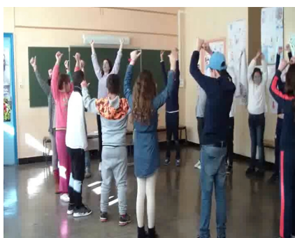
Capture 1 : Thumbs