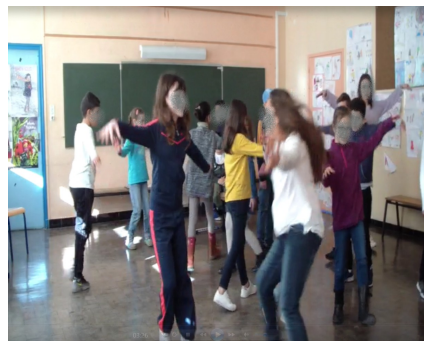
Capture 2 : Fly like a bird