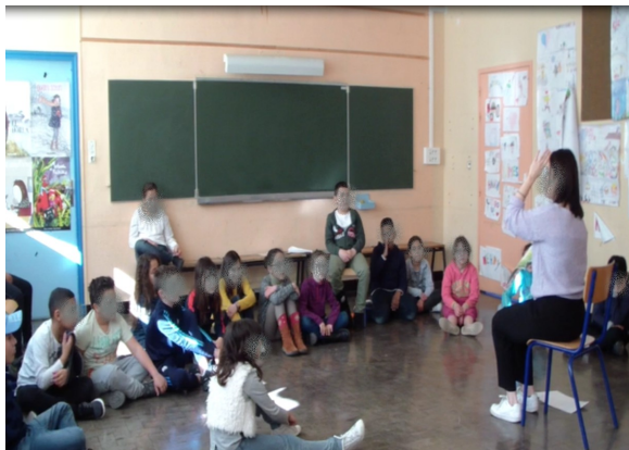
Capture 4 : We must go through it