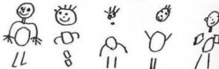
Dessins enfants seuls devant TV / traumatismes familiaux © Peter Winterstein : Macht Fernseh dumm?

Enfin voici les dessins d'enfants qu'on a laissés seuls regarder la TV et qui en ont subi des traumatismes importants