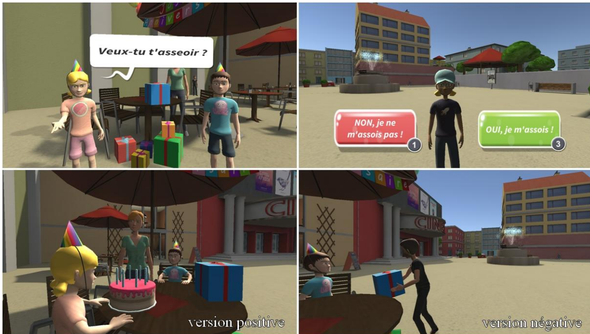
Annexe A : Scénario de l'anniversaire dans la phase « entraînement » de JEMImE : versions positive et négative du scénario