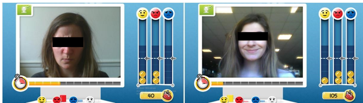
Image 1 : Production de la colère et de la joie lors de la phase « apprentissage » de JEMImE

d'un travail préliminaire (Grossard et al., 2017a). L'enfant peut également profiter d'un retour visuel en temps réel de sa production (principe d'un miroir à l'écran) représentée par un système de jauges indiquant la qualité de l'expression faciale produite (image 1).