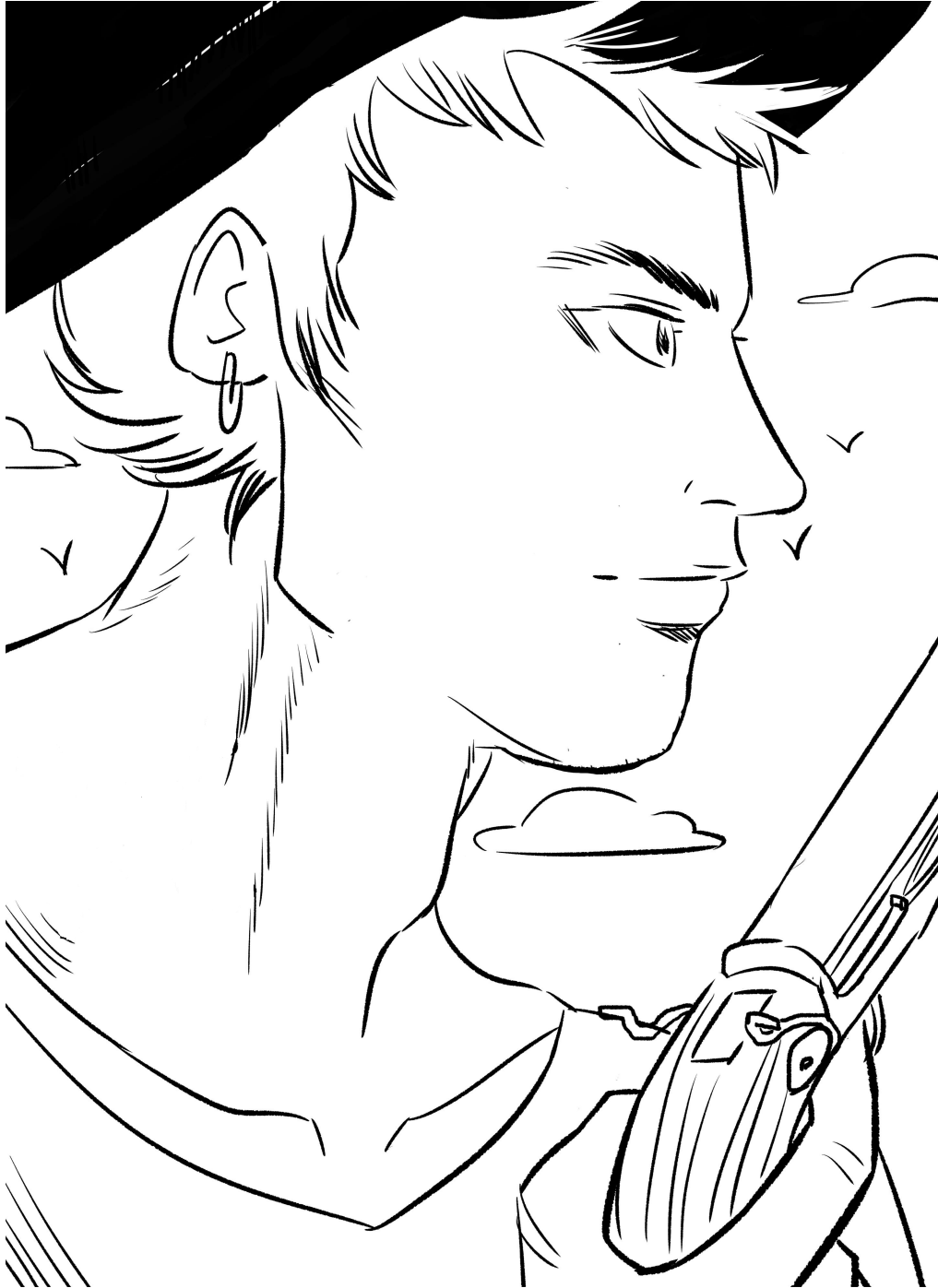
(dessin de Cleveland par Morgan Pelé)