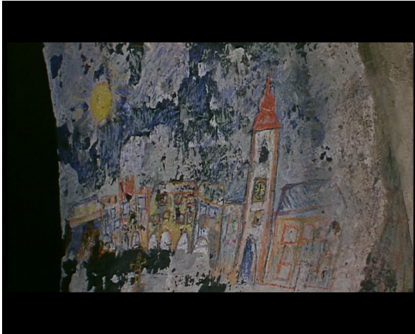
Photogramme 11 [00:02:05]