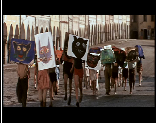
Photogramme 12 [01:38:40]

A propos de la démarche du cinéaste, nous pourrions poursuivre avec Baudelaire :