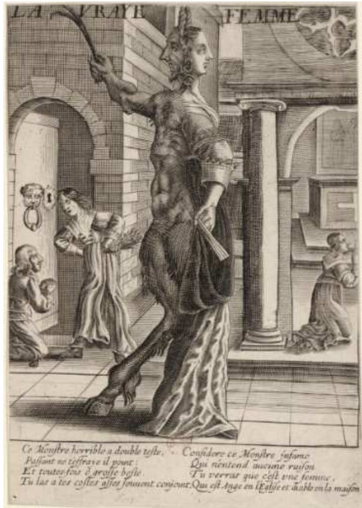
Gravure anonyme, La vraie femme , XVIIe siècle, Paris, Bibliothèque nationale.