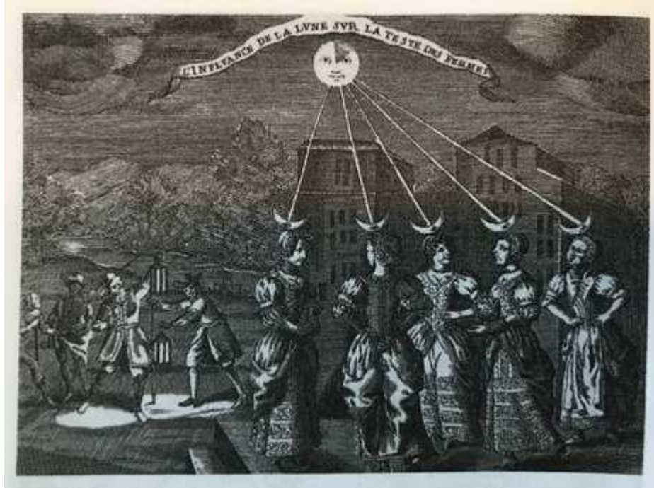
Gravure anonyme, L'influence de la Lune sur la tête des femmes , XVIIe siècle, Paris, Bibliothèque Nationale de France.