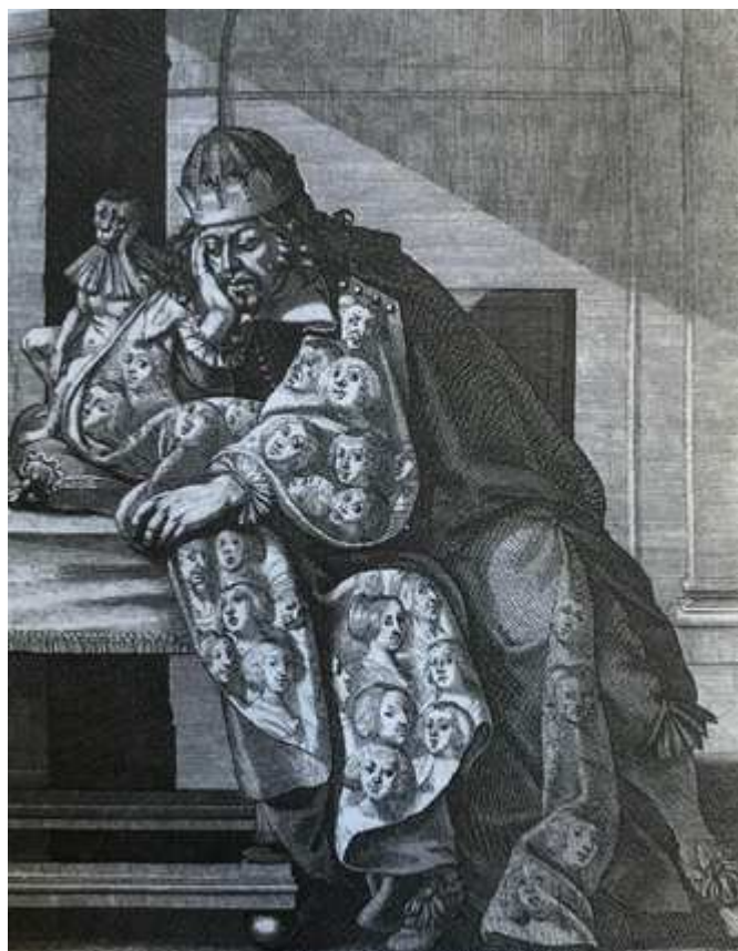
Abraham BOSSE, L'homme fourré de malice , gravure, école française, XVIIe siècle.