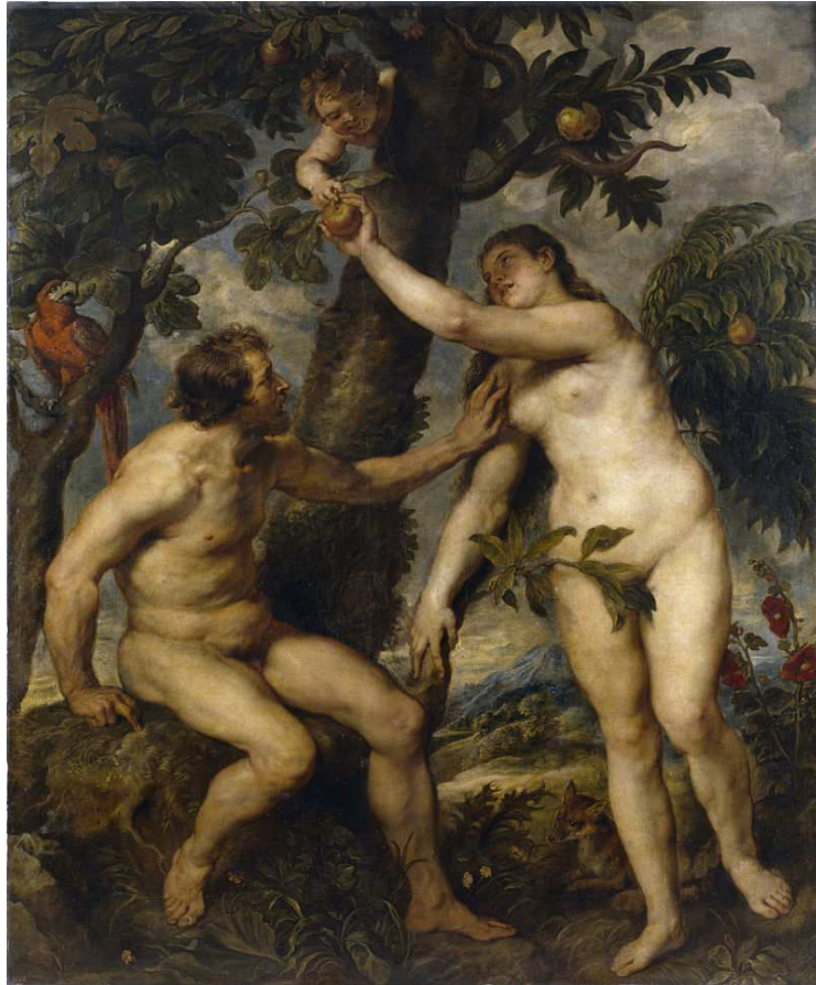
Pierre Paul RUBENS, Adam et Eve ou la Chute de l'Homme , Huile sur toile, 238 x 184,5 cm, 1629, conservé au Musée du Prado, Madrid