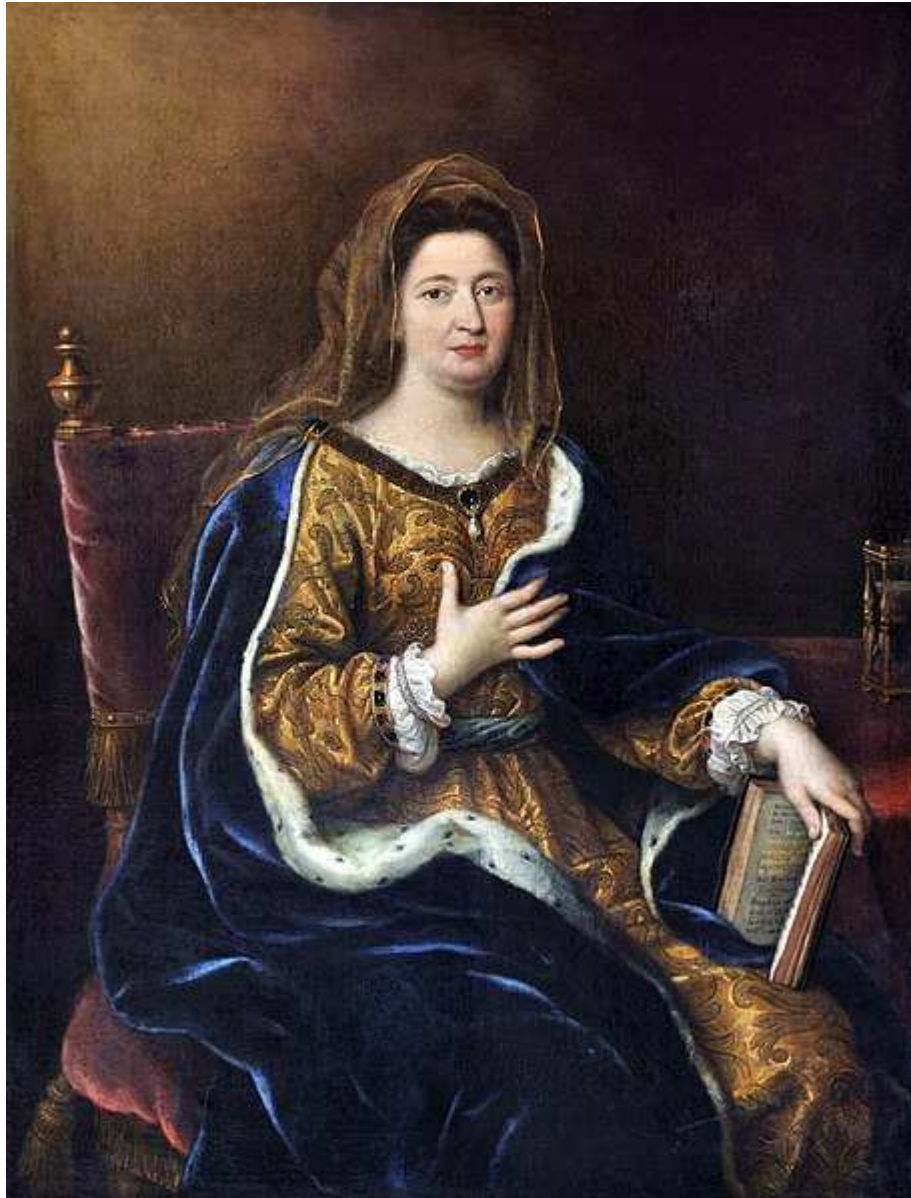
Pierre MIGNARD, Portrait de Françoise d'Aubigné, marquise de Maintenon, représentée en sainte Françoise Romaine , Huile sur toile, 128 x 97 cm, 1694. Exposée au Palais de Versailles.