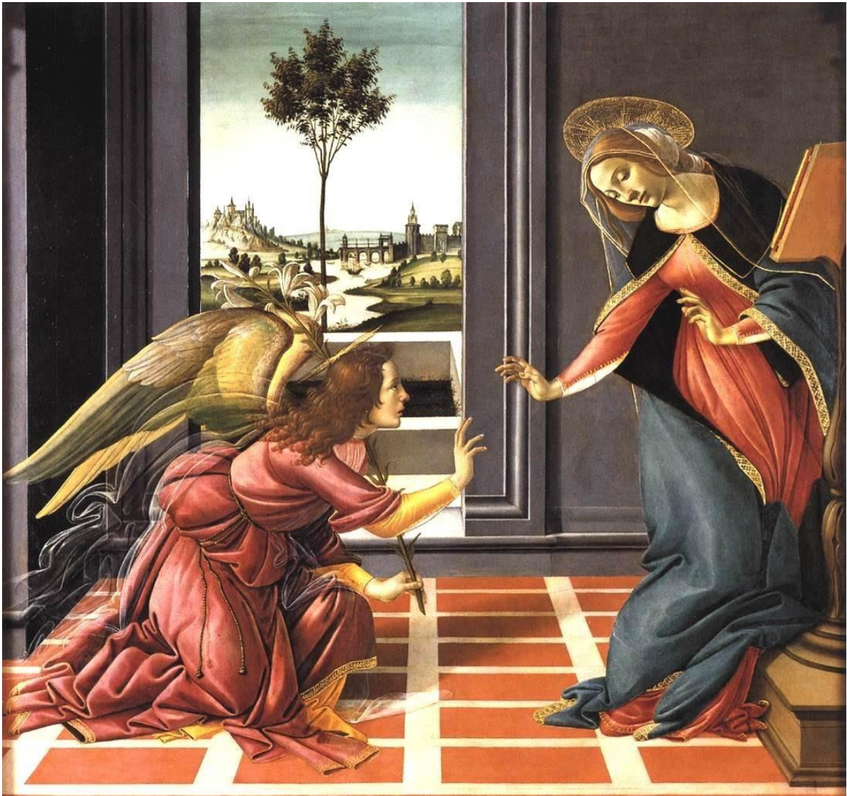
Botticelli, L'annonciation du Cestello (1489-1490)