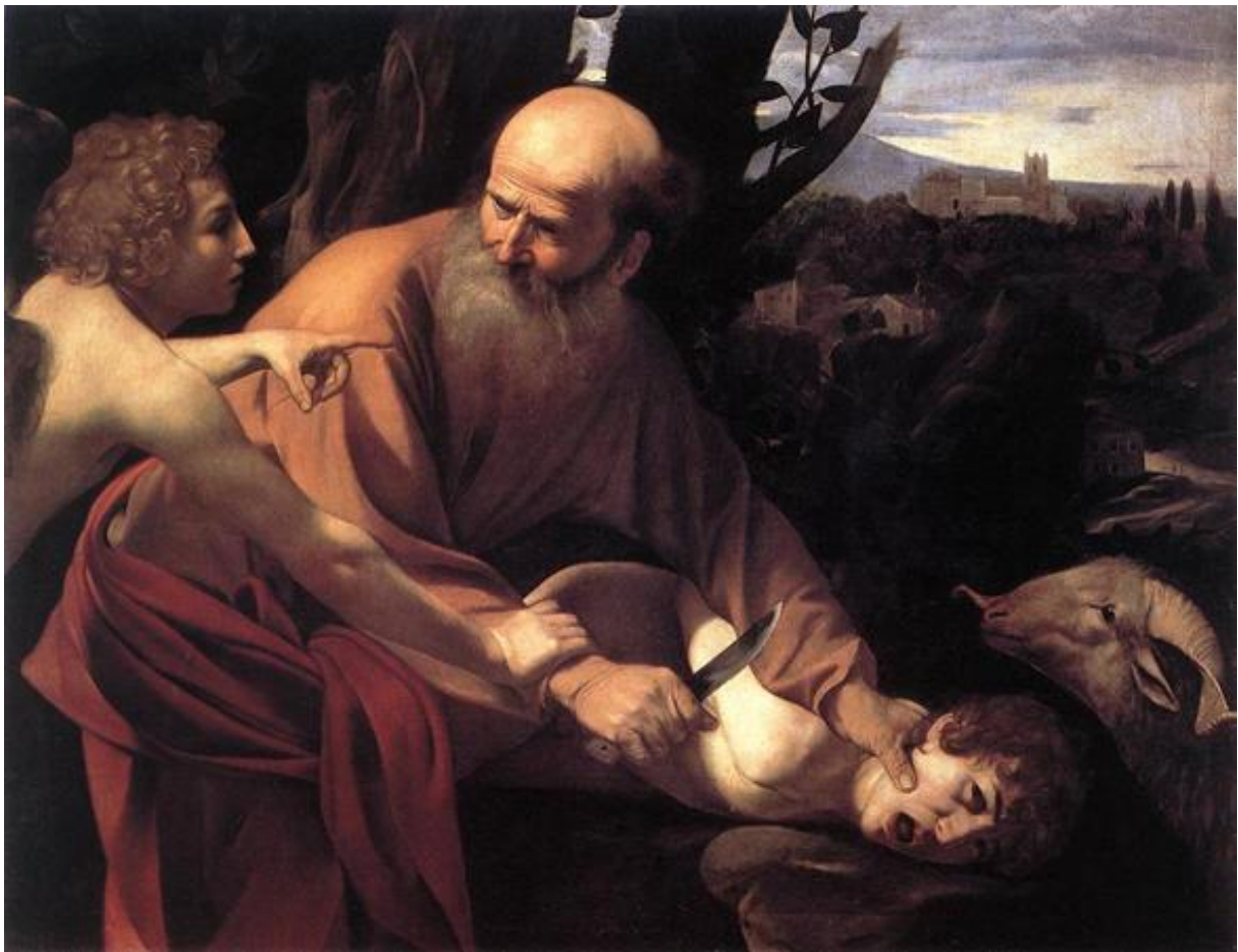
Le Caravage, Le sacrifice d'Isaac (1598-1603)