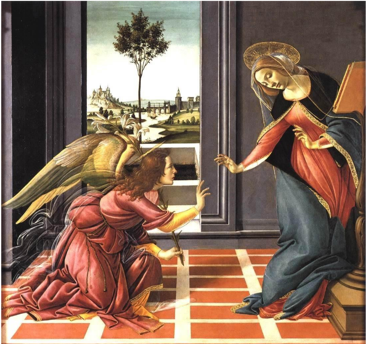
Botticelli, L'annonciation du Cestello (1489-1490)