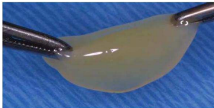
Figure 3 : Résultat de l'activation du PRP par le chlorure de calcium, aboutissant à un gel prêt à l'emploi (34)

Il a également été démontré que le PRGF favorisait la prolifération, la migration ainsi que le chimiotactisme sur les ostéoblastes humains (Anitua et al. 2013) (45).