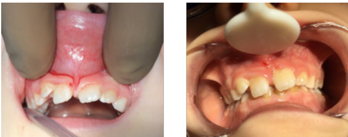
FIGURE 1. PHOTO PRE-OPERATOIRE ET POST OPERATOIRE D'UNE FRENECTOMIE LABIALE SUPERIEURE.

Contrôle à 1 semaine avec dépose des sutures.(17)