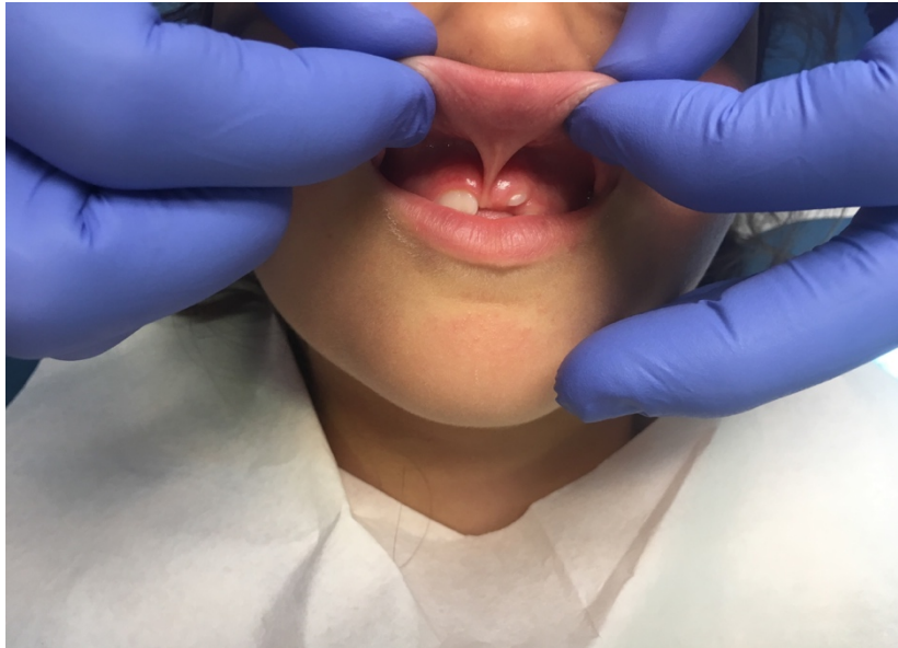
FIGURE 2 : PHOTO PRE-OPERATOIRE D'UNE FREINECTOMIE LABIALE SUPERIEURE REALISEE AU LASER DIODE.