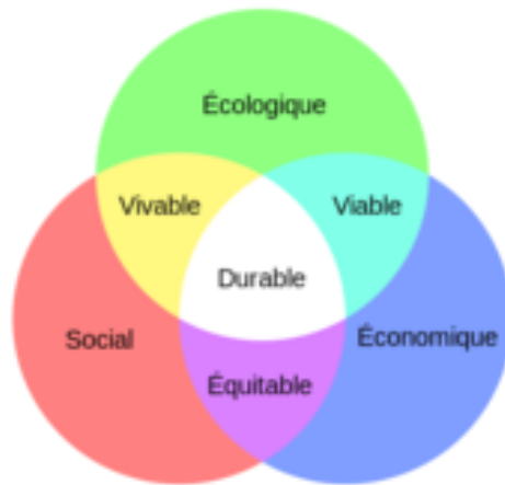
Image 1 : Les trois piliers du développement durable 5

En 1992, la notion de développement durable et de ses trois piliers est officialisée lors de la Conférence de Rio (Sommet de la Terre) qui réunit 120 chefs d'Etat et de gouvernement. A cette conférence est instauré l'Agenda 21, stratégie globale du développement durable à l'échelle internationale, nationale et locale 6 . Ce sommet met en place par ailleurs un cadre annuel de réunions internationales au travers de la Convention cadre des Nations unies sur le changement climatique.