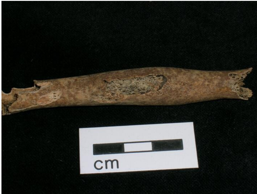
Figure 3 : Tuméfaction osseuse et porosité de la corticale du radius gauche du spécimen FAO90_1296 (3)

Par ailleurs, lors d'une mission au Musée de Londres, le Dr Elsa Garot a eu accès aux collections archéologiques et plus particulièrement aux arcades dentaires des squelettes sur lesquelles elle a pu constater des anomalies dentaires. S'agissant de notre spécimen, la moitié gauche de l'arcade mandibulaire n'a pas été retrouvée. La formule dentaire de notre individu, établie à partir des nouvelles photographies (Figures 4 à 8), est rapportée dans le tableau 2.