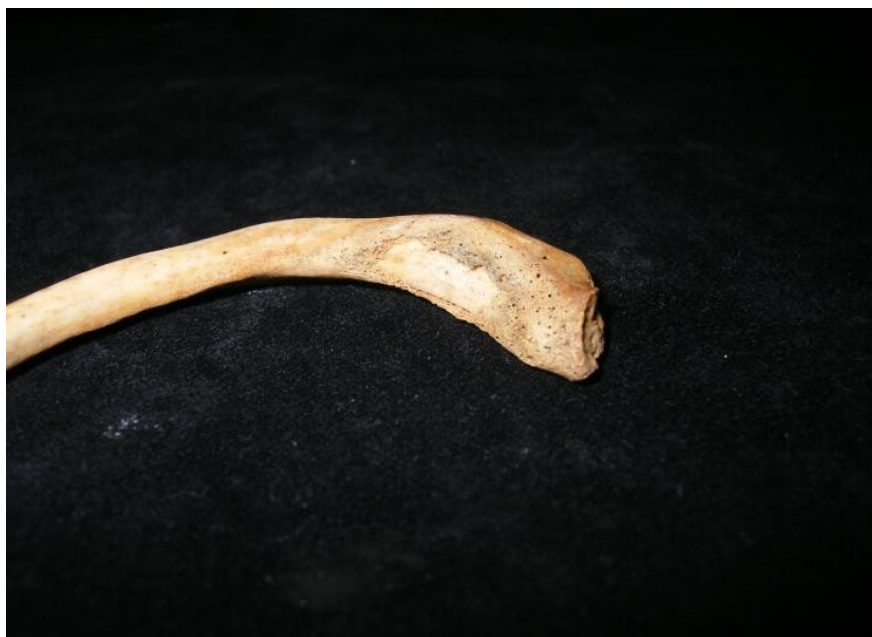
Figure 1 : Lésion osseuse festonnée et porosité de la corticale d'une côte du spécimen FAO90_1296 (3)

L'examen du squelette ne montre pas d'autre lésion osseuse. A l'issue de ces observations les anthropologues évoquent la possibilité d'une atteinte infectieuse par la tuberculose ou la brucellose.