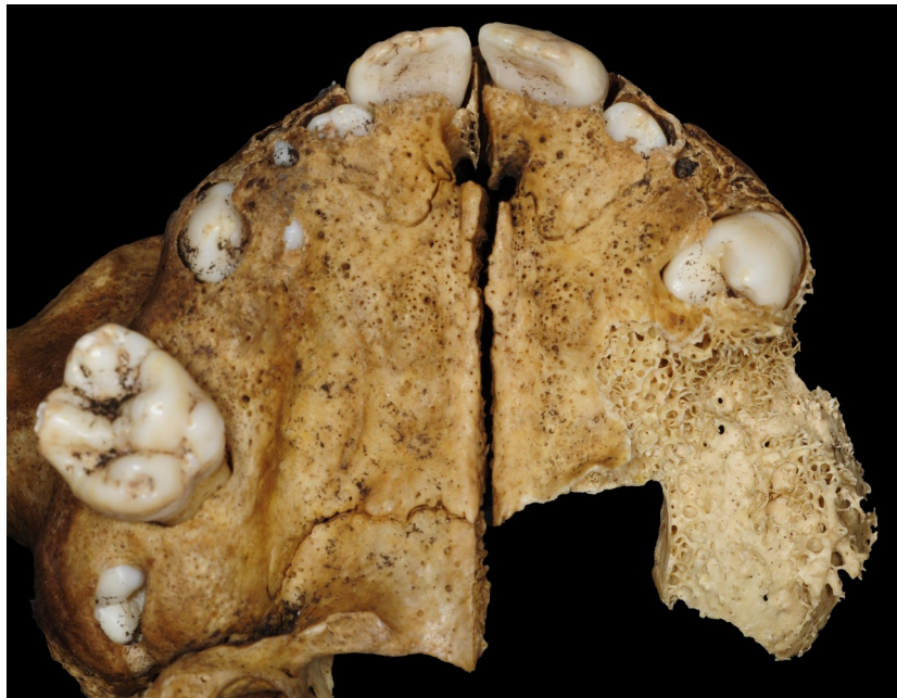
Figure 4 : Arcade maxillaire du spécimen FAO90_1296

On observe une hauteur de l'os mandibulaire faible, marquée par un foramen mentonnier positionné à mi-hauteur de la branche horizontale (Figure 5). La lyse osseuse avec dénudation des racines des premières molaires nous oriente vers une exfoliation des dents liée à un problème parodontal plutôt qu'une oligodontie (absence congénitale de six dents ou plus à l'exception des troisièmes molaires) ou des inclusions multiples. A cela s'ajoute le fait que la chute précoce des dents déciduales peut accélérer le développement et l'éruption des dents sous-jacentes (12) qui expliquerait ici les nombreuses dents permanentes ayant perforées la corticale osseuse.