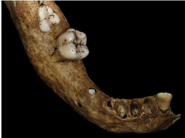
Figure 5 : Arcade mandibulaire du spécimen FAO90_1296