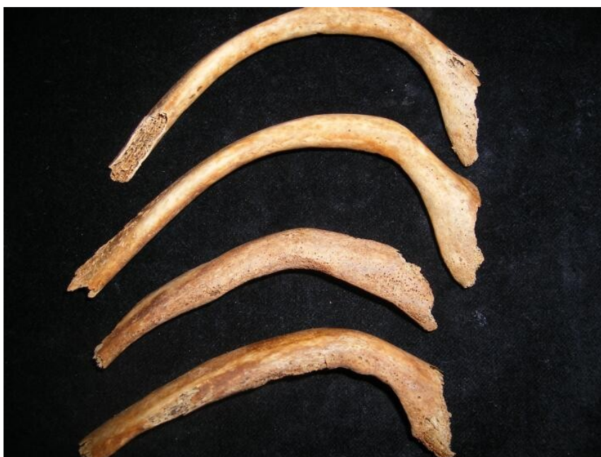
Figure 2 : Tuméfactions et porosités osseuses des côtes du spécimen FAO90_1296 (3)