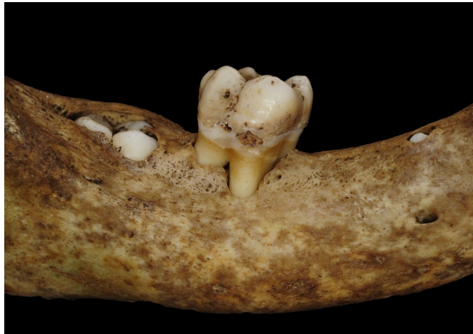
Figure 6 : Lyse osseuse visible autour de la molaire et par la position haute du foramen mentonnier sur la mandibule du spécimen FAO90_1296