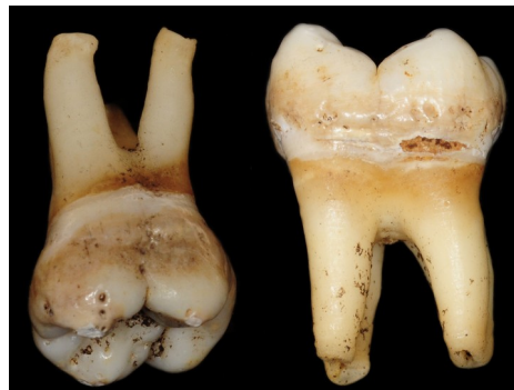
Figure 8 : Molaire présentant des racines effilées du spécimen FAO90_1296