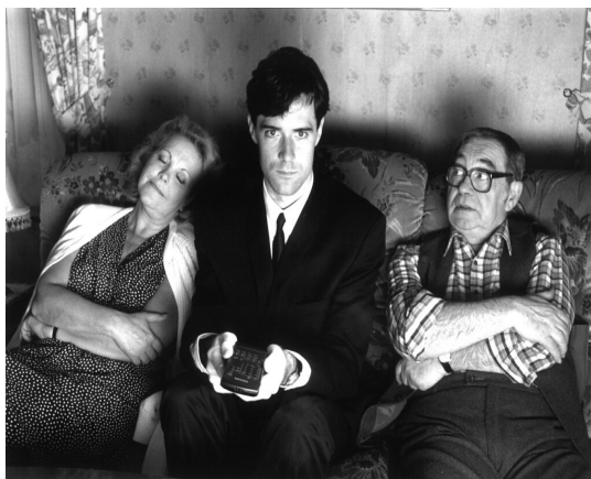
Photogramme 1 (issu du film Monsieur de Jean-Philippe Toussaint, 1990) : Monsieur, dans le salon, avec ses beaux-parents.