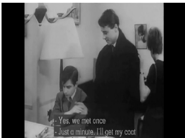
Photogramme 3 (issu du film Antoine et Colette de François Truffaut, 1962), https://www.youtube.com/watch?v=U5hDHLKYYyY : Antoine et Colette dînent avec les parents de celle-ci lorsque quelqu'un sonne à la porte : il s'agit d'Albert, le nouvel amant de Colette qui passe la prendre pour sortir. Albert se place entre Colette et Antoine. Il établit véritablement une séparation entre les deux protagonistes.