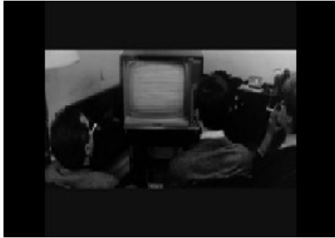
Photogramme 4 (issu du film Antoine et Colette de François Truffaut, 1962), extrait de film disponible sur https://www.youtube.com/watch?v=Tk_x9_WapXk&list=PLDdvfT1AVdb5vhXZgXTY70O7x5fLdnU00&index=3 : Antoine Doinel, entre ses beaux-parents, regardant la télévision dans le salon.