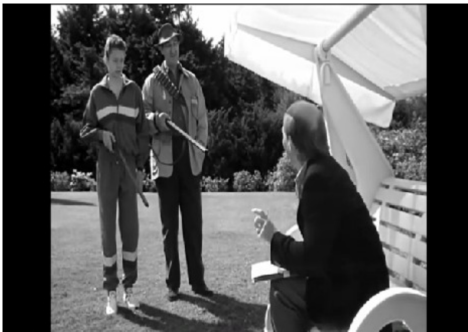
Photogramme 9 (issu du film Monsieur ) : Le mari et le fils Romanov proposent à Kaltz de faire un ball-trap avec eux tout en pointant le fusil sur lui. Connaissant la situation entre Kaltz et Madame Pons-Romanov, cette situation ne peut que faire rire le spectateur. Kaltz est pris au piège.