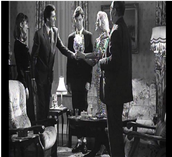
Photogramme 2 (issu du film Monsieur de Jean-Philippe Toussaint, 1990) : La famille de Laurence reçoit Jean-Marc, son nouvel amant. Bien évidemment, Monsieur est de la partie. Sa présence est inadaptée : le plan est très parlant. Monsieur est au centre du plan, placé entre les Parain et le jeune couple. Il ne reste qu'un observateur de la scène, ne sachant pas où est sa place.