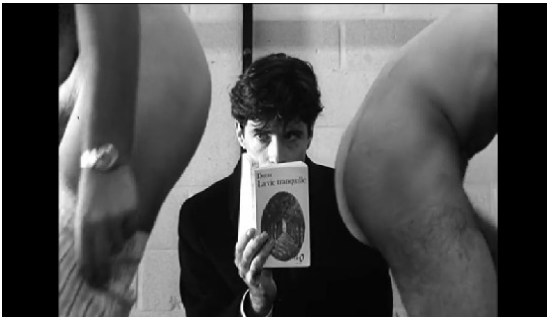
Photogramme 6 (issu du film Monsieur ) : Monsieur est dans les vestiaires. Il lit le livre de Marguerite Duras, La vie tranquille , lorsque nous voyons entrer dans le champ deux paires de fesses nues. Monsieur est au centre du plan et semble complètement bloqué. En effet, les deux hommes envahissent le champ et Monsieur est écrasé. Il ne dit rien et se contente de regarder l'intrusion avec embarras. De plus, le plan est serré ce qui intensifie cette idée d'étouffement.