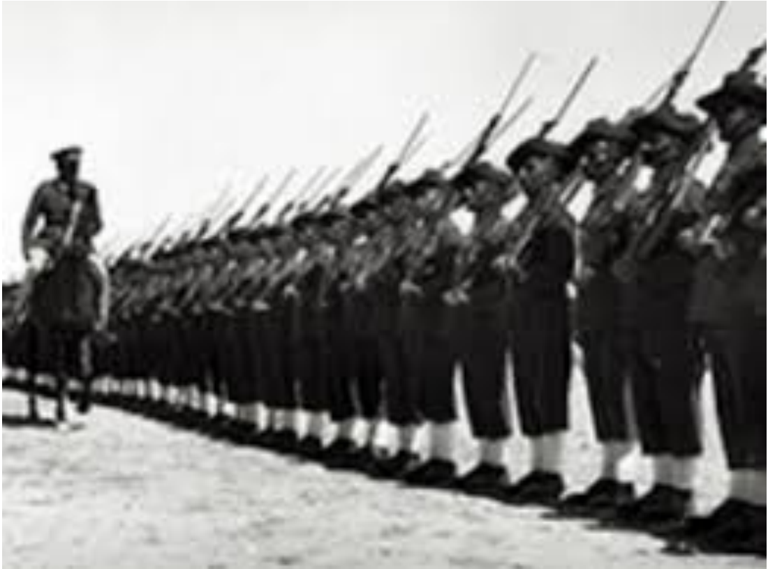
Q. Photographie de l'armée irakienne, source : Wikipédia, 1926.