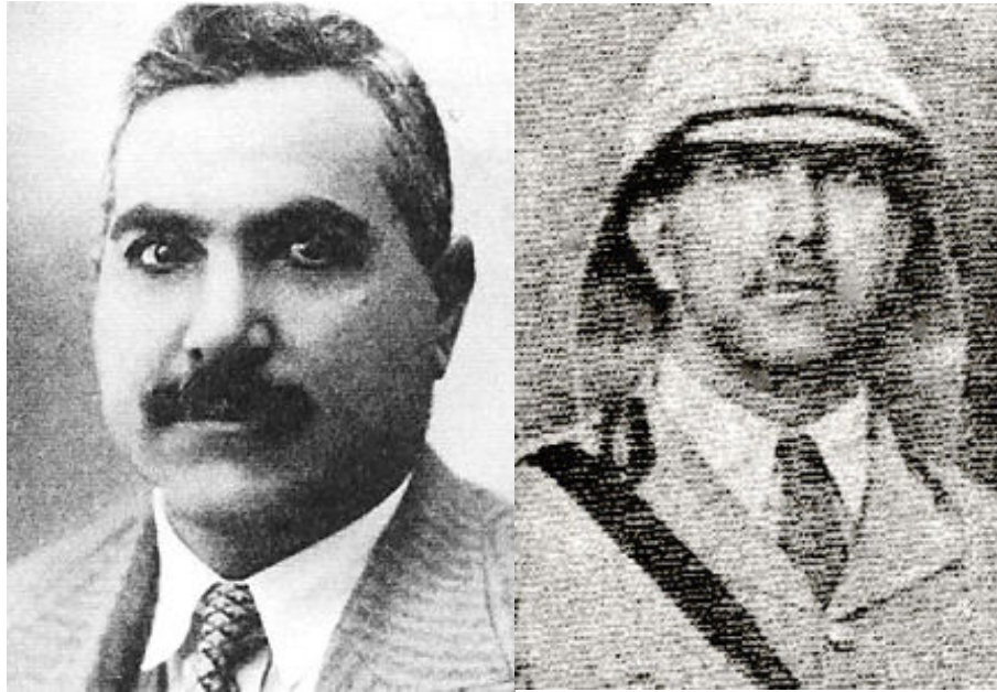
K. Photographie de Yasin al Hashimi à gauche, et L. photographie de son frère, Taha al Hashimi, à droite, Source Wikipédia, photographies non datées, auteurs anonymes.