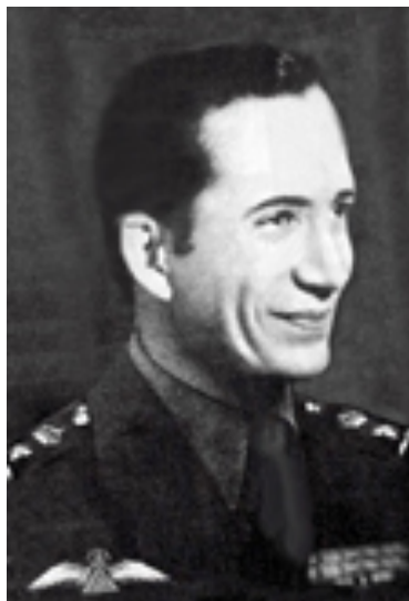
G. Photographie numérisée de Ghazi Ier, archives nationales anglaises de Kew, 1936.

L'armée pour sa part voyait la mort de Faysal comme une opportunité de s'imposer dans le débat national. Mohammed Tarbush écrit à ce propos que : "After King Faisal's death, however, the army's role took a new turn. The fact that the Levies were finally disbanded or assimilated into the Iraqi army in 1932, coupled with Faisal's death in 1933, resulted in a power vacuum in the country which, as will be seen later, Iraqi officers were eager to fill." 51 . Finalement, après la mort de Faysal 52 , une instabilité politique croissante s'installe, attisée par l'arrivée du fils de Faysal, le jeune et inexpérimenté Ghazi Ier.