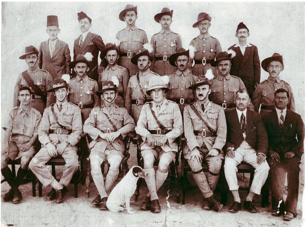
D. Photographie de combattants Assyro-chaldéens des Iraqi Levies en uniformes, 1938.

Pour leur part, les Levies survécurent tant bien que mal à la fin du mandat britannique en 1932, grâce à leur rôle stratégique de gardien des bases aériennes de la Royal Air Force (RAF), et jouèrent un rôle important en 1941 pendant la guerre anglo-irakienne du côté des Britanniques. Le bataillon assyrien resta relativement actif jusqu'à sa dissolution finale en mai 1955 lorsque le contrôle de la RAF de Habbaniya et de Shaibah, fut définitivement remis à l'Irak.