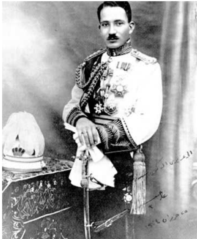
H. Photographie officielle du couronnement de Ghazi Ier en 1933 à Bagdad.

Enfin, Bakr Sidqi joue un rôle décisif dans l'évolution de l'armée en 1933. De même, l'armée joue un rôle fondamental pour lui. Les parcours de Sidqi, et de l'armée, sont incontestablement imbriqués. Mais surtout, Bakr Sidqi incarne la transition militaire du pays, et le changement de leadership politique. La politique intérieure du pays se concentre à partir de 1933 sur la question de la professionnalisation de l'armée, et de l'anti-impérialisme, et les partis nationalistes prennent à partir de 1933 de plus en plus de place et de légitimité au parlement. Même si Ghazi Ier nomme des ministres fidèles à son père 61 dans le premier gouvernement qu'il forme, comme Nuri al Saïd, pour marquer la continuité entre le règne de son père et le sien, cela ne dure point. Ghazi se tourne progressivement vers les courants pans arabistes qui prennent de plus en plus d'ampleur dans le pays à partir des années 1930.