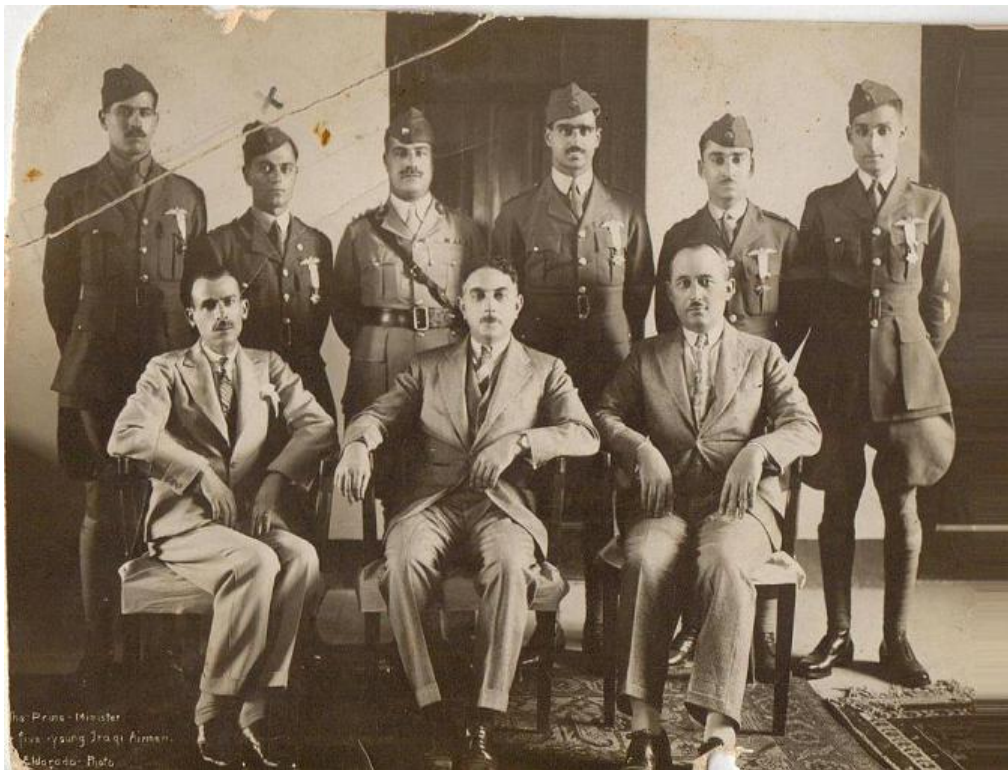
R. Photographie du nouveau gouvernement réformiste de 1937, Hikmat Suleyman au centre.

Finalement, à la fin de ce jeudi 29 octobre 1936, le coup d'Etat avait fonctionné 222 , et Hikmat Suleyman fut nommé Premier ministre par le roi Ghazi. Il forma alors un nouveau gouvernement dès le 31 Octobre, composé principalement des membres du groupe Al Ahali 223 .