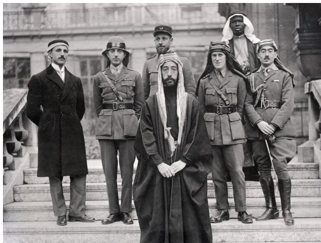
F. Photographie de la Délégation anglo-iraquienne du roi Faysal (au centre) à Versailles en 1919, Photo des archives numérisées de la Courneuve.

Pour le roi Faysal, et les dirigeants des années 1930, la consolidation de l'armée devient une priorité politique, afin de rivaliser avec la présence militaire aérienne de la Grande Bretagne sur le sol irakien (autorisée par le traité anglo-irakien de 1930). Et c'est justement à travers cette question de conscription nationale que les politiciens de l'époque comptaient renforcer l'armée. Ce mouvement fut porté par la monarchie, les courants nationalistes, et pans arabistes (comme le parti al Ikha créé en 1930 49 ), et par l'armée elle-même. Mais le plus fervent défenseur de l'armée était tout d'abord, le roi.