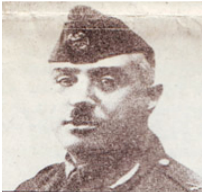
Photographie de Bakr Sidqi, années 1930, source Al Zawraaper.