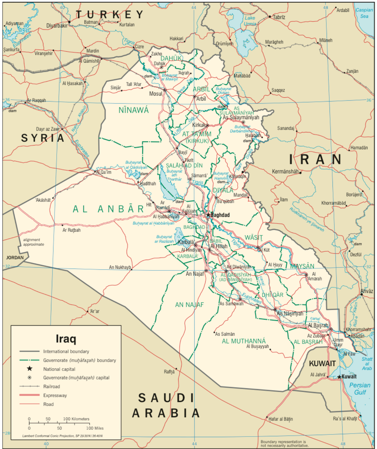
P. Carte de l'Irak et des limites de ses gouvernorats, Source : Wikipédia, 2007.