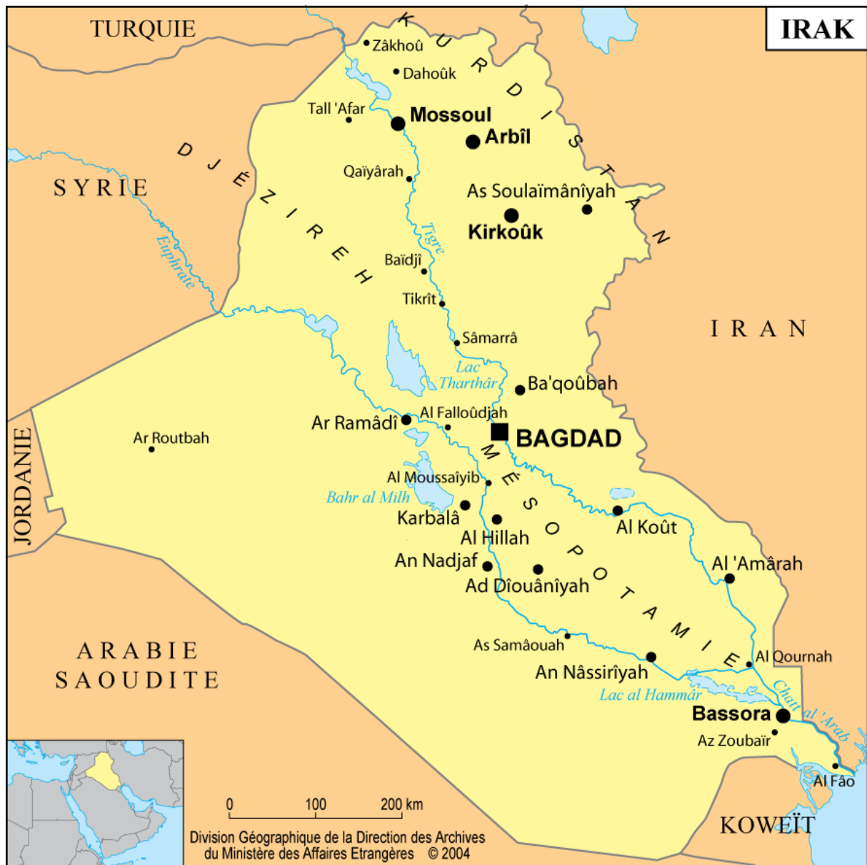
A. Carte de l'Irak, Source : Archive du Ministère des Affaires Etrangères, division géographique, 2004.