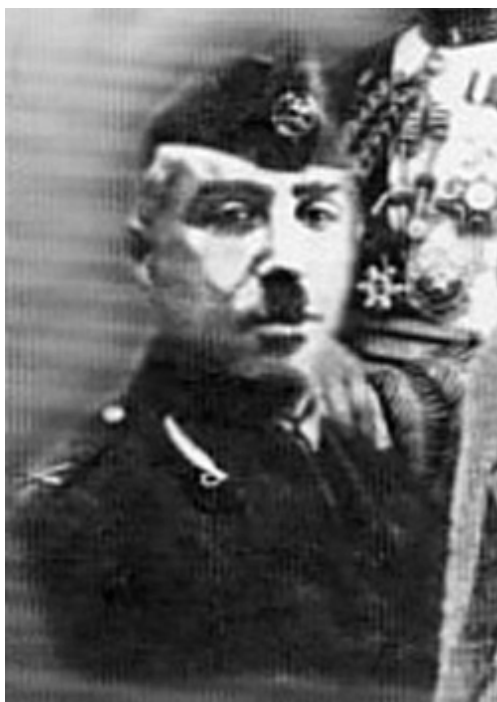
E. Photographie de Bakr Sidqi, source Wikipédia, photo non datée et anonyme.