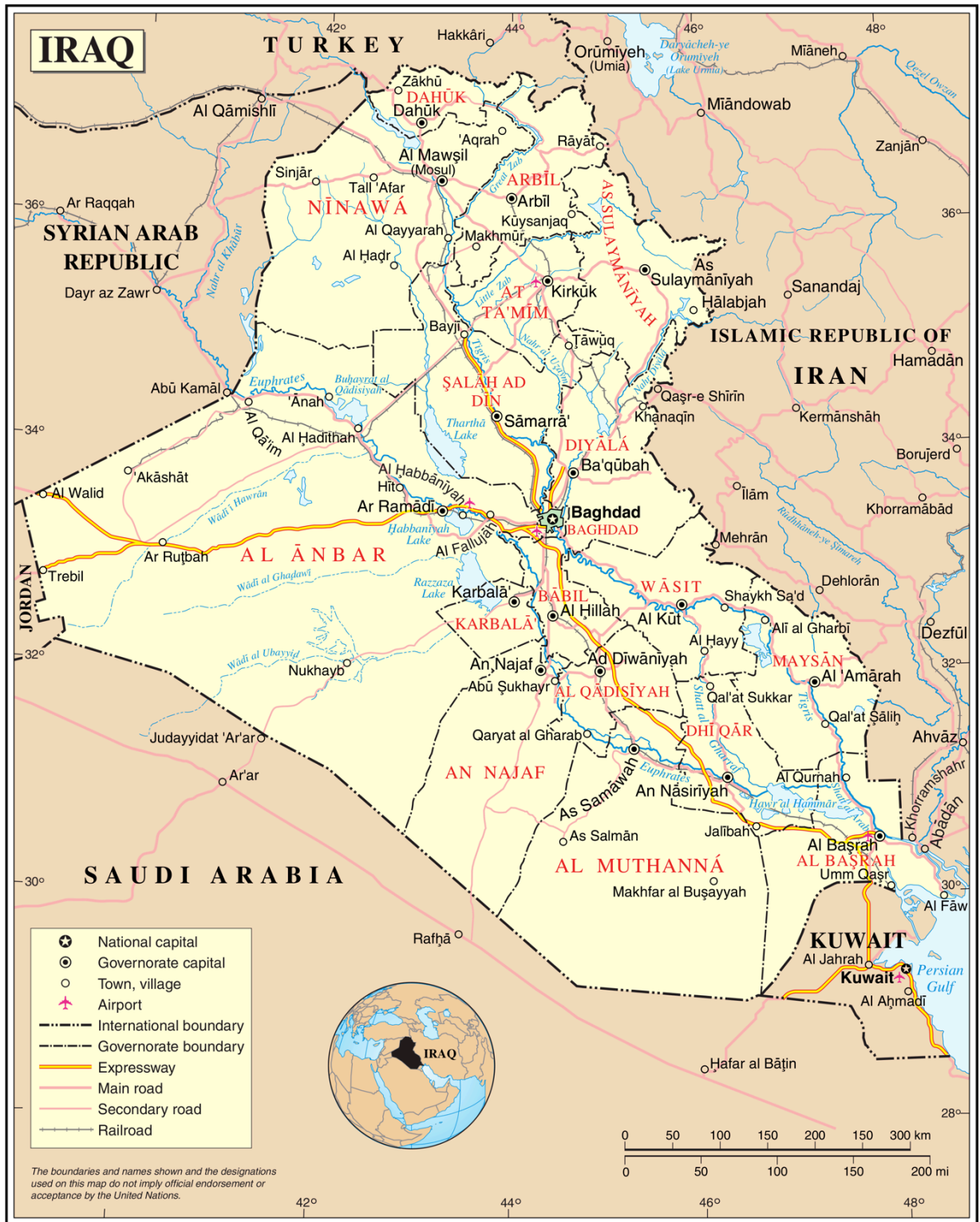
N. Carte de l'Irak et de ses villes principales, Source : Wikipédia, non datée.