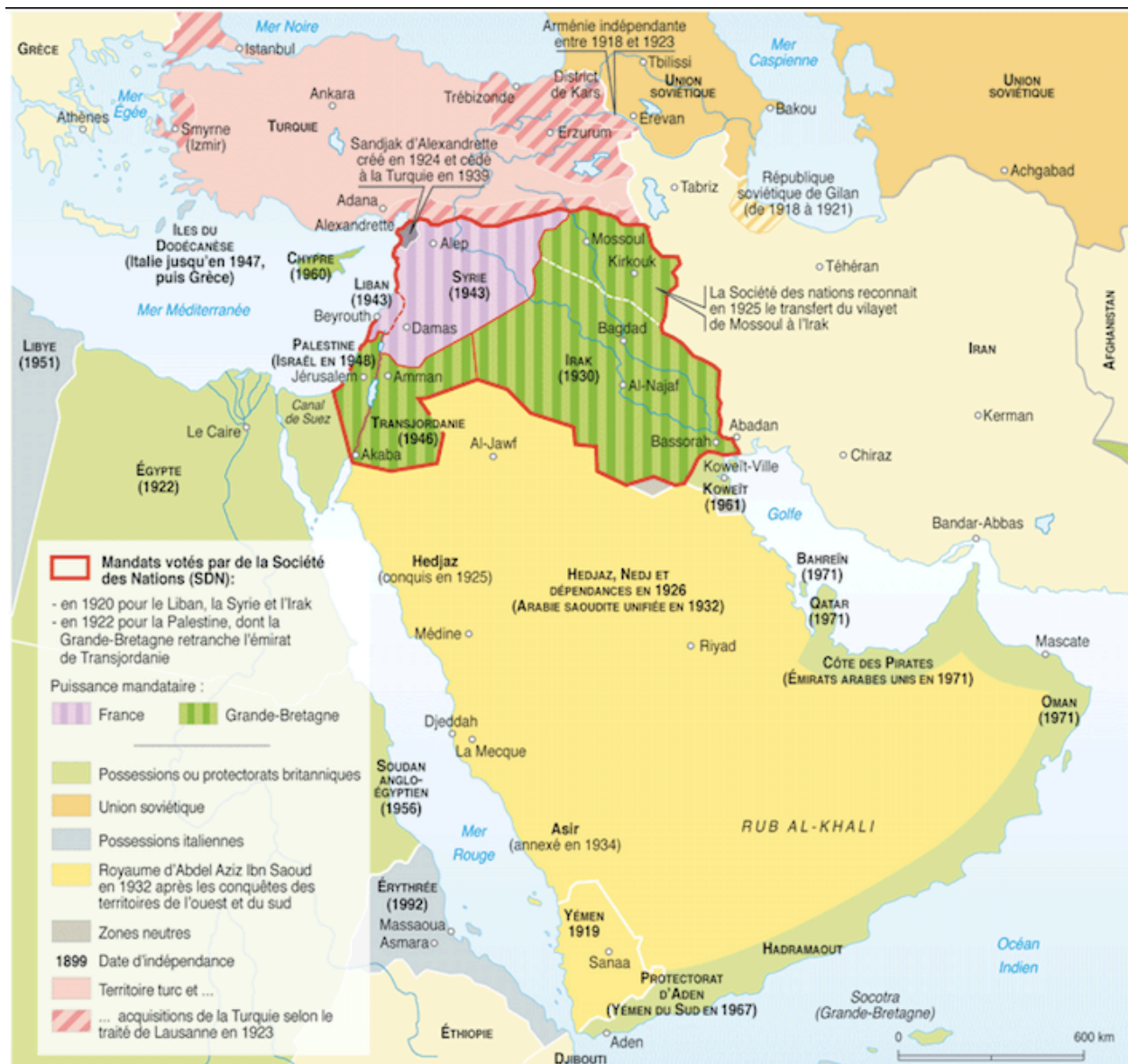
C. Carte représentant les Mandats votés par la SDN en 1920 et 1922 au Moyen Orient, d'après les traités de Sèvres et de Lausanne. Sources: G. Blake, J. Dewdney, J. Mitchell, The Cambridge Atlas of the Middle East and North Africa , Cambridge University Press, 1987 ; Olivier Da Lage, Géopolitique de l'Arabie saoudite , éditions Complexe, Bruxelles, 1996 Cartes originales annexées aux textes des accords Sykes-Picot et des traités de Sèvres (1920) et de Lausanne (1923).