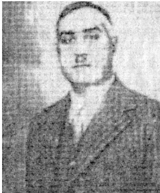
O. Photographie de Hikmat Suleyman.

révoltes devinrent très importantes, et se diffusèrent jusqu'à Hilla tout au Sud du pays, dépassant les espoirs des scénaristes de ce complot. De leur côté les leaders de al Ikha incitaient d'autres cheikhs au Nord du pays de se rebeller contre le pouvoir en place pour multiplier les fronts insurrectionnels. Alors que les révoltes se multipliaient dans le pays depuis janvier 1935, Ali Jawdat voulait l'armée pour les réprimer, c'est à dire, d'envoyer Sidqi, le commandant en chef des armées du Nord. Cependant, Hikmat Suleyman avait auparavant projeté son plan à son ami Sidqi, qui l'avait soutenu dans la répression des révoltes assyro-chaldéennes de 1933, lui conseillant de ne prêter aucun support à la répression, en contrepartie du soutien d' al Ikha , une fois arrivé au pouvoir. Chose que Sidqi accepta. C'est un moment charnière pour Sidqi, car il fait ici faux bond au pouvoir officiel dans l'idée d'acquérir plus de pouvoir si le parti al Ikha , qu'il aurait aidé, arrivait au pouvoir. C'est aussi le moment où Sidqi rentre dans le jeu politique, activement, et que l'armée se politise. Il n'est pas surprenant que Bakr Sidqi accepte de participer à ce complot politique. Il avait prit goût à cela en entretenant des relations étroites avec Hikmat.