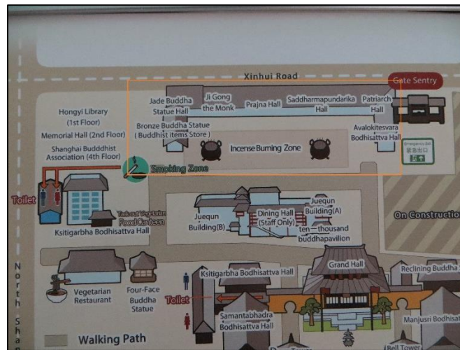
Fig. II – Encadré en orange : « cour arrière » du temple (hall du Bouddha de Jade, boutique d'objets religieux, brûleurs d'encens)

ne reconnaisse pas officiellement, ou du moins ne mette pas en avant, les boutiques d'objets parareligieux qui ne sont pas gérées par ses employés et ses moines. D'ailleurs, la carte mentionne deux autres espaces où les visiteurs peuvent faire des achats, dits « articles religieux et souvenirs ». Il s'agit de deux boutiques, proches de l'entrée du site cette fois-ci, dans lesquelles on retrouve à nouveau des employés du temple derrière les comptoirs et des moines qui conseillent.