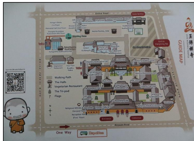
Fig. 1 - Carte du Temple du Bouddha de Jade, disponible en libre-service

En 2014, le temple refait parler de lui lorsque commence le chantier pour son ambitieux projet de rénovation. Selon l'organisation du temple 168 , ce sont des inquiétudes concernant des questions de sécurité, notamment des risques d'incendie, qui ont motivé le projet. Avec l'aval du