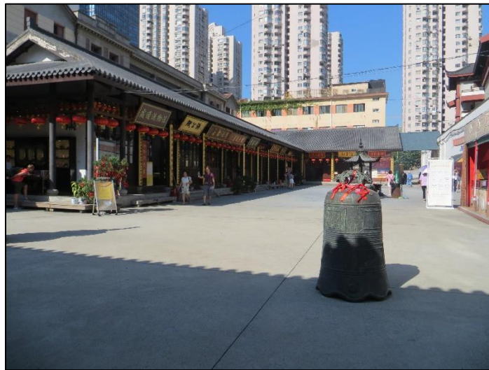
Fig. III – « cour arrière » du temple

Parmi les changements les plus notables, nous devons parler du déplacement de la célèbre statue du Bouddha de jade. Le pavillon qui l'abritait a été détruit et elle est désormais logée dans une salle au coin du bâtiment des boutiques. Cette zone, entouré par des boutiques et le dos du bâtiment Juequn , peut difficilement s'appeler « cours ». Bien qu'on y trouve deux brûleurs d'encens qui sont beaucoup utilisés par le public, il semblerait que peu ait été fait pour véritablement aménager cet espace en « cours » : le sol est en béton, on n'y trouve aucun élément de végétation, aucun endroit n'a été prévu pour s'asseoir, etc. (Fig. III). Le choix de déplacer la statue de jade dans cet espace nous semble assez curieux. Bien qu'étant la pièce maîtresse du temple, elle est désormais isolée en dehors du cœur religieux du temple. Sans les nombreux panneaux qui indiquent le chemin, il serait difficile voire impossible pour un visiteur de la trouver. A l'origine, toute la renommée et la raison d'être du temple tourne autour des statues de jade. Bien que le temple en porte le nom, d'autres éléments sont venus s'ajouter, qui stimulent l'intérêt des visiteurs.