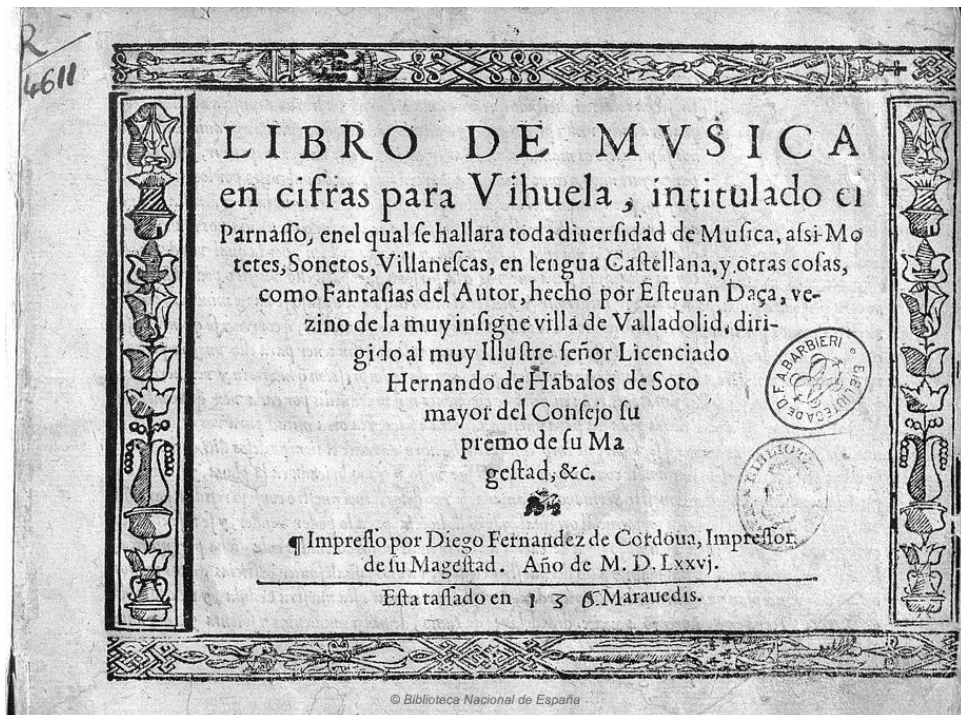
Figure 1. Libro musica

vihuela 46 ; Enrique de Valderrábano, avec son Libro de música de vihuela intitulado Silva de Sirenas , de 1547; ou, parmi d'autres, Esteban Danza, qui écrivit le dernier livre sur la vihuela, El Parnaso 47 , daté de 1576. De même, nous trouvons aussi le Ramillete de flores o colección de varias cosas curiosas , une anthologie poétique qui contient dix ouvrages pour vihuela, daté de la fin du XVI e siècle 48 .