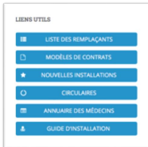
Figure 3 Menu du site internet du CDOM du Var (35)

Certains médecins de notre étude ne sont pas équipés de l'outil informatique. A ce jour, la recherche d'un successeur se fait via la voie numérique. Nous pouvons aisément imaginer une participation du CDOM à la mise en avant de ces cabinets. En effet, le site internet du CDOM du Var met en avant les remplacements et les nouvelles installations mais pas les cabinets recherchant des successeurs.