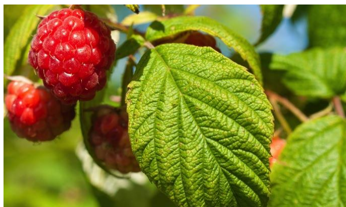
Feuille de framboisier

Le framboisier est un arbrisseau et aussi un arbre sous forme de plante à tiges dressées, cylindriques pouvant atteindre 1,5 à 2 m de haut.