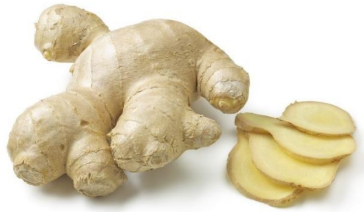
Rhizome de gingembre

Le gingembre est une plante vivace tropicale herbacée d'environ 0,90 m de haut issue d'un rhizome (racine).