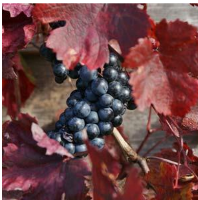
Feuille de vigne rouge

La vigne rouge est une plante ligneuse à tige grimpante, munie de vrilles, mesurant environ 80 cm de haut. Les rameaux (ou sarments), portent des feuilles palmatilobées et dentées. Vertes au printemps, elles rougissent au moment de l'automne. Les fleurs, odorantes, sont vertes et regroupées sous forme de grappes.