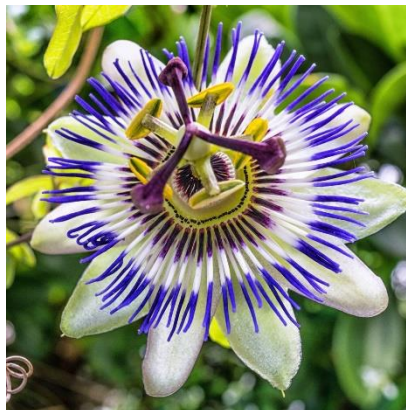
Fleur de passiflore

Elle tire son nom du fait que les missionnaires jésuites d'Amérique du Sud se servaient, pour représenter la Passion du Christ de la fleur de cette liane : son pistil, ses différentes pièces florales ressembleraient à une couronne d'épines, au marteau et aux clous de la crucifixion.