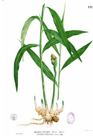
Plant de gingembre