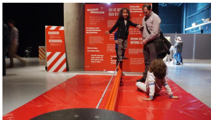
Image 7 : Le câble de funambulisme de l'exposition « Risque, osez l'expo ! »