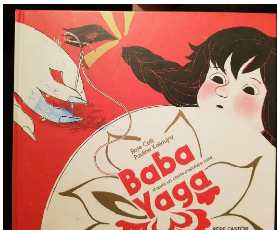
Figure 1 : photographie de la première de couverture de Baba Yaga , écrit par Rose Celli et illustré par Pauline Kalioujny

L'album choisi pour cette étude est Baba Yaga . Cette histoire est un conte traditionnel russe, raconté par Rose Celli et illustré par Pauline Kalioujny.