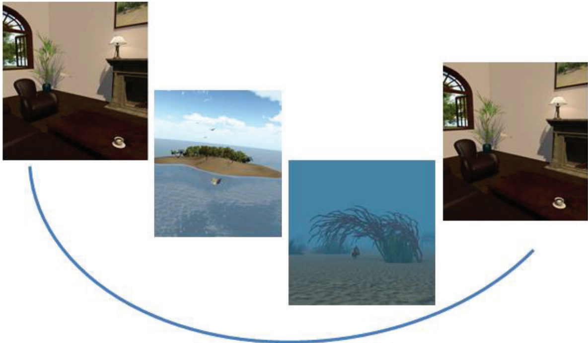
Prises de vue durant l'immersion sensori-virtuelle

Cette immersion est possible grâce à l'installation stéréoscopique Barcotm constituée de deux écrans LED Full HD de 70" d'une résolution de 1920x1080 pixels, qui permet d'afficher des images de synthèse de haute qualité, avec 3D possible pour un effet plus réaliste.