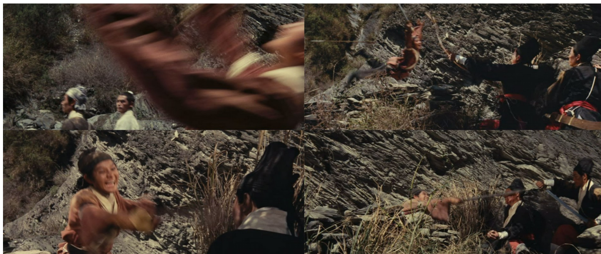
Fig. 13 - Dragon Gate Inn

Bien que l'on soit face à un flux d'images, il est difficile de ne pas songer ici au régime de monstration d'un art proche du cinéma : la bande dessinée, ou l'art de pouvoir rendre compte, au seul moyen d'un découpage très limité, tout autant de la vélocité d'une action que de la précision des gestes qui la composent. Son appréhension étant confrontée au passage du temps, le montage n'a pas d'autre choix ici que d'enchaîner promptement les différentes phases de cette offensive s'il veut rendre compte de ce double enjeu. À cet égard, le lancer du bol de nouilles à travers le réfectoire, exemple évoqué en première partie, voit son surdécoupage œuvrer à de pareils effets. Par cette approche, King Hu prend donc le risque de perturber l'appréhension des actions qu'il nous représente, mais en garantit assurément l'ardeur, l'intensité.