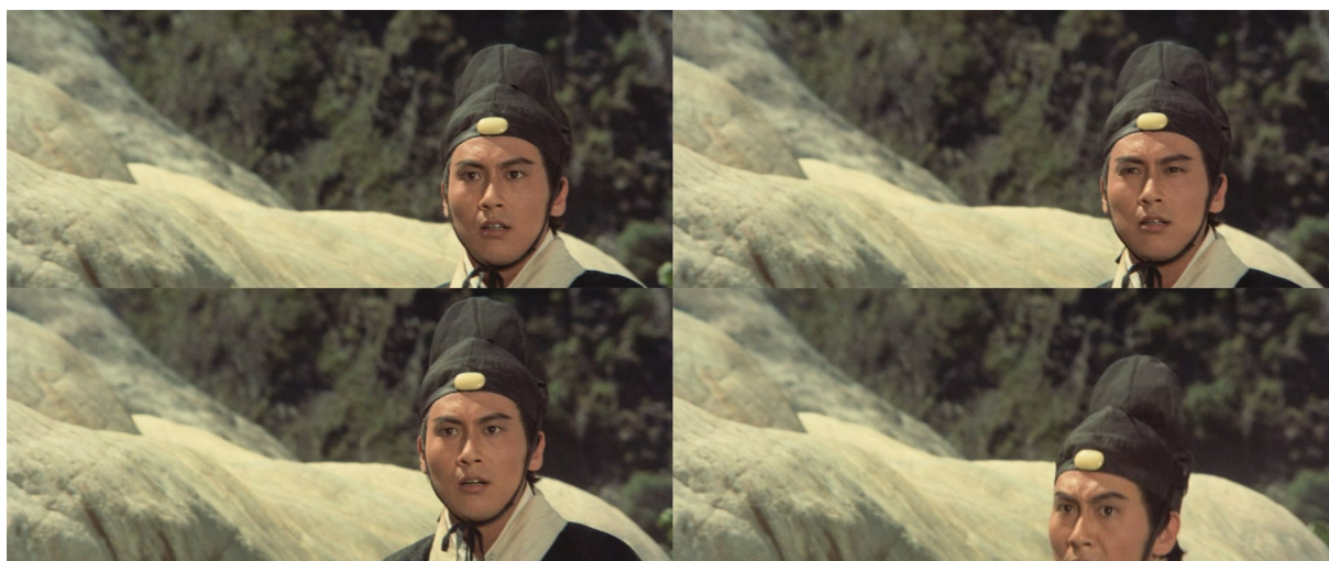
Fig. 11 - A Touch of Zen

Enfin, en guise de dernier exemple, nous pourrions également évoquer l'utilisation d'un autre modèle percussif dans A Touch of Zen . En cherchant à mettre la main sur les protagonistes en fuite, Ouyang Nian et ses hommes se retrouvent confrontés à l'émérite bonze, accompagné par ses disciples. Ignorant sa grande maîtrise martiale, Ouyang provoque le moine et se voit vivement repoussé par ce dernier. Ayant à peine retrouvé son équilibre, toute son orgueil et sa détermination à accomplir sa tâche se manifestent alors dans un plissement distinct des yeux, filmé en gros plan. Précisément en cet instant, son regard réprobateur est distinctement accentué par un court schéma rythmique composé, dans le cas présent, de trois battements clairs de tambour (fig. 11 – photogramme 2). Le plan suivant, un gros plan à hauteur de sa taille, nous le montre enfin dégainer son épée. À travers ces quelques occurrences, on constate ici que les percussions ne sont pas exploitées afin de coïncider avec la surprise présumée du spectateur, mais uniquement celle déjà véhiculée par le personnage : le marquage sonore se fait sur l'état d'étonnement même et non à l'instant où son objet nous est donné à voir.