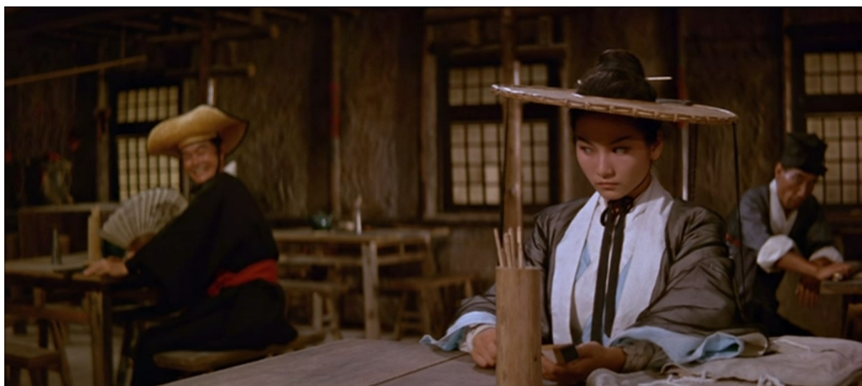
Fig. 1 - L'Hirondelle d'or

On va alors assister à tout un jeu de regards croisés, complices, entre les hommes de la police secrète, et suspicieux, entre ces derniers et le protagoniste. Ces échanges sont efficacement renforcés par le cadrage qui, en plus de s'être globalement resserré, nous laissant mieux percevoir les visages tendus des personnages, va suggérer l'enfermement du corps du héros en le montrant sous différents angles et points de vue. Est ainsi soulignée la proximité du protagoniste avec les autres corps, obstruant souvent les différents coins du cadre et barrant ainsi les possibles issues (fig. 1).