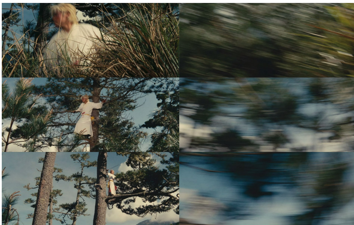
Fig. 14 - Dragon Gate Inn

En quelques occasions, le mouvement corporel peut être encore plus fortement minimisé. Alors, toute la mobilité du personnage n'est plus suggérée que par le passage d'un plan à un autre ou par les vifs balayages de la caméra. Toujours dans Dragon Gate Inn , lors du dernier combat opposant le groupe de protagonistes à l'eunuque, ce dernier tente de fuir la confrontation par le biais d'une série de déplacements apparaissant comme instantanés (fig. 14).