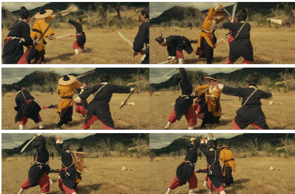
Fig. 6 - Dragon Gate Inn

Ainsi, comme nous avons pu le voir et comme ces propos l'illustrent bien, « la portée et l'enjeu du combat se retrouvent déjà intégralement dans les différentes phases du duel : un saut, un bond, une parade, une feinte. Dans ce cas, l'individu semble se fondre uniquement dans l'effort ou l'aisance de sa lutte 62 ». « Sa portée » (c'est-à-dire ses qualités représentationnelles) découle finalement de son « enjeu », de sa détermination narrative. Autrement dit, plus élevées sont les forces qui s'opposent dans ces combats, plus stylisé en sera le traitement, ces phases précises étant les témoins les plus directs. L'acuité de leur marquage dans le temps est variable, d'un film à l'autre, d'une scène à l'autre, et rend plus ou moins compte de cette soucieuse régularité du mouvement, telle que nous avons pu l'observer ici. De telles occurrences se retrouvent cependant à plusieurs occasions dans chacun des films et laissent pressentir une grande rigueur dans leur mise en place, dans leur préparation. À ce titre, ce grand soin apporté à la dimension percussive du corps est assurément à rattacher aux exigences attendues des athlètes de l'Opéra de Pékin dans leur exercice du rythme. Leurs duels, exempts de toute approximation, se distinguent par leur assimilation à de véritables danses dont la grande sophistication fait que toute interaction physique se vaut tout à la fois comme un coup et un contre.