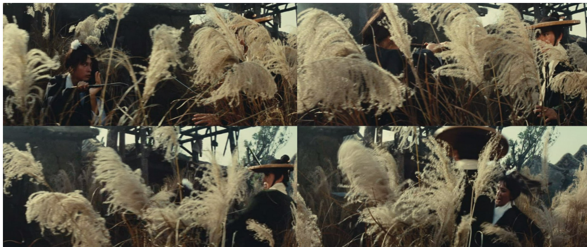
Fig. 17 - A Touch of Zen

qui recule et prépare à son tour sa défense. La végétation qui s'imisce devant la caméra, animée par une légère brise, ne nous accorde alors qu'une visibilité par intermittence de leurs corps (fig. 17).