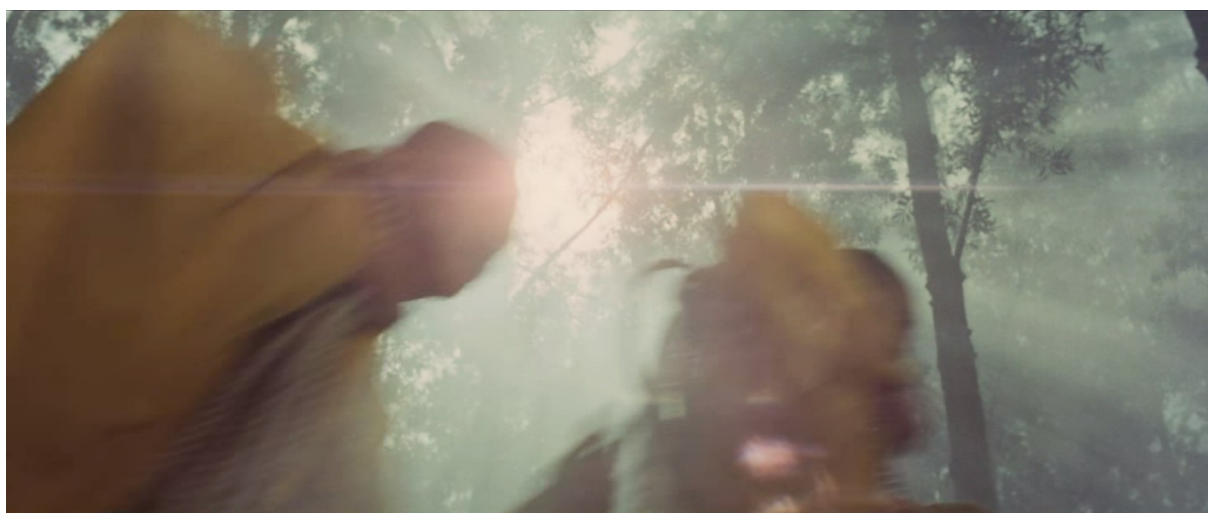
Fig. 16 - A Touch of Zen

Pareillement, de nombreuses autres occurrences de ce décentrement volontaire du corps peuvent se constater dans A Touch of Zen . L'entrée du moine dans la dernière partie du récit donne lieu à un véritable montage de formes mouvantes, de gestes et d'effets autonomes mis en mouvement dans un espace devenu totalement incertain et ne semblant être motivés que par leur seule valeur contemplative. Les décentresments qui interviennent inversent la hiérarchie habituelle du plan et valorisent l'arrière-plan naturel et l'environnement non plus comme de simples supports au déploiement corporel, mais comme véhicules et réceptacles originels de la force du moine. Celle-ci étant associée entre autres aux radiations solaires, le cadre est ainsi fréquemment focalisé sur le soleil alors que les corps du bonze et de ses disciples passent de part et d'autre de son éclat, devant, dessous, etc. (fig. 16).