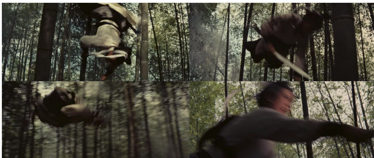
Fig. 12 - A Touch of Zen

Son corps, à ce moment fragmenté et volatil, devient tout à fait imprévisible aux yeux de ses deux opposants. Cette fulgurance du montage et des fragments qui le composent annoncent