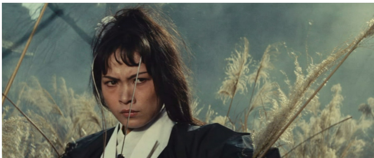
Fig. 4 - A Touch of Zen

la stabilité de sa posture (fig. 4). Ensuite, dans un raccord regard avec son adversaire, elle apparaît statique sous un autre gros plan de moins d'une demi-seconde cette fois-ci : « Yang se tient immobile, son épée prête à frapper. Le plan ne dure que 9 photogrammes, ce qui dynamise son immobilité [...]. [Ce] plan statique de mademoiselle Yang fait office de ponctuation forte 35 [...] ». Ici, pris dans le rythme de la succession de brefs plans tantôt centrés sur Yang, tantôt sur Ouyang, l'effet immédiat de la prestance de l'héroïne sur Ouyang se fait davantage ressentir.