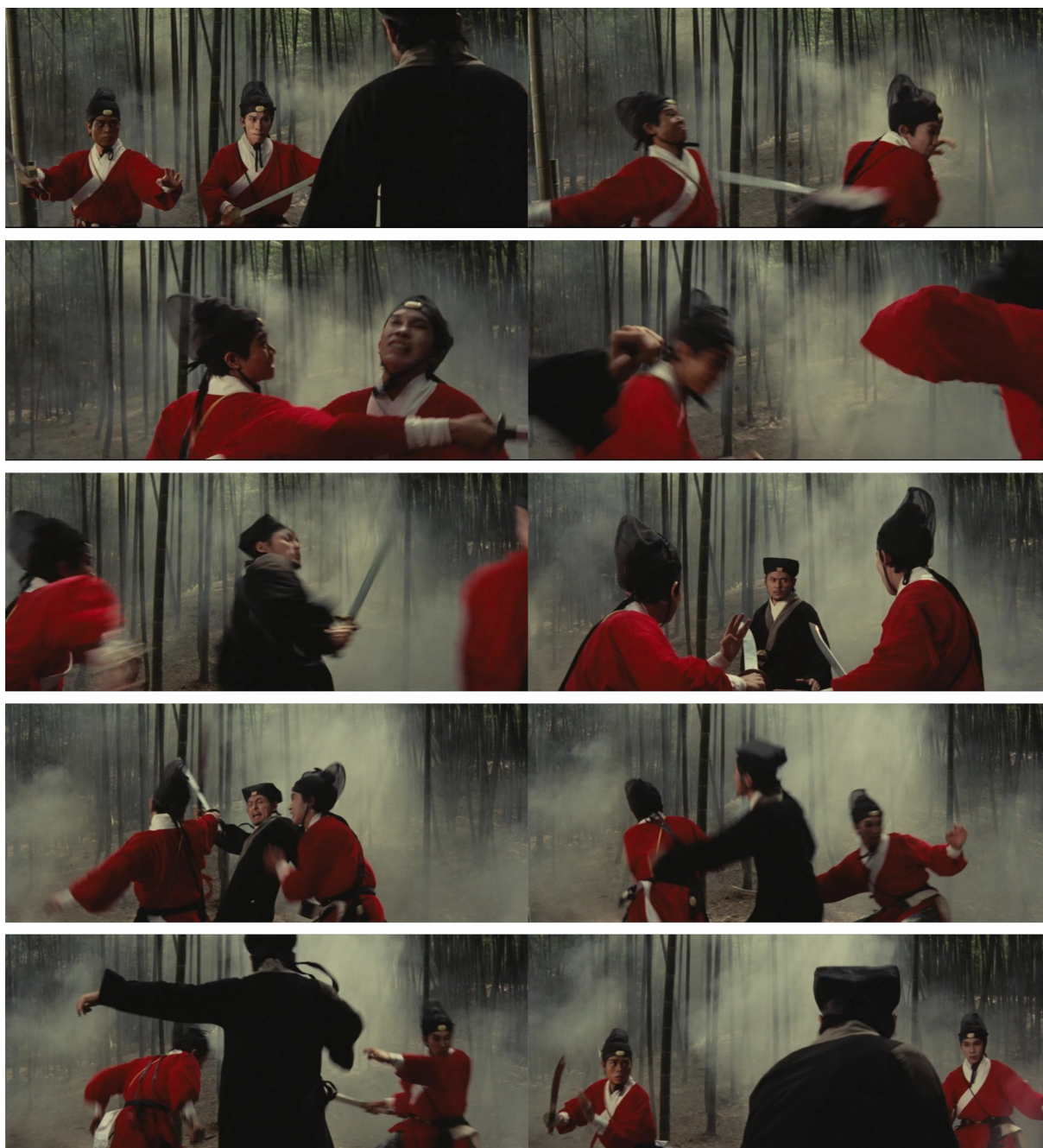
Fig. 7 - A Touch of Zen

En soumettant ainsi l'enchaînement aux enjeux de son exposition au regard, King Hu se situe dans une logique similaire à celle des chorégraphes de l'Opéra de Pékin. Comme le faisait justement remarquer Bertolt Brecht, en abordant la question de la distanciation dans cet art dramatique :