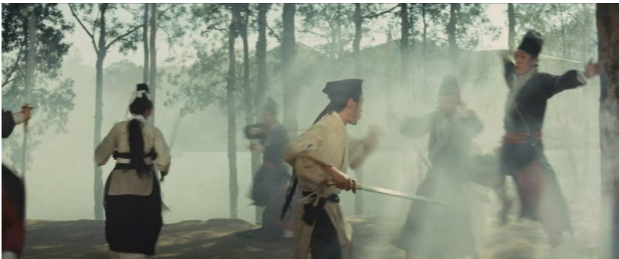
Fig. 18 - A Touch of Zen

Alors que Yang et le général Shih viennent au secours du peintre Gu Shengzai, recherché après avoir orchestré la défense de la forteresse désertée, les protagonistes vont être confrontés à un certain nombre d'espions impériaux au bord d'une étendue d'eau. Après quelques échanges de coups, un plan de demi-ensemble nous montre le groupe d'opposants, dos au lac, progresser lentement vers l'avant-plan. De droite à gauche, une fumée traverse le champ et voile certaines silhouettes à différents degrés d'intensité. Un retour en contrechamp nous donne à voir les deux héros s'élançant en basculant dans le hors-champ par le côté gauche du cadre. Dans un raccord mouvement, ils chargent alors la formation ennemie sous un plan moyen ponctué par un bref travelling latéral de gauche à droite, suivant leur progression. À nouveau, l'action évolue au sein d'un espace très diffus dont l'épaisse fumée agit comme une couche uniformisante. Par sa densité, cette brume parvient par moments à gommer la ligne d'eau s'étendant au loin sous la chaîne de montagnes, faisant alors se fondre l'un dans l'autre ces deux espaces (fig. 18).