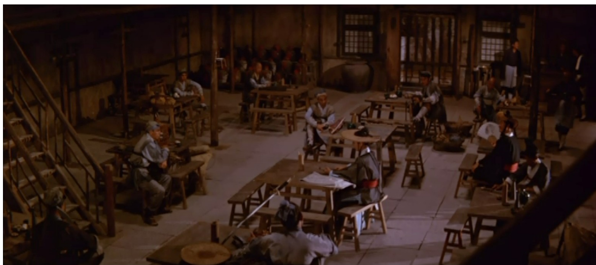
Fig. 9 - L'Hirondelle d'or

D'autre part, la mise en scène insiste beaucoup sur les positions de personnages, leurs variations, et sur leurs rapports de proximité. Par plusieurs plans de demi-ensemble, Hu donne à constater clairement la distance séparant l'héroïne de ses ennemis, ne faisant qu'augmenter le sentiment d'angoisse inhérent à la situation. Par ce type de cadrage, le spectateur est alors en mesure de quantifier le danger, d'en détecter les zones critiques et d'observer les différents points de tiraillements dont est victime le protagoniste (fig. 9).