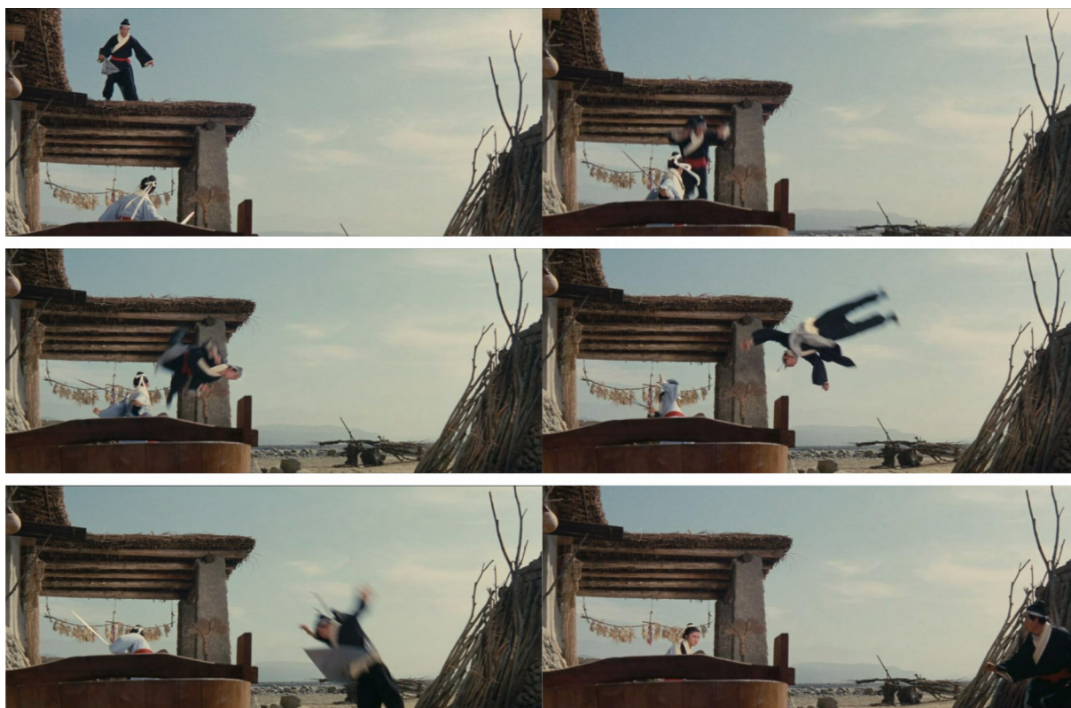
Fig. 10 - Dragon Gate Inn

acrobaties est fondamentale pour l'Opéra de Pékin. Il est même d'usage, dans certaines troupes, d'interrompre le cours de l'action et de solliciter, par les gestes d'un acrobate tourné vers la salle, l'enthousiasme du public. Moins explicitement, mais dans une volonté similaire, King Hu offre ici au spectateur le plaisir visuel d'une acrobatie qui, de fait, ne saurait trouver de justifications logiques à sa mise en place.