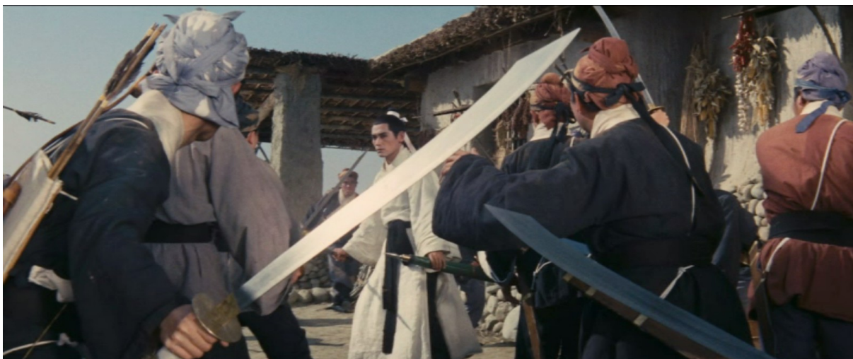
Fig. 3 - Dragon Gate Inn

Dans cet exemple, Xiao Shaozi se retrouve seul, encerclé par cette ceinture d'opposants, dans un espace de plus en plus claustrophobe à mesure que la caméra s'éloigne. Moins présente dans A Touch of Zen , cette configuration préliminaire à une collision brutale et simultanée des corps se retrouve surtout dans Dragon Gate Inn et L'Hirondelle d'or et peut également mettre en valeur la singularité d'un personnage opposant tel que l'eunuque, dont les capacités surpassent celles des protagonistes. Cette lente progression finale des opposants au sein du cadre évolue vers un point culminant, un véritable débordement des tensions accumulées : les attaques synchrones portées sur le protagoniste.