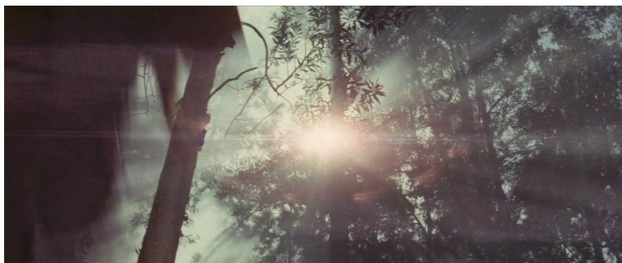
Fig. 19 - A Touch of Zen

Comme on a pu l'observer, lors de l'entrée du moine et de ses disciples dans la confrontation au terme du film, le montage multiplie les points de vue qui décentrent l'attention en faisant de l'arrière-plan illuminé et de la végétation alentour les principaux centres de focalisation de la prise de vue. Par la brièveté des passages des moines, ces derniers se réduisent à une succession abstraite de trajectoires, de directions, de traînées horizontales, diagonales ou verticales qui tendent à se vider de toute présence corporelle (fig. 19).