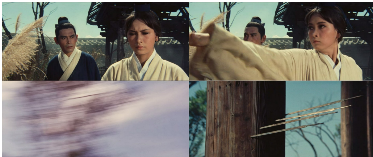
Fig. 5 - A Touch of Zen

Par l'accélération qu'elles peuvent procurer à la résolution d'un combat et par les retournements de situation dont elles sont capables, ce type d'offensive ajoute aux potentialités de l'action. On constate ainsi que leur représentation ne se soucie pas tant de leur déploiement logique et précis dans l'espace que de l'effet d'immédiateté qu'elle est susceptible de produire par ces raccourcis. À nouveau, en allant directement à l'essentiel de l'action, le cinéaste en décuple le choc, vécu comme tel tout autant par les personnages que par les spectateurs, pris de court par l'ellipse. Ainsi, en amplifiant certains enjeux stratégiques et en cherchant à décupler les effets propres aux différentes manœuvres offensives, la mise en scène de King Hu parachève véritablement le déploiement des corps et assure ainsi la portée spectaculaire des actions qu'ils entreprennent.