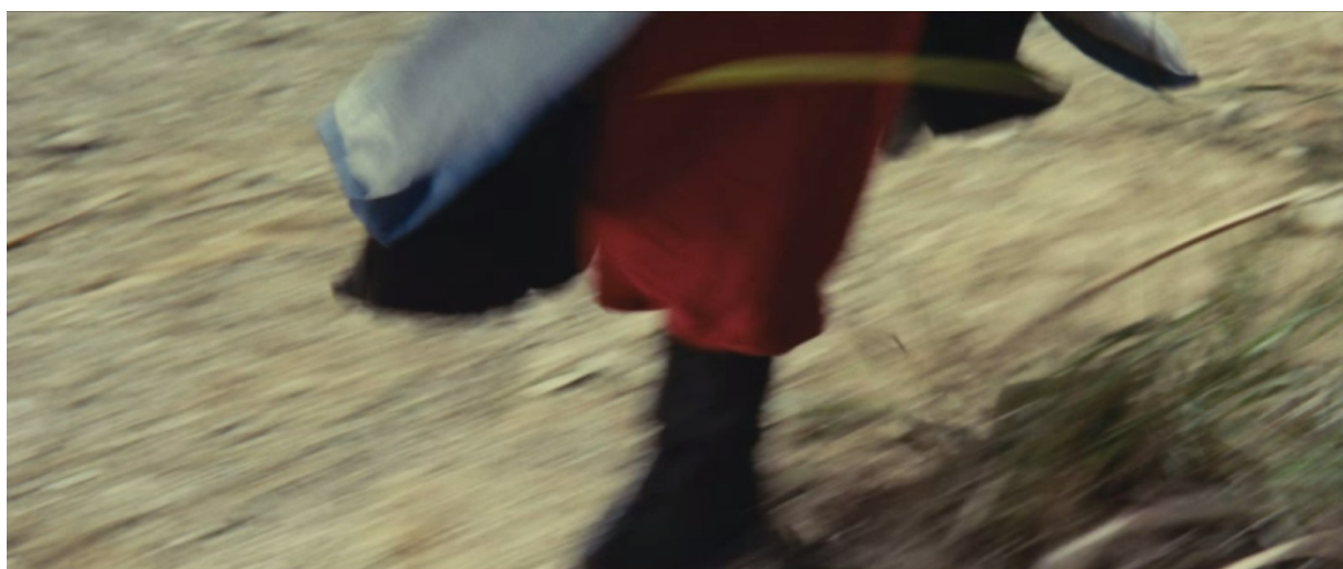
Fig. 8 - Dragon Gate Inn

Dans ce plan, focalisé sur le battement des pieds, le bref parcours qui est strictement accompli est intemporel et non localisé. On peut dire que ce segment est tout à la fois le début, le milieu et la fin du trajet qui sépare le groupe de ce personnage. Ici, il n'est plus qu'une « silhouette chargée de donner forme, provisoirement, à une valeur, une fonction, une idée, [...] un emblème, un vecteur réclamant interprétation : littéralement, il est un faire-valoir 70 ». En définitive, cette focalisation permet d'épurer, de distiller le mouvement : il y a là la volonté de n'en présenter que l'essence et de le rendre ainsi malléable à l'expérience du spectateur, libre d'en déterminer l'encrage spatio-temporel, d'en compléter mentalement les conditions d'émergence.