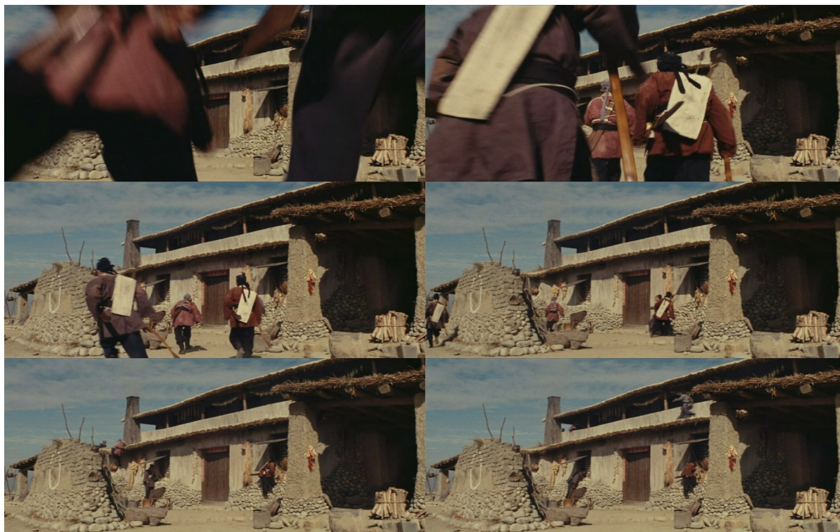
Fig. 2 - Dragon Gate Inn (de gauche à droite puis de haut en bas)

évolutions à l'intérieur du champ : cette soumission à l'attraction du corps primordial, dans ce décor devenu parcours (fig. 2).