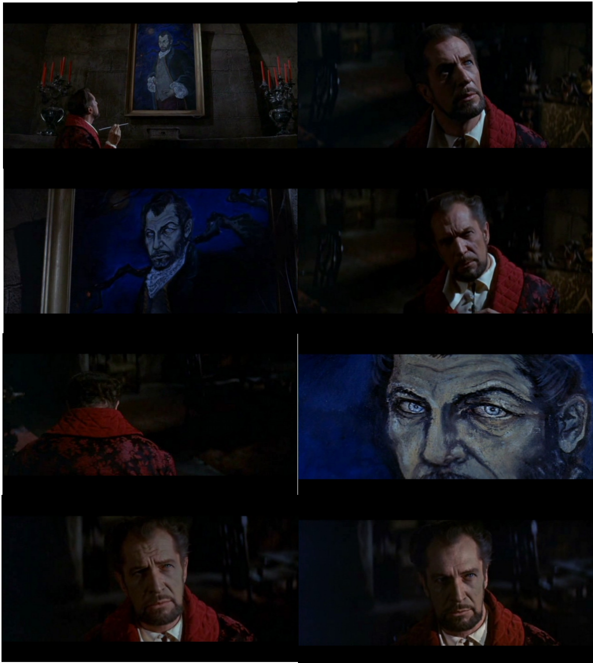
De gauche à droite et de haut en bas : Fig. 25, 26, 27, 28, 29, 30, 31, 32 : La Malédiction d'Arkham

Cette fois, il détourne péniblement la tête en tremblant légèrement, comme s'il cherchait à fuir les yeux de son ancêtre. Il redresse ensuite la tête, comme pour tenter de défier ce regard qui l'écrase, mais est très vite vaincu, se retournant cette fois vers l'arrière du cadre, tournant le dos à la caméra et au tableau [Fig. 29]. Le plan suivant revient sur ce dernier, mais montre cette fois les yeux du portrait de Curwen en gros plan, ce qui donne l'impression qu'il les dirige droit vers Charles qui lui tourne le dos [Fig. 30]. Enfin, un autre contrechamp revient sur le protagoniste qui, comme interpellé par le tableau, se retourne, la tête plongée dans ses mains. Il la relève lentement, son expression de terreur