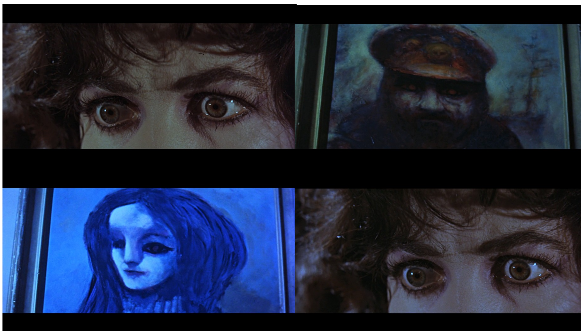
De gauche à droite et de haut en bas : Fig. 19, 20, 21, 22 : La Chute de la maison Usher

qu'émettaient les personnages rêvés par Philip quelques scènes plus tôt. Puis la caméra revient sur les yeux de Madeline, transformée non seulement par son aspect, mais aussi par le montage la rattachant aux fantômes Usher, en un corps surnaturel, qui est passé du monde rêvé de Philip au monde réel, maintenant envahi par les images issues du subconscient du protagoniste [Fig. 19-20-21-22] .