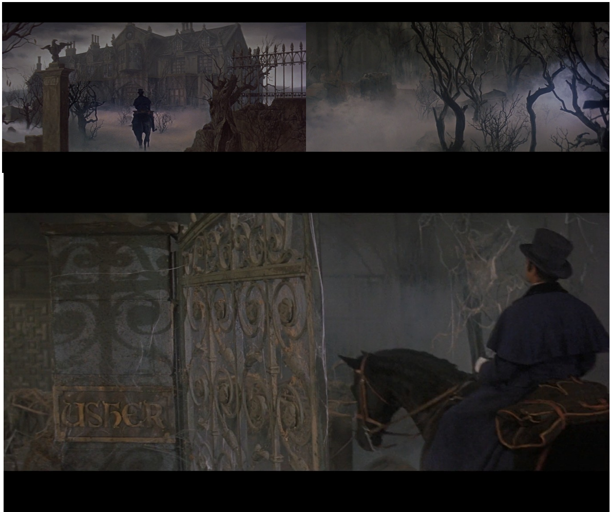
En haut à gauche : Fig. 2. En haut à droite : Fig. 3. En bas : Fig. 4 : La Chute de la maison Usher

Ainsi, nous avons pu voir une des façons dont Corman parvient à traduire le point de vue du narrateur de la nouvelle de Poe à l'écran. Durant la séquence d'ouverture du film, plus le personnage s'approche du manoir Usher, plus la caméra semble s'approcher de son point de vue, si l'on se met à envisager les termes de focalisation et d'ocularisation. Il va même jusqu'à placer un plan en vue subjective pour immerger le spectateur dans le décor et faire découvrir celui-ci à travers les yeux du personnage. Seulement, nous pourrions constater dans la même séquence qu'il y a un véritable jeu sur les points de vue, et que les deux premiers plans du film, qui créent un champ-contrechamp, ne renvoient pas nécessairement au regard du personnage du cavalier. Il y a ici une ambiguïté que nous allons tenter d'expliquer, en nous intéressant à la manière dont Corman filme ses décors.