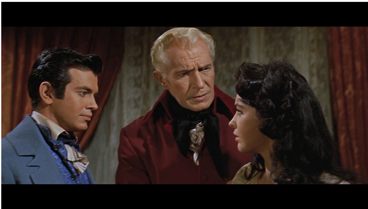
Fig. 9 : La Chute de la maison Usher

Le décor du film est très différent, beaucoup plus coloré, cela se justifiant d'une part par l'utilisation du Technicolor, mais qui fonctionne également comme une symbolique pour introduire un élément de récit. En effet, la chambre est entièrement éclairée et teintée de couleurs chaudes, avec notamment beaucoup de teintes rouges dans les rideaux, les draperies, les bougies, les meubles, des couleurs que l'on retrouvera aussi dans beaucoup d'endroits de la maison. Cette omniprésence de tons rouges, si elle s'éloigne du décor décrit par Poe, montre néanmoins l'application avec laquelle Corman inscrit ses décors dans son récit. En effet, si l'on s'intéresse aux costumes des personnages, Philip porte un costume de couleur bleue, le mettant en parfait décalage avec le code couleur de la maison, faisant de lui un intrus. Roderick, lui, porte un long manteau de couleur rouge, en harmonie avec le décor. Madeline, quant à elle, porte une robe de couleur blanche, montrant sa pureté et une forme de neutralité, puisqu'elle est attachée aux deux personnages. Durant tout le film, tout un rapport de force entre Philip et Roderick est en effet développé, Philip voulant emmener Madeline avec lui tandis que Roderick lutte pour la faire rester à ses côtés. La sœur de Roderick sera au milieu de ce rapport de force, couleur blanche attirée par deux forces attractives que représentent les deux personnages [Fig. 9].