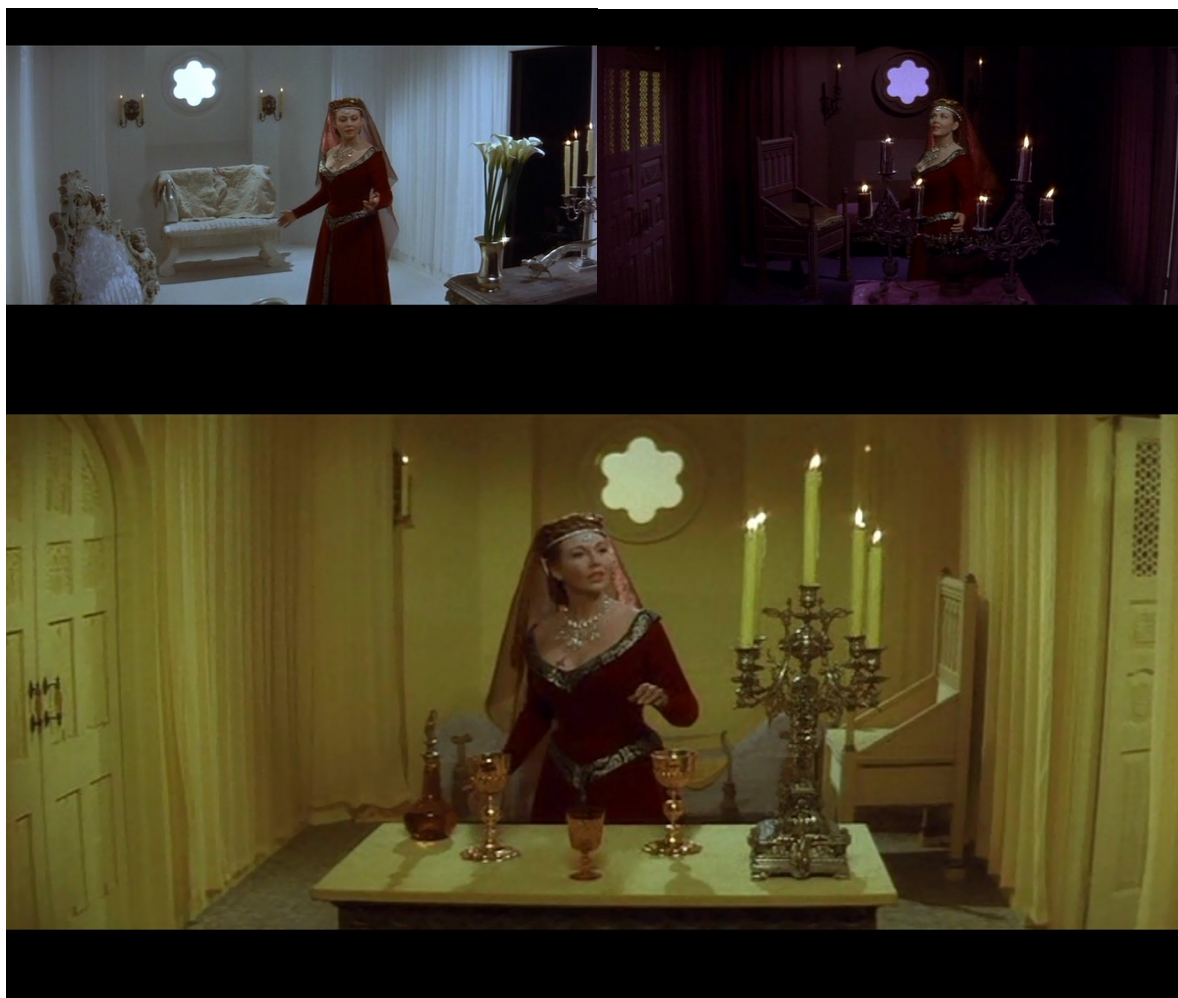
En haut à gauche : Fig. 16. En haut à droite : Fig. 17.

monde imaginaire et surnaturel de son subconscient à l'écran, dans le monde diégétique du film [Fig. 16-17-18].