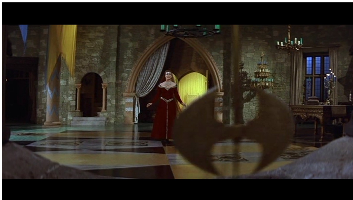
Fig. 10 : Le Masque de la mort rouge

Juliana, dans le plan que nous évoquions, se trouve en arrière-plan derrière le mouvement perpétuel de la hache pendule, nous savons que son heure est venue [Fig. 10].