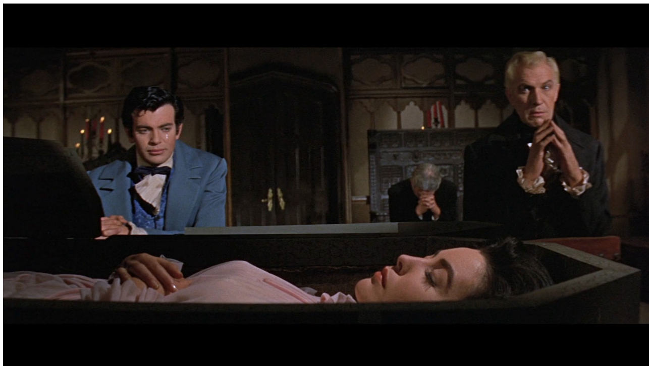
Fig. 24 : La Chute de la maison Usher

en arrivant derrière le cercueil, et en s'abaissant, de façon à cadrer chaque personnage, Madeline dans son cercueil compris, de trois quarts. Sur la fin de ce mouvement, Philip brise le silence en disant : « Au moins, elle a trouvé la paix ». Une coupure ponctue cette réplique, et sur le plan suivant la caméra se trouve cette fois face aux personnages. Le cercueil, ouvert sur Madeline, est au premier plan, Roderick et Philip se trouvent au deuxième plan, mains jointes au-dessus du corps de la défunte, et nous voyons le majordome en arrière-plan.