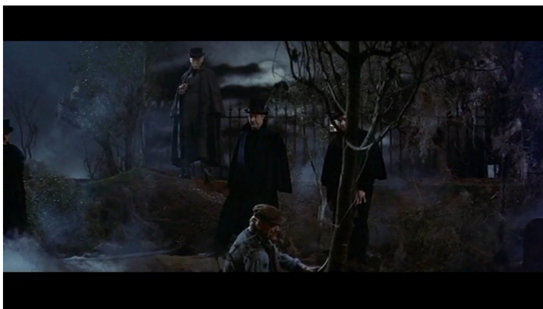
Fig. 23 : L'Enterré vivant