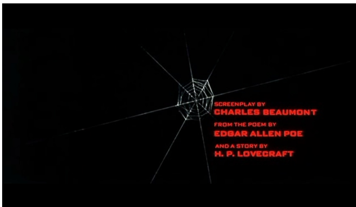
Fig. 1 : La Malédiction d'Arkham

À propos de La Malédiction d'Arkham , il est tout d'abord intéressant de voir la différence entre le titre du film en version originale et le titre qui lui a été donné pour la version française. En effet, le titre original, The Haunted Palace , nous l'avons vu, fait directement référence à Poe et à son poème du même nom, qui est fictivement écrit par Roderick Usher, et que l'on peut alors lire dans la nouvelle La Chute de la maison Usher . Le titre français du film, La Malédiction d'Arkham , fait référence à l'auteur Howard Phillips Lovecraft, puisque la ville d'Arkham est un lieu récurrent et primordial dans l'œuvre de ce dernier. Ces deux titres semblent alors être ceux de deux œuvres différentes, ce qui montre bien l'originalité de cette adaptation de manière générale, mais également au sein du cycle Poe. En effet, La Malédiction d'Arkham est en réalité plutôt une adaptation du roman de Lovecraft intitulé L'Affaire Charles Dexter Ward , comme nous l'avons dit en introduction. L'histoire racontée par le film ainsi que les personnages renvoient tous à l'œuvre lovecraftienne. Pourtant, il est particulièrement fait mention de Poe dans le générique et au début du film, dans le but de rester sur la lancée des succès des films précédents ( La Malédiction d'Arkham est le sixième film du cycle Poe).