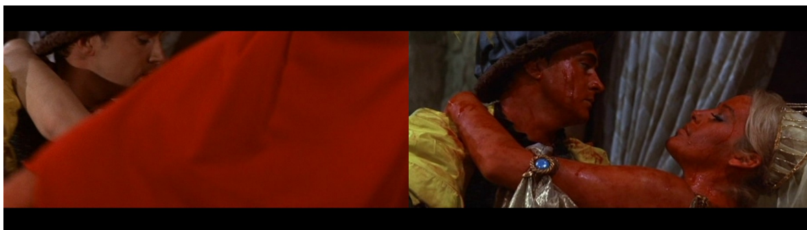
À gauche : Fig. 33. À droite : Fig. 34 : Le Masque de la mort rouge

Ce thème est traité frontalement dans un autre film de notre corpus. En effet, Vincent Price est confronté à un autre de ses doubles dans Le Masque de la mort rouge , un double annonciateur de la mort du personnage. À la fin du film, alors que le bal organisé par le prince Prospero (qu'incarne Vincent Price) bat son plein, une silhouette entièrement vêtue de rouge fait son apparition. Cette couleur a été bannie par le prince, à cause de sa connotation avec la mort rouge qui ravage son pays. Prospero se lance alors à la poursuite de l'intrus en traversant la foule dansante, et il le retrouve dans la dernière de ses chambres colorées, à savoir celle qui est tapissée de noir. Croyant avoir affaire à un ambassadeur de Satan avec qui il a auparavant pactisé, le prince se réjouit. L'intrus est recouvert de tissu rouge et son visage est dissimulé derrière un masque, qu'il refuse dans un premier temps de retirer. Suivi de près par le prince, cet être mystérieux, qui rappelle fortement l'homme qui échange avec la vieille femme dans la scène d'introduction, déambule au milieu des danseurs. À plusieurs reprises, il s'arrête à côté de ces derniers et passe le tissu de son vêtement devant la caméra, de façon à occuper tout l'écran [Fig. 33].