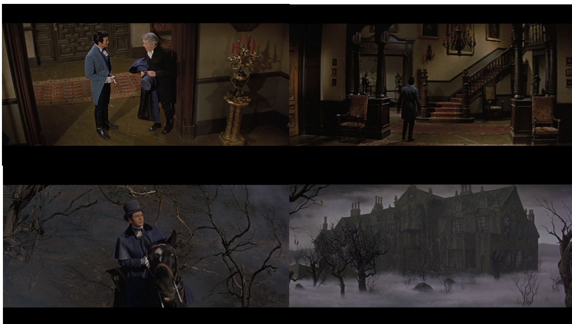
De gauche à droite et de haut en bas : Fig. 5, 6, 7, 8 : La Chute de la maison Usher

situé plus à sa hauteur et elle ne filme plus ce qu'il voit. Cela nous donne l'impression que c'est de nouveau le décor qui épie, qui observe le personnage, à l'image du premier plan du film. Un raccord est ensuite effectué et la caméra, qui se trouve de nouveau à la hauteur de Philip, se place progressivement dans son dos, et nous fait voir l'intérieur de la maison de son point de vue [Fig. 6], dans un plan en contrechamp qui fait écho aux deux premiers plans du film que nous avons analysés plus tôt [Fig. 7-8] .