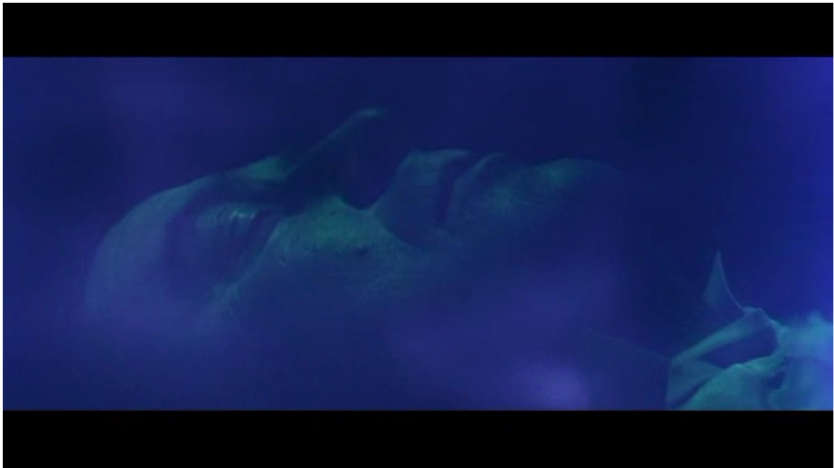
Fig. 11 : L'Enterré vivant

Le spectateur serait alors confronté à des images directement issues du subconscient de Guy, qui est hanté par la mort. Corman procède donc à une exploration psychologique de son personnage, tout comme le fait Poe dans ses récits, et il fait de l'esprit de ses protagonistes un lieu envahi par des images de mort. Si, dans L'Enterré vivant , le cinéaste tend à nous montrer la mort, voire un certain type de mort (ici l'inhumation prématurée), comme une véritable obsession qui conditionne la vie de son personnage, il existe dans notre corpus d'autres exemples de scènes à analyser qui n'ont cependant pas toujours le même sens.