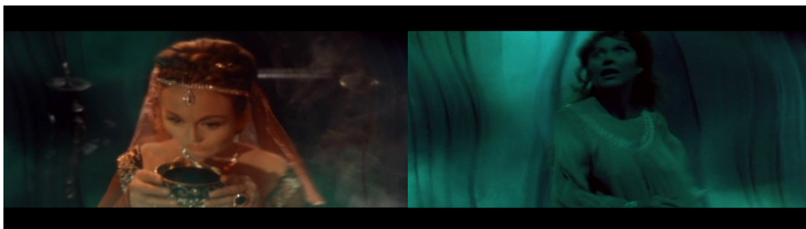
De gauche à droite : Fig. 14, 15 : Le Masque de la mort rouge

sont rattachées à la mort rouge. La lucarne rouge ainsi que le costume de Juliana nous donnent un indice sur son sort à venir. La caméra se déplace ensuite de nouveau vers la gauche, et Juliana se lève et s'avance. La caméra termine son mouvement afin d'être face au personnage, et nous pouvons voir apparaître en bas de l'écran ce qui ressemble à un autel cérémonial, sur lesquels reposent, en premier plan, une dague ainsi qu'une coupe dorée remplie d'un liquide rouge. Une fumée d'encens flotte devant Juliana, qui est devant l'autel, mains jointes, toujours en train de psalmodier. Elle saisit la coupe et la porte à ses lèvres, et à ce moment l'image perd en netteté, les bijoux du personnage scintillent, et alors qu'elle boit une gorgée du contenu de la coupe, l'image se déforme, des instruments à cordes jouent un air dérangeant et un fondu enchaîné nous amène au plan suivant, où l'image est toujours déformée, ondulante, et recouverte d'un filtre de couleur vert pâle. Ces déformations surgissent lors de l'accomplissement du rituel par Juliana, et l'image tout comme elle en subit les effets. C'est le personnage qui, à travers cette action, génère l'image surnaturelle [Fig. 14-15].