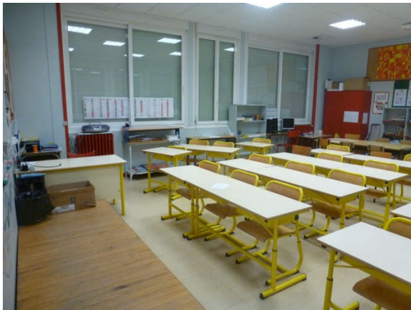
Photo de la classe, de l'entrée