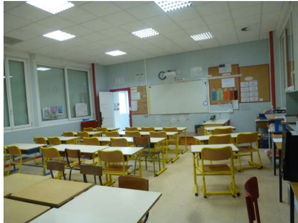
Photo de la classe, du fond