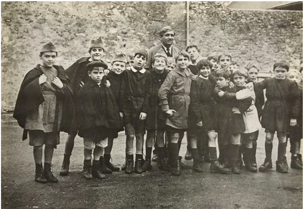
Photographie de tournage de La Maison des bois

L'école, et en particulier la salle de classe, est en effet très présente dans le feuilleton puisqu'elle apparaît dans trois épisodes. Au milieu de l'épisode 4 par exemple, les enfants entrent en classe alors qu'une caricature de l'instituteur est dessinée au tableau. Elle n'est pas sans rappeler les graffitis qu'il filmera sur les tables des lycéens, dans le générique de Passe ton bac d'abord (1978). On peut supposer que la scène est tournée avec deux caméras voire