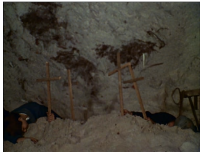
Episode 4 00:10:20