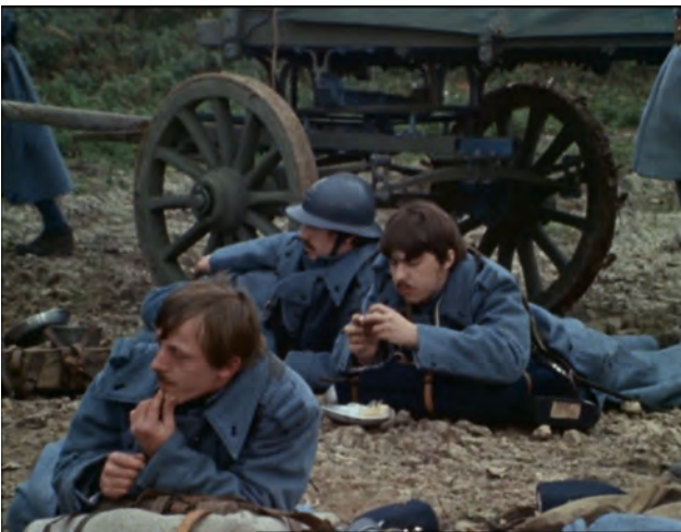
Episode 4 00:04:02