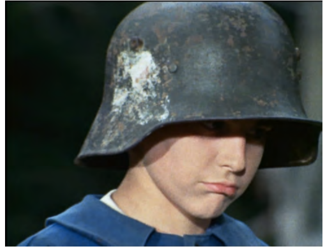
Episode 1 00:33:57