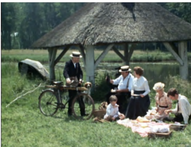
La Maison des bois , Épisode 3 : le pique-nique de la famille Picard