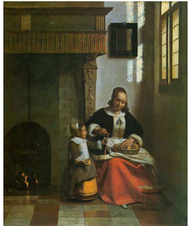
Pieter de Hooch, La Peleuse de pommes , Wallace Collection, Londres, Royaume-Uni, huile sur toile, 1663.