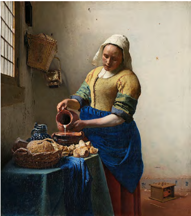
Johannes Vermeer, La Laitière , Rijksmuseum, Amsterdam, Pays-Bas, huile sur toile, 1658.