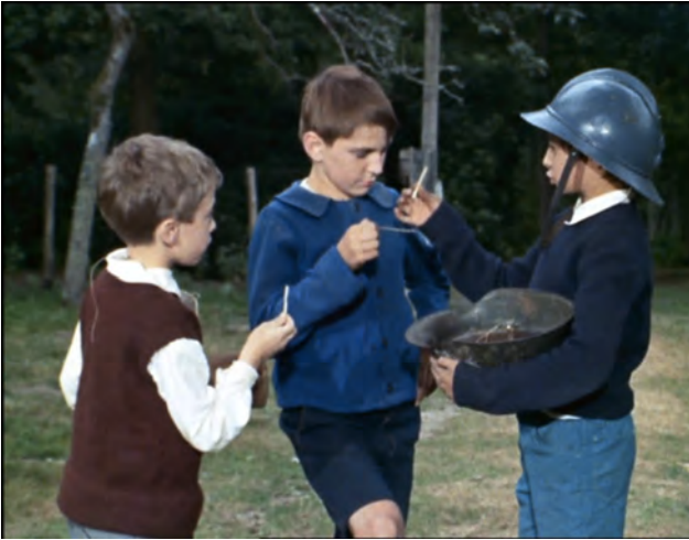
Episode 1 00:33:52