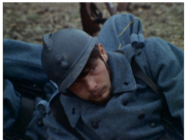
Episode 4 00:05:05