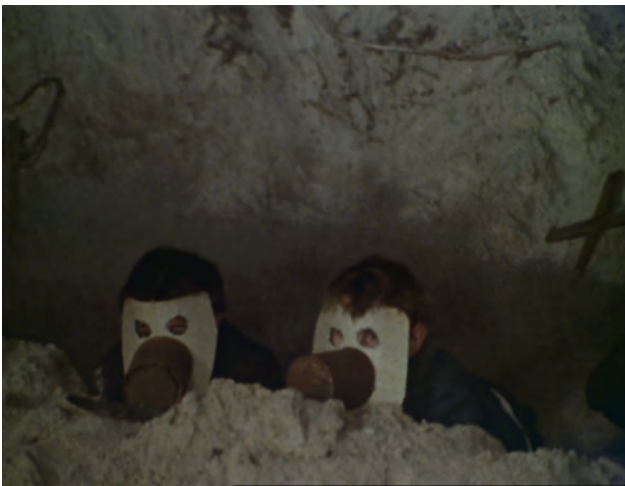
Episode 4 00:10:05