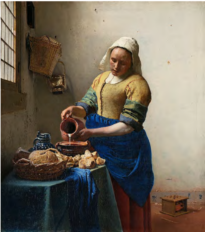
Johannes Vermeer, La Laitière , Rijksmuseum, Amsterdam, Pays-Bas, huile sur toile, 1658.