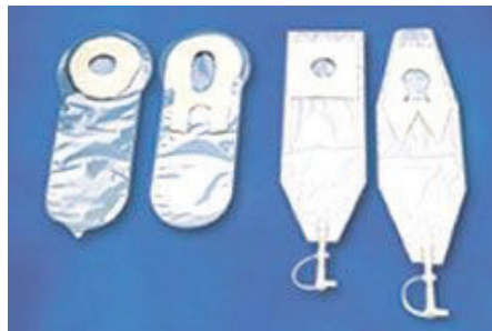
Schéma 3 : Sacs collecteurs fille et garçon

Le sac collecteur d'urine (Schéma 3) est une poche stérile permettant le recueil des urines. La poche est collée, après désinfection, au niveau du périnée et est changée idéalement toutes les 30 minutes.