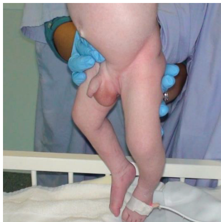
Photo 2 : Tapotements au niveau de la vessie (fréquence : 100/min)