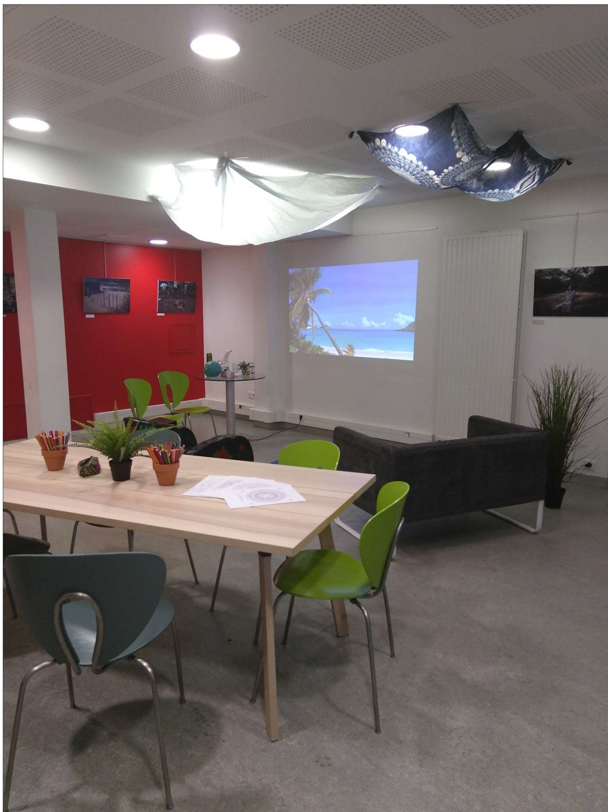
6- ATELIER « UN TEMPS POUR SOI » (VUE DU COTE DROIT)