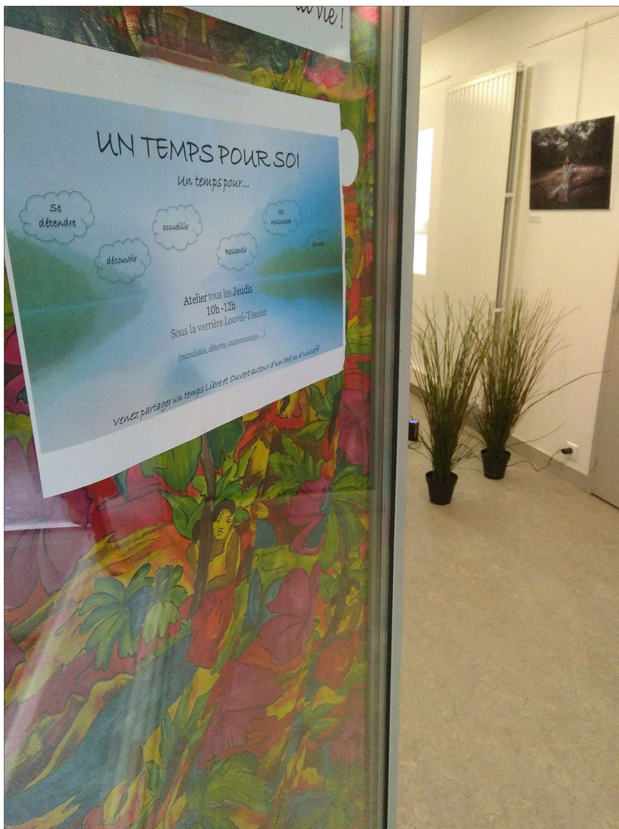
5- ATELIER « UN TEMPS POUR SOI » : ENTREE DE L'ESPACE DEDIE