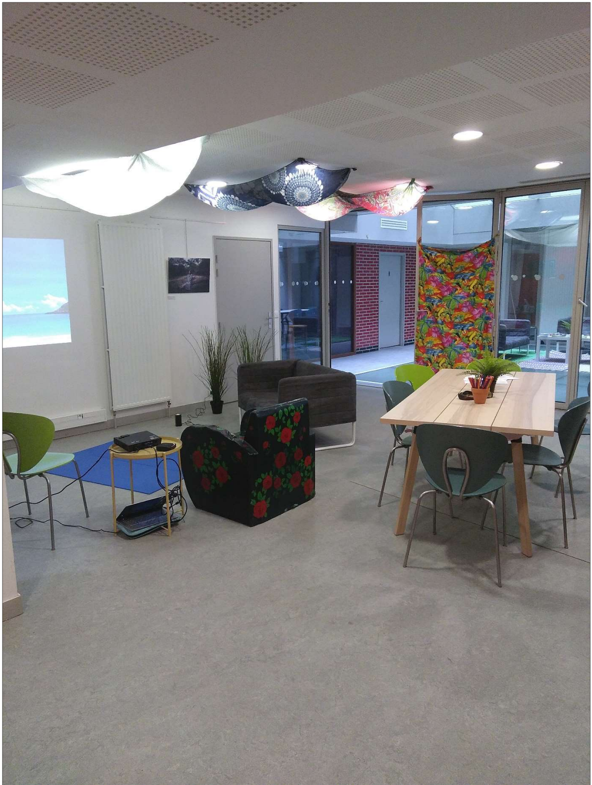
7- ATELIER « UN TEMPS POUR SO » (VUE DE COTE GAUCHE)