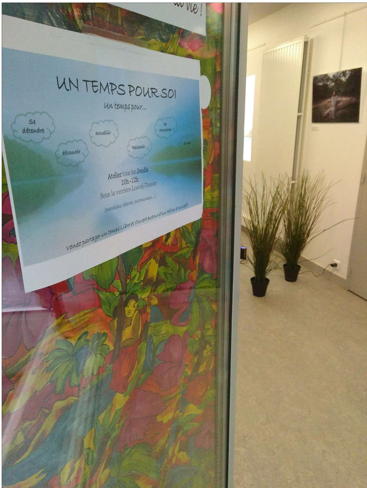
5- ATELIER « UN TEMPS POUR SOI » : ENTREE DE L'ESPACE DEDIE