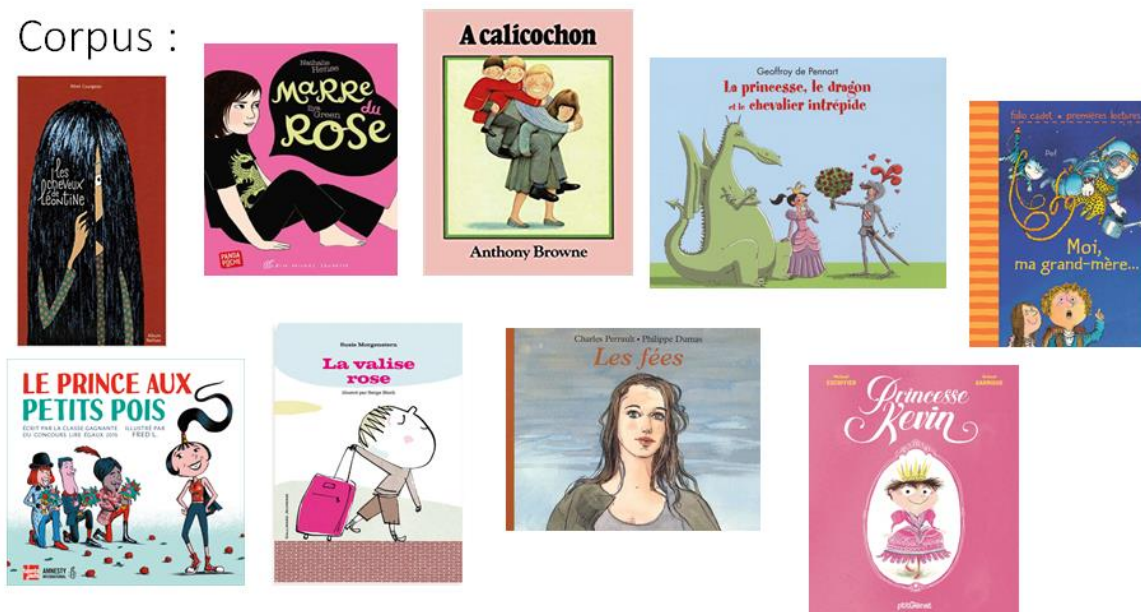
Figure 1 : Corpus d'albums étudié par les élèves