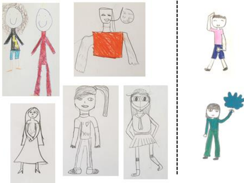
Figure 4 : Extrait des dessins réalisés par les élèves lors du recueil des conceptions initiales sur la représentation de l'héroïne/du héros dans une histoire.

Quant aux dessins produits, ils ont permis également de conclure quant à la présence de stéréotypes de genre, je représente ci-dessous les plus marquants :