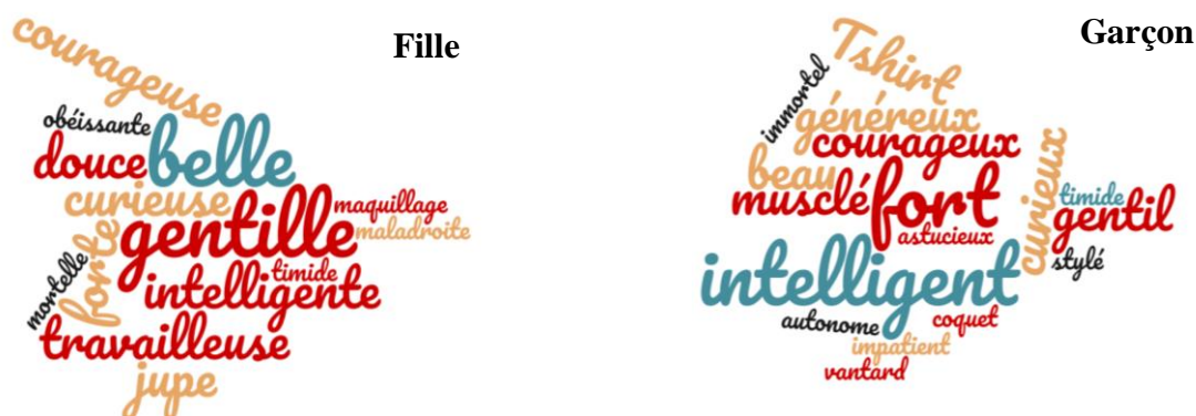
Figure 2 : Représentation schématique en wordclouds des verbatim les plus relevés dans les productions écrites des élèves quant à leur représentation initiales.

Pour rappel, les indicateurs initiaux recueillis ont été des productions écrites et/ou des dessins en réponse à la question suivante : « Pour vous, qu'est-ce qu'un personnage principal féminin/masculin dans une histoire ? ». Les textes produits ont permis, en analysant les réponses et en réalisant des calculs de fréquences de citations des verbatim, de produire les tableaux ainsi que des wordclouds de ces citations.